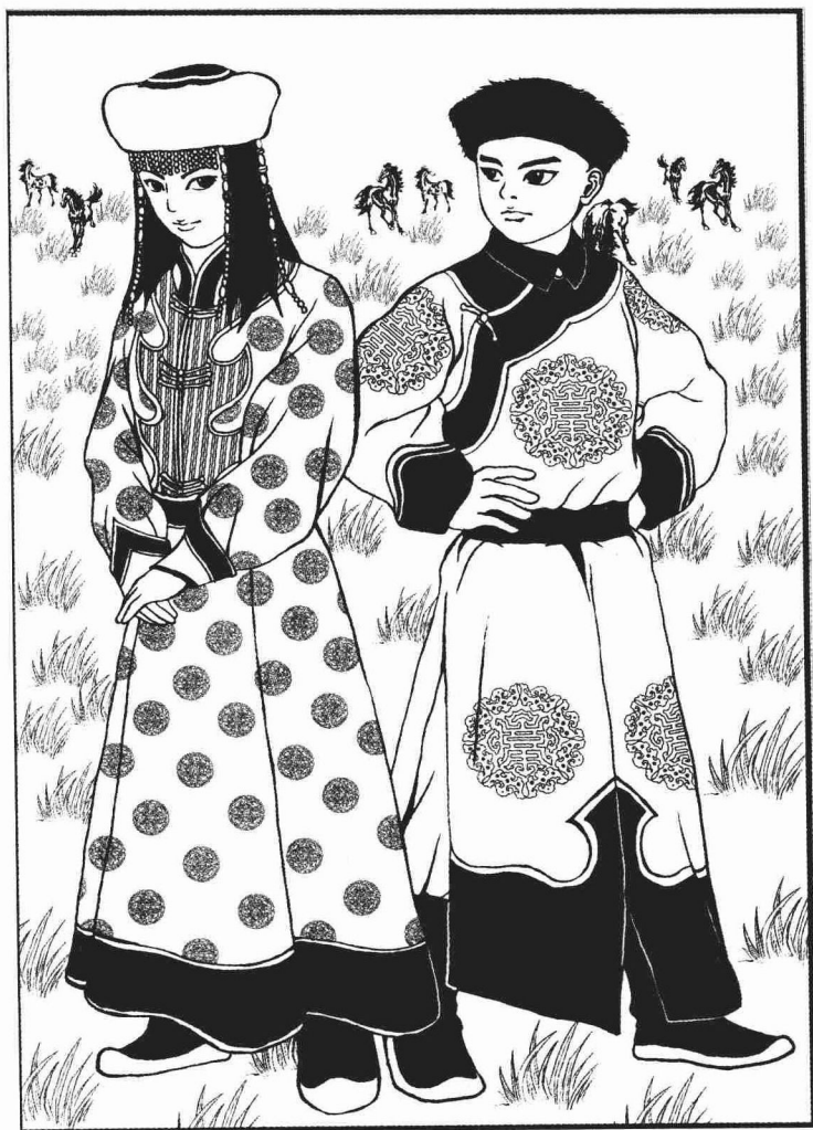
两小无猜：传说中的满蒙第一美女和满洲第一俊男