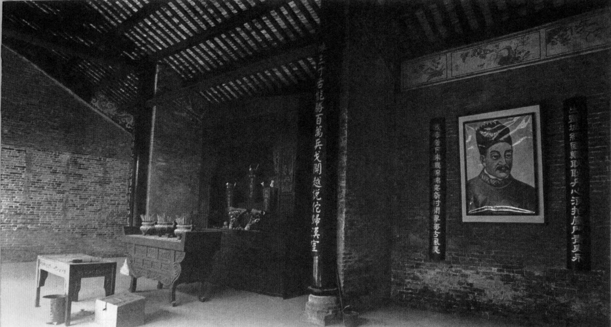
广裕祠陆秀夫画像