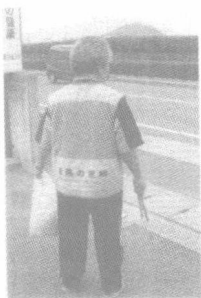
道路的认亲者 (香川县善通寺市)

如果说人与对象之间有物理或心理距离，人对对象的关心就会减弱，相反，距离缩短，关注程度就会增加，那么想方设法缩短物理或心理距离就应该成为有效的环境政策。照片是政策主导的“道路认亲制度”下开展的道路清理的例子。这里，把道路或公园作为某人（个人或者团体）的乡亲来对待。即把某个公园拿来进行“有要做乡亲的吗”的公开招募。例如，如果有人应招将 500 米长的道路作为自己的乡亲，那么对那个人而言，那条道路就不仅是附近的道路了，道路就像自己的孩子一样，他会努力负责地进行打扫。问一下当了乡亲的人，他们说这很有干头。开展“道路认亲制度”的那个市的市长自豪地说，“在本市，已经见不到垃圾了”。这属于缩小心理距离的环境政策的例子，可以说是一个很不错的注意了。