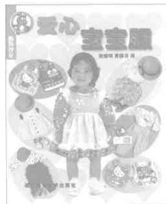
★服饰沙龙·爱心宝宝服