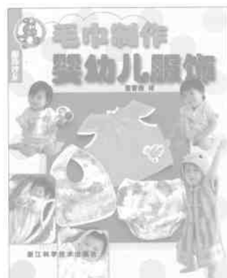
★服饰沙龙·毛巾制作婴幼儿服饰