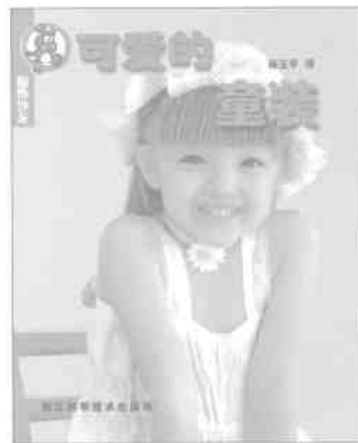
★服饰沙龙·可爱的童装