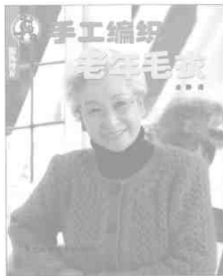
★服饰沙龙·手工编织老年毛衣