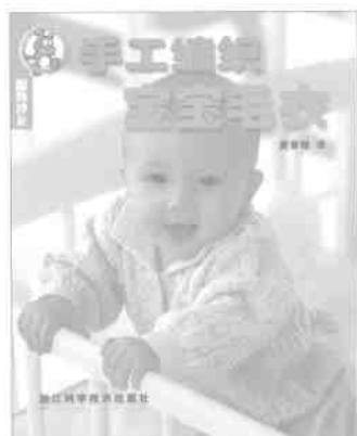
★服饰沙龙·手工编织宝宝毛衣