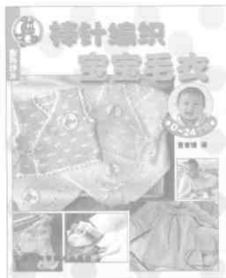
★服饰沙龙·宝宝毛衣