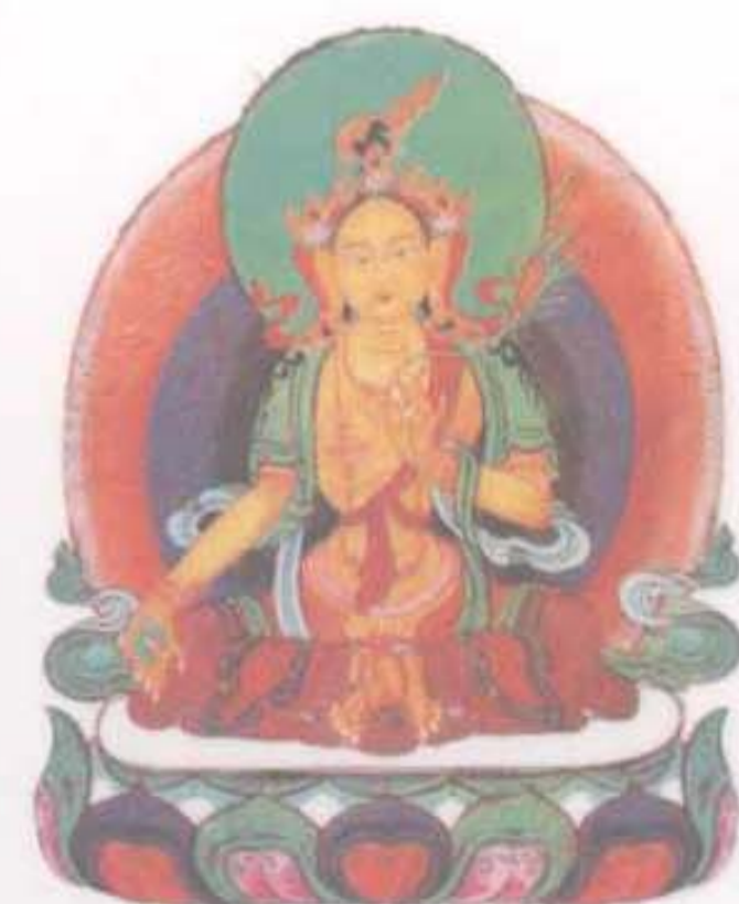
财源天母 为财神佛母，专司世间财富， 为众生带来财宝