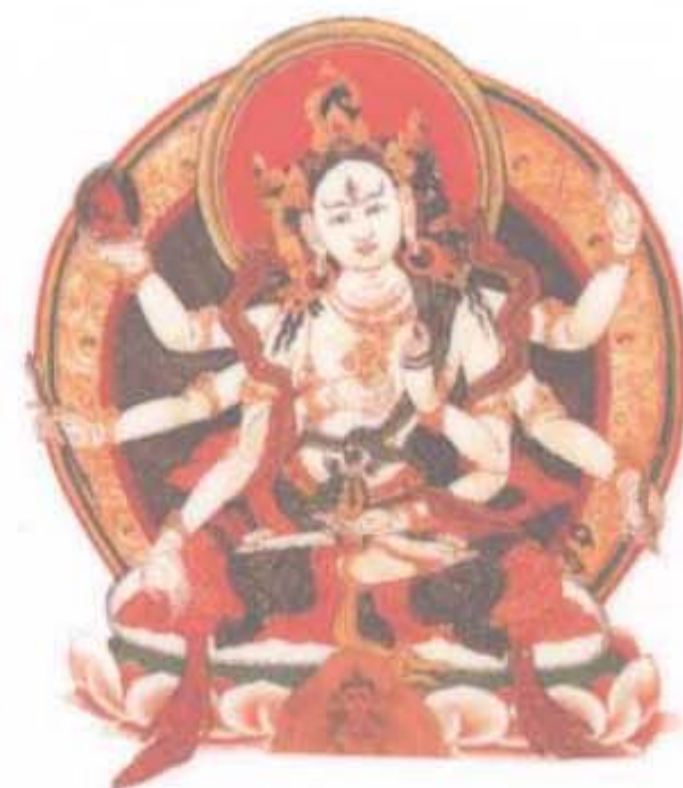
尊胜佛母 能使五谷丰熟， 使众生增长财宝和福德