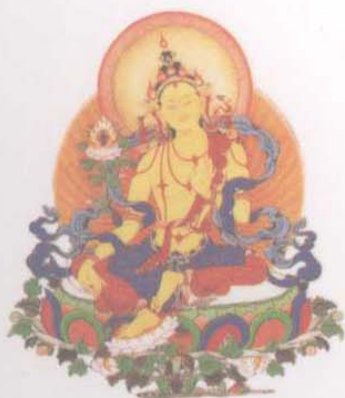
白度母 满足众生一切愿望， 带来丰盛财物