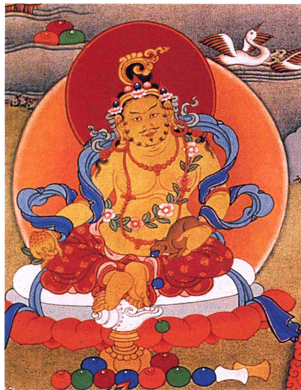
五姓财神之黄财神

吉祥天母，也叫吉祥天或吉祥天女，旧称功德天。她是藏传佛教中极重要的女性护法神。因为吉祥天母象征幸运和财富，所以又被称为财富女神。她主施福德，能满足众生所需的资财，使众生得到快乐。