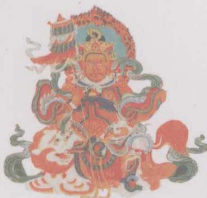
财宝天王毗沙门 护持佛法， 赐予众生无尽资财