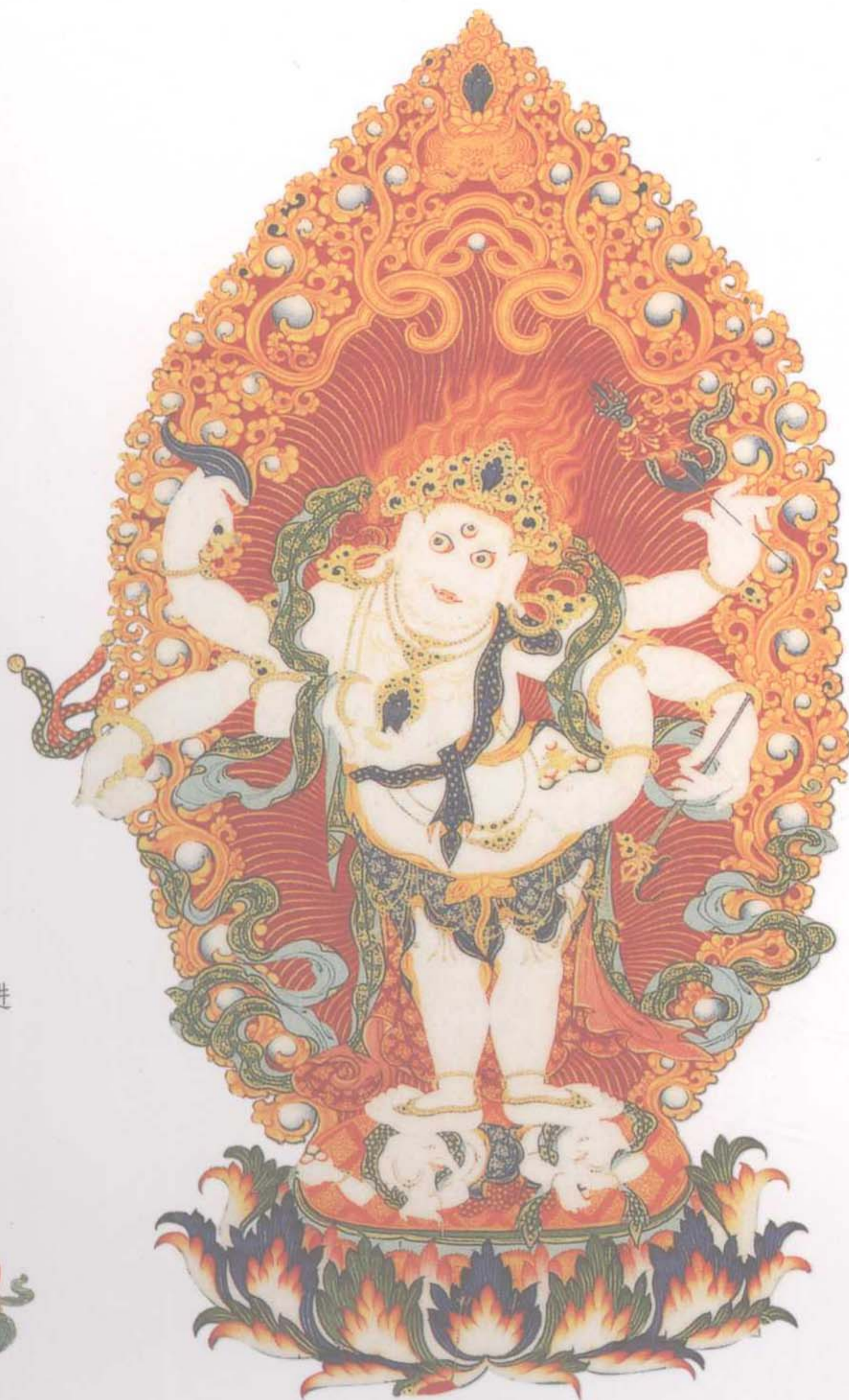
白玛哈嘎拉 最受欢迎的财神护法，能为众生 带来财富且不产生障碍