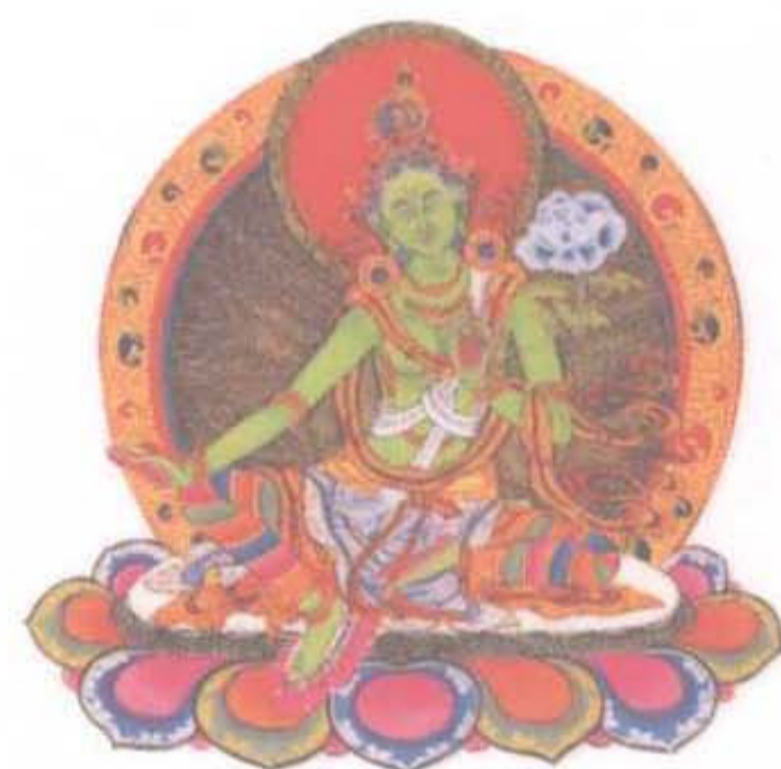
绿度母 能增长福德、成就富贵， 使众生丰财自在