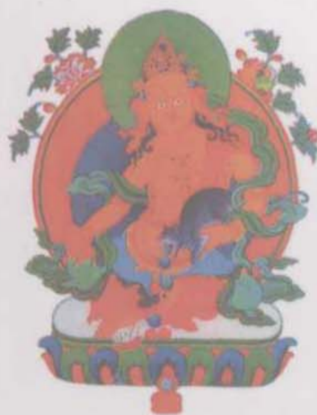
黄财神 五姓财神之首，主司财富， 能使众生脱于贫困，财源广进