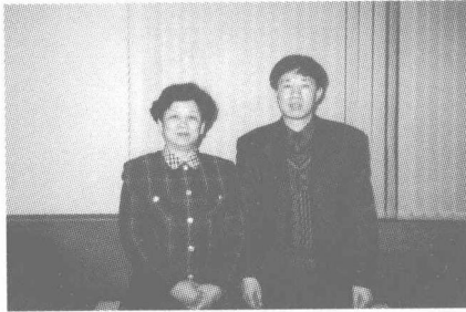
和厦门一中校友、全国人大 副委员长陈至立在一起