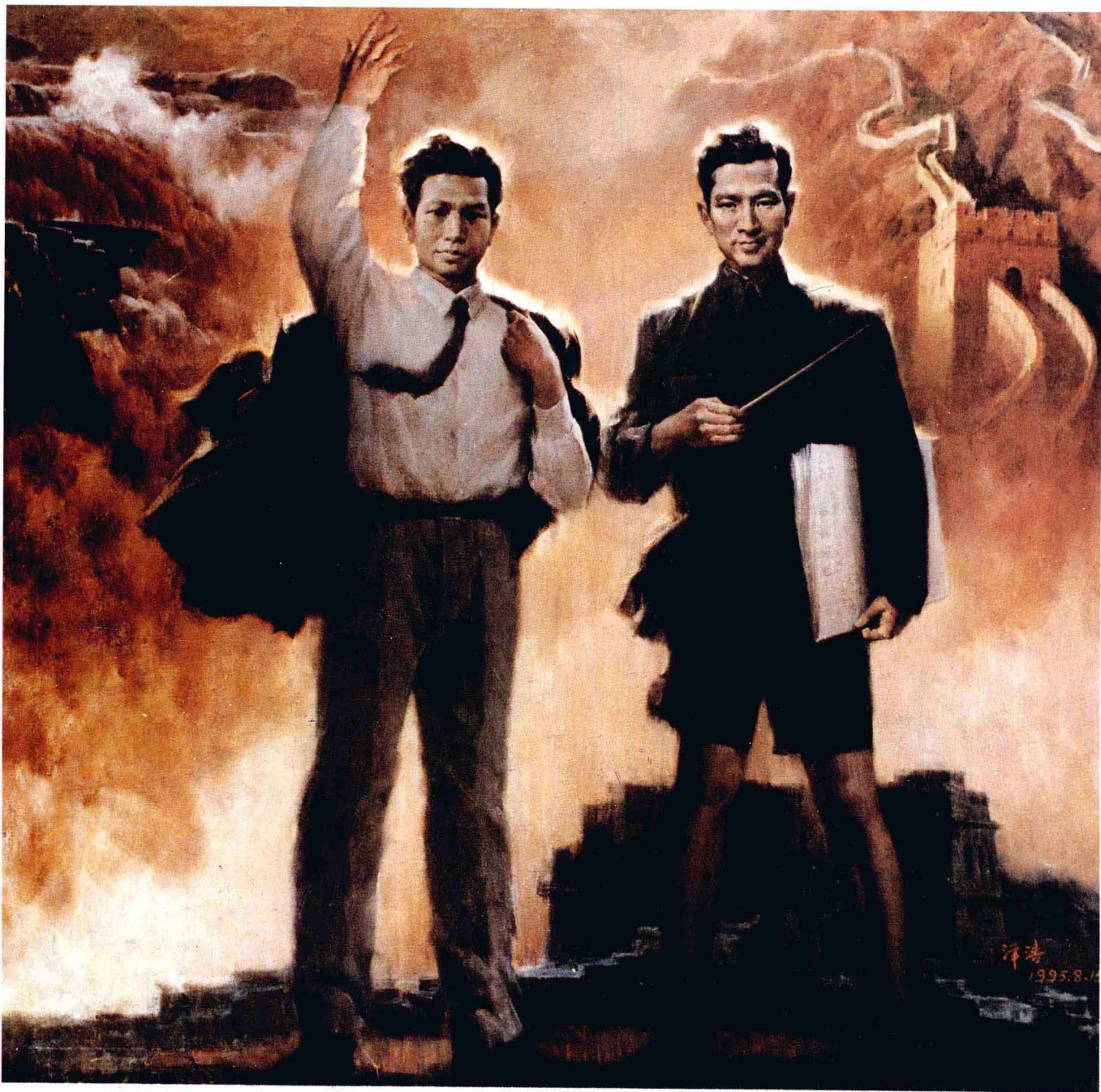
• 民族魂·聂耳·冼星海 油画 李泽浩