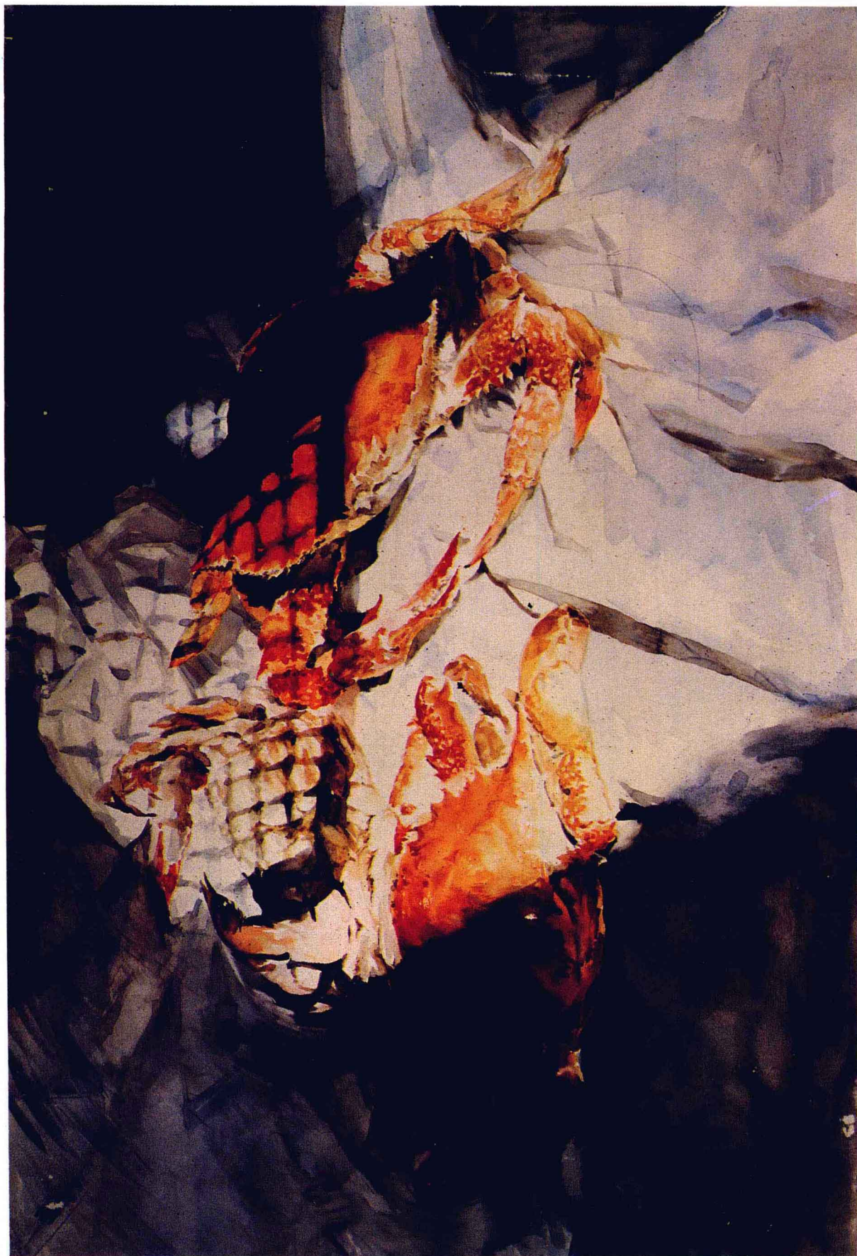
蟹 水彩画 黄亚奇