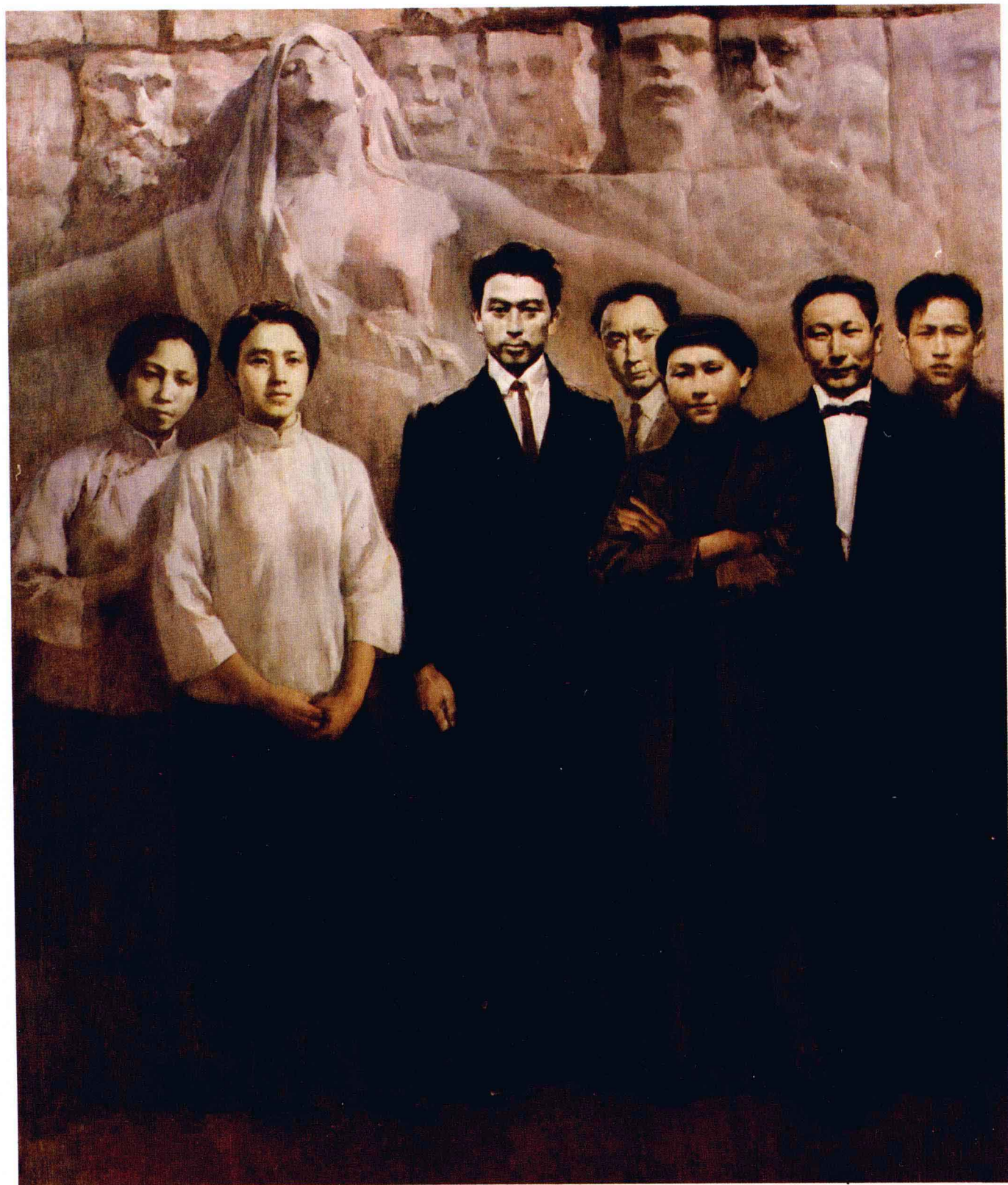
先驱 油画 李泽浩