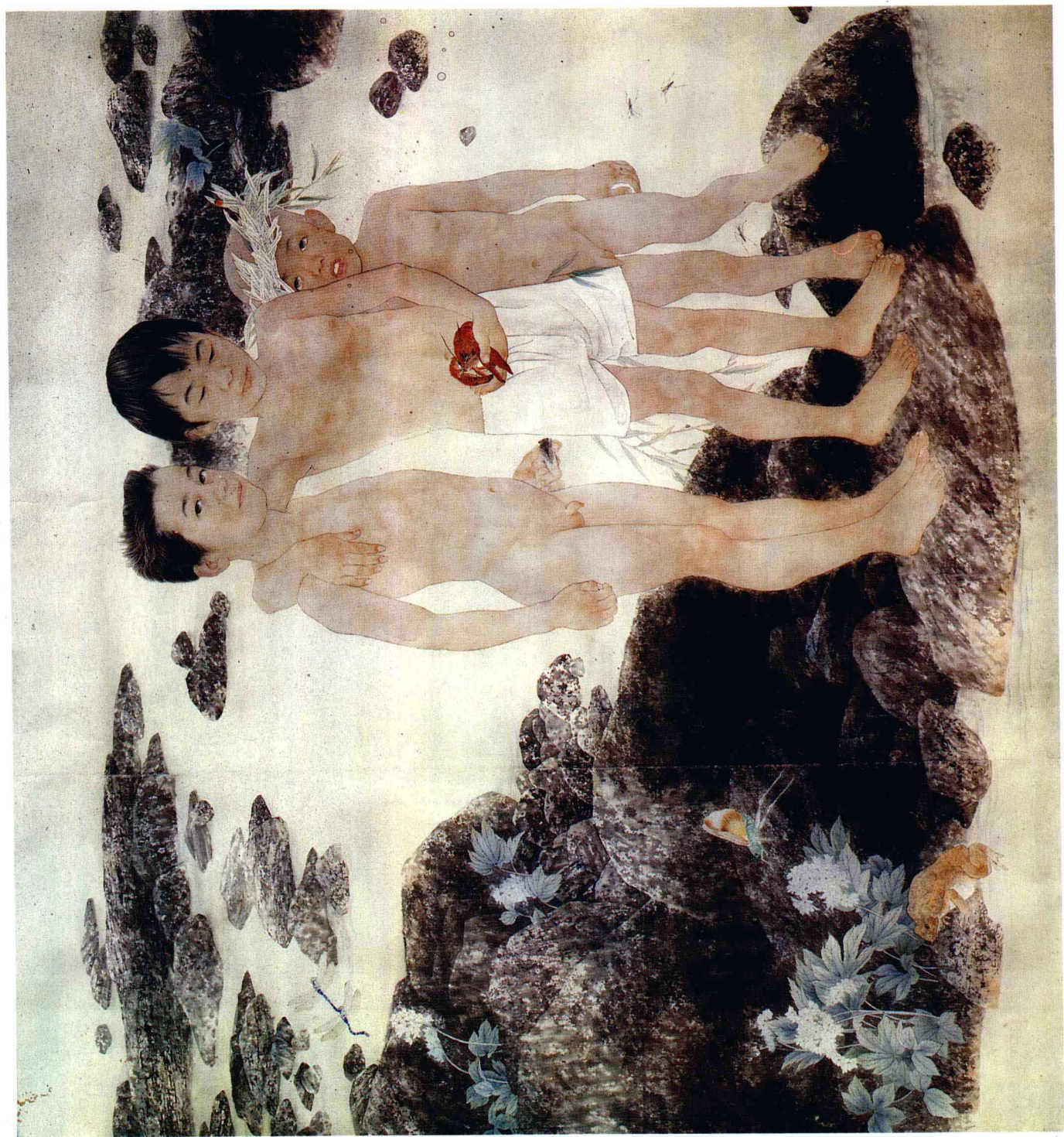
天乐 中国画 齐鸣