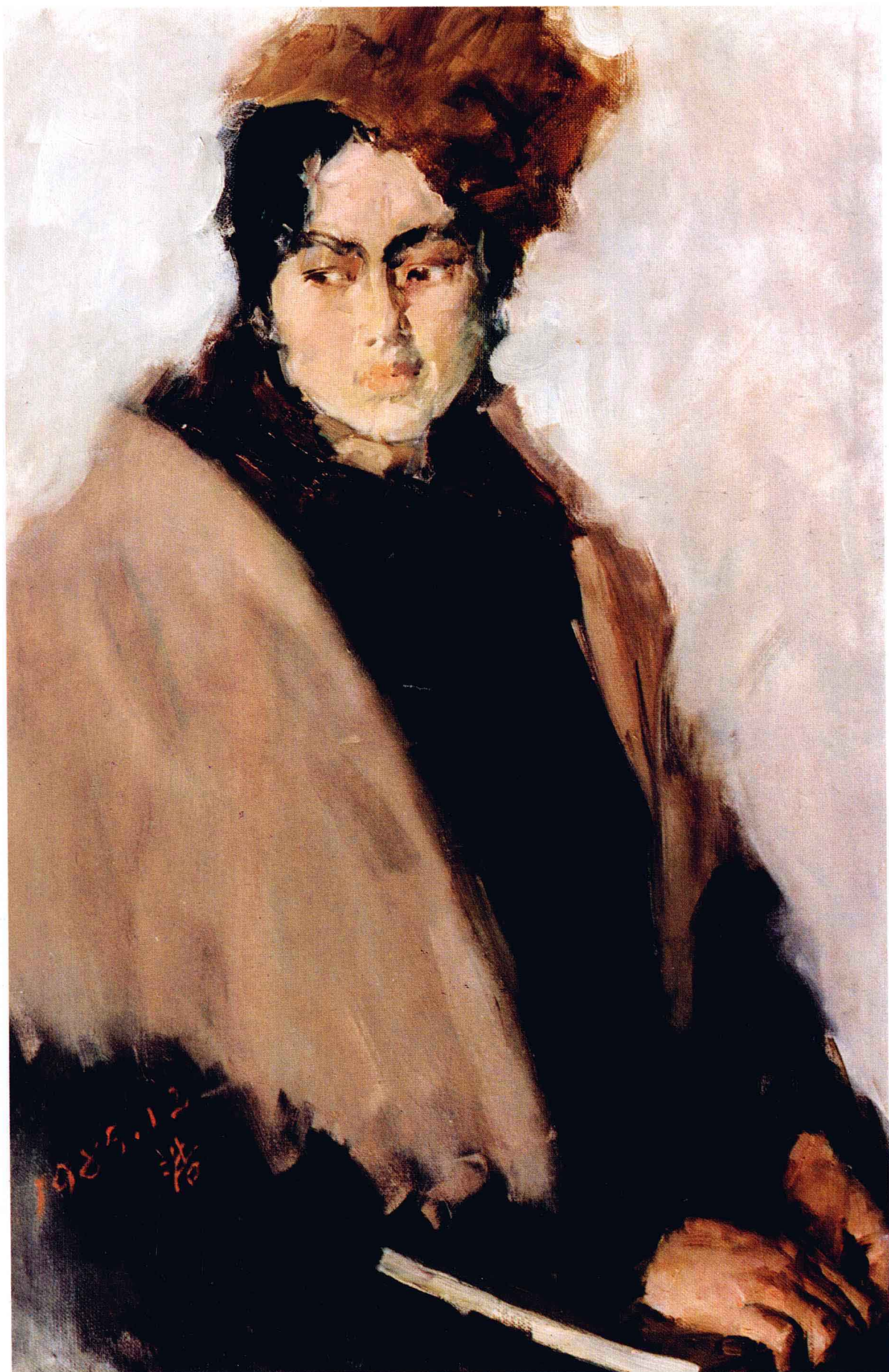
冬妮亚 油画 李泽浩