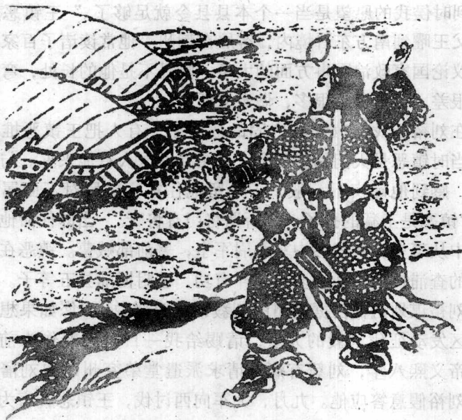
王镇恶 (373—418)，南朝宋将领。

道会被袭击。王镇恶从豫章口舍船步行而上，蒯恩的军队在前面，王镇恶军随后。每只船中留一二人，船对岩上竖立六七面旗帜，下安放一只战鼓。王镇恶对留下的人说：“你们估计我将到城下时，便大擂军鼓，好像后面还有大军的样子。”又分出一部分部队在后面，命他们烧掉江边渡口的战船。王镇恶径直往前攻袭江陵城，对前面的军队说：“如果有问话，只说是刘兖州来到。”沿岸戍所及百姓都说是刘藩到来，安定而没有怀疑。