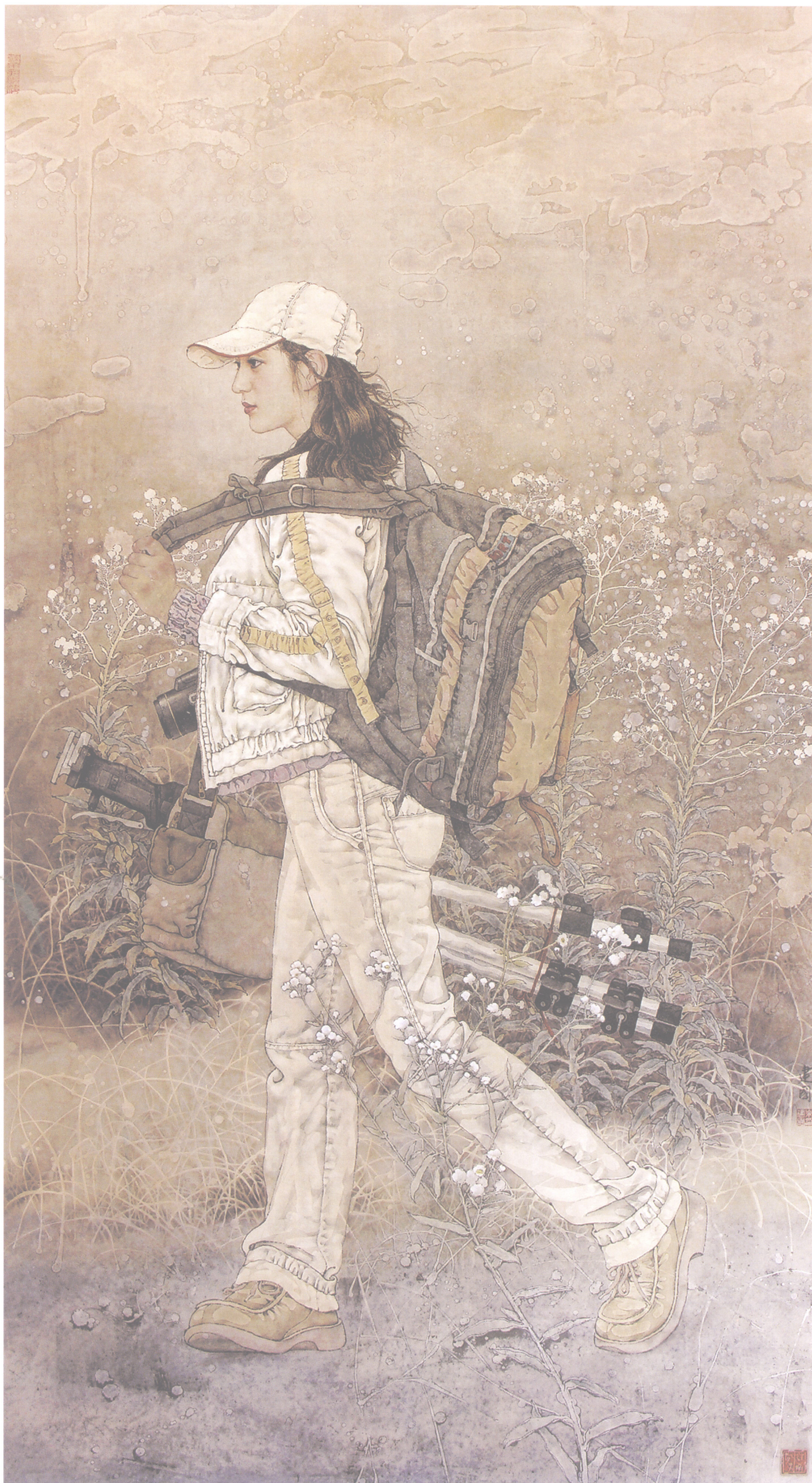
桑建国 风行 172cm × 96cm 2005年