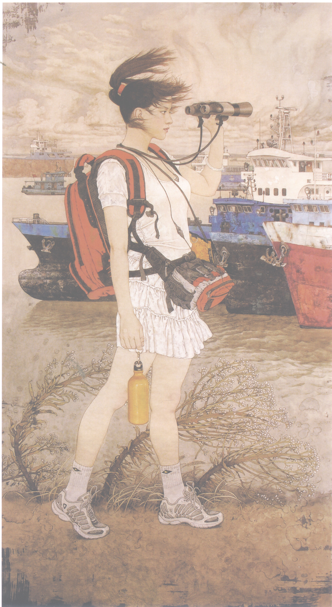
桑建国 远望 172cm × 96cm 2006年