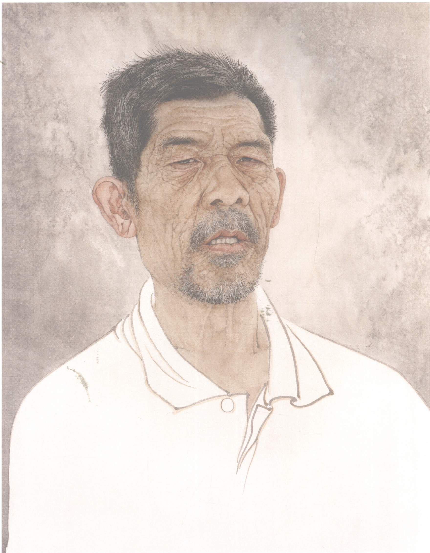
何家英 | 沧桑 54cm × 42cm 1989年