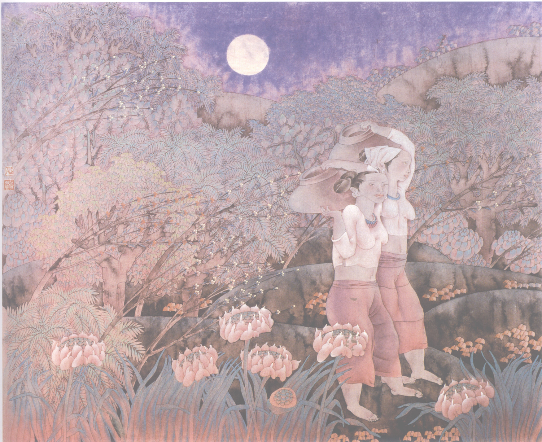
陈孟昕 | 汲水源上 73cm × 87cm 1994年