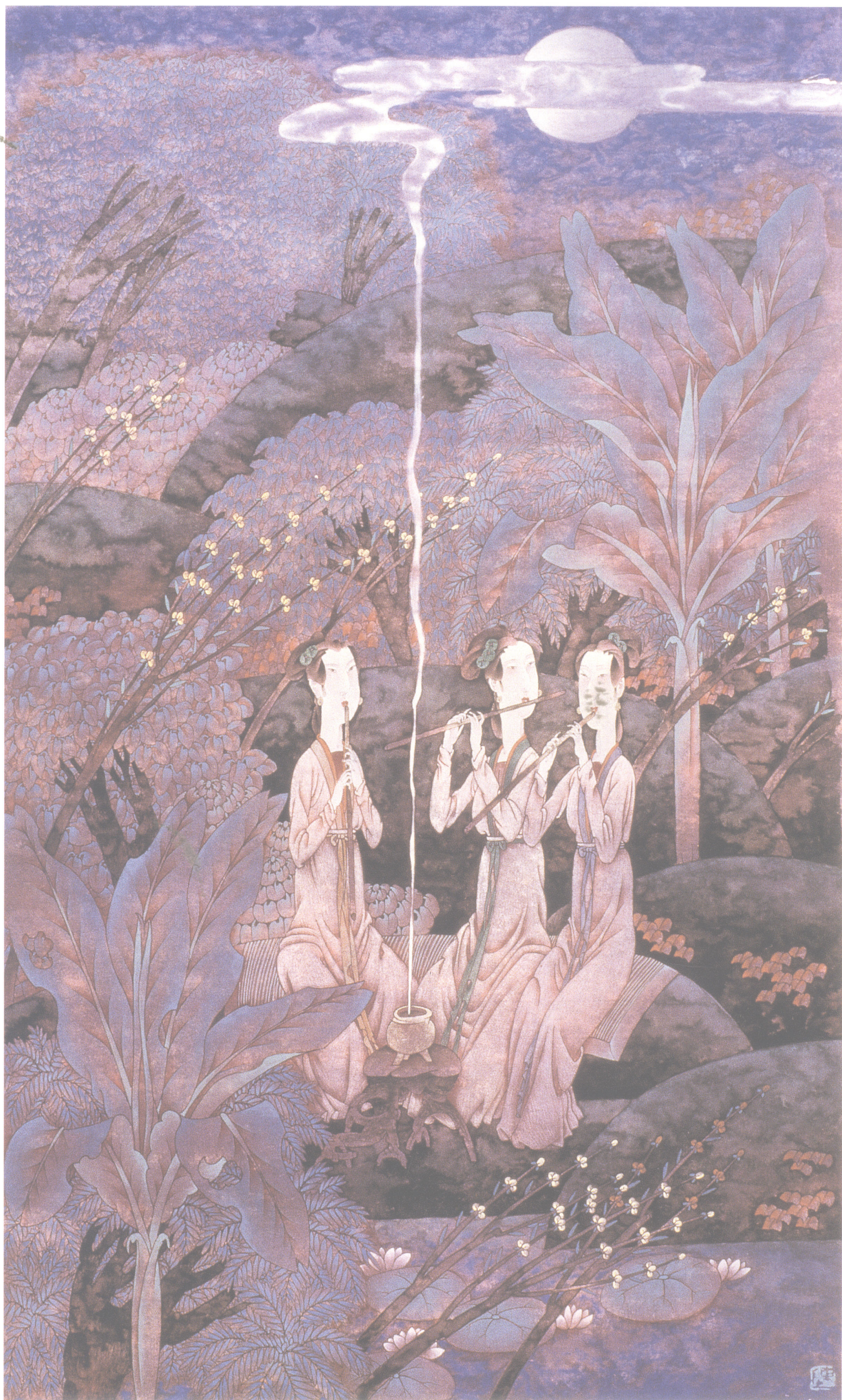
陈孟昕 丝竹晚唱 105cm × 73cm 1997年