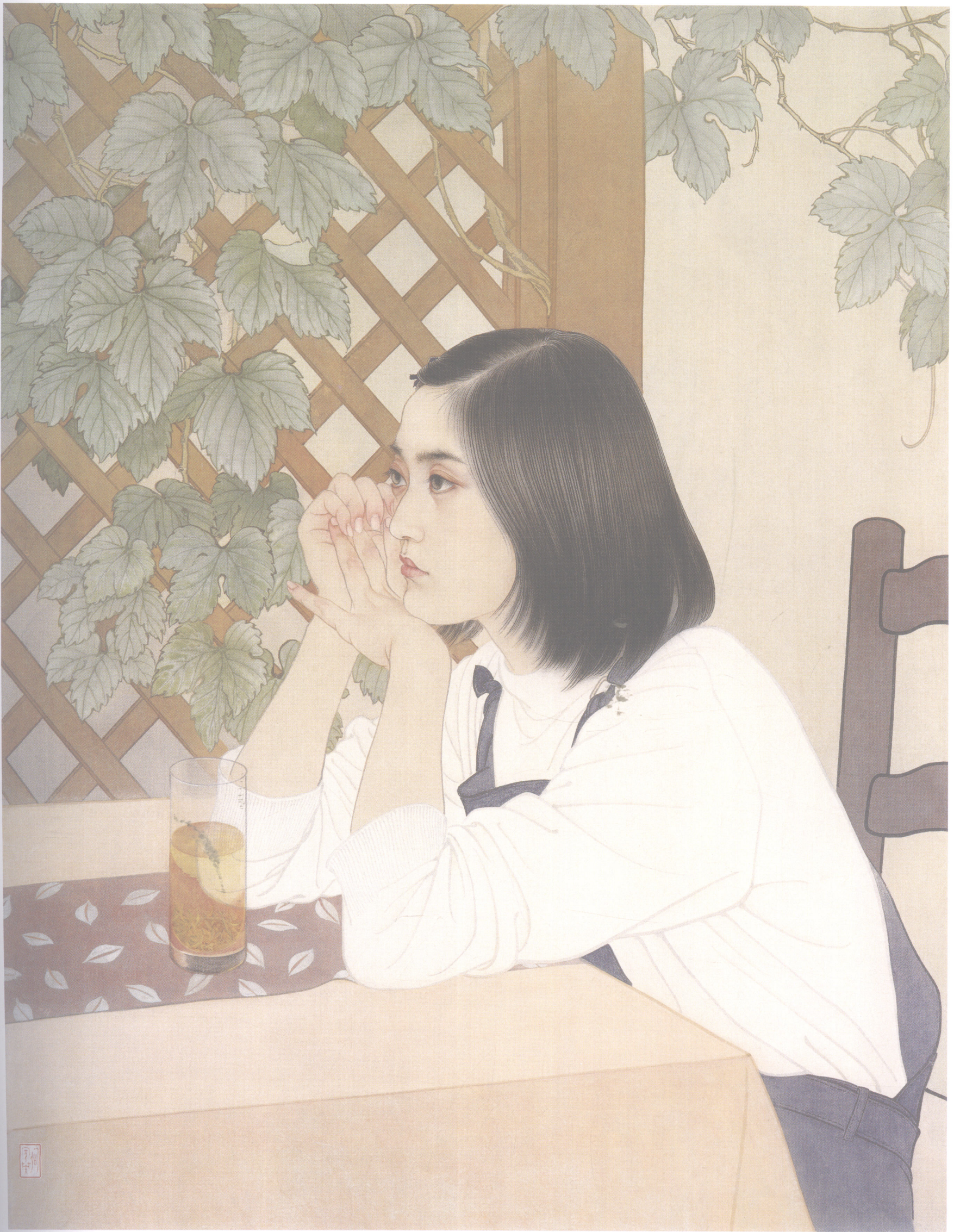
何家英 | 心语 96cm × 73cm 2002年