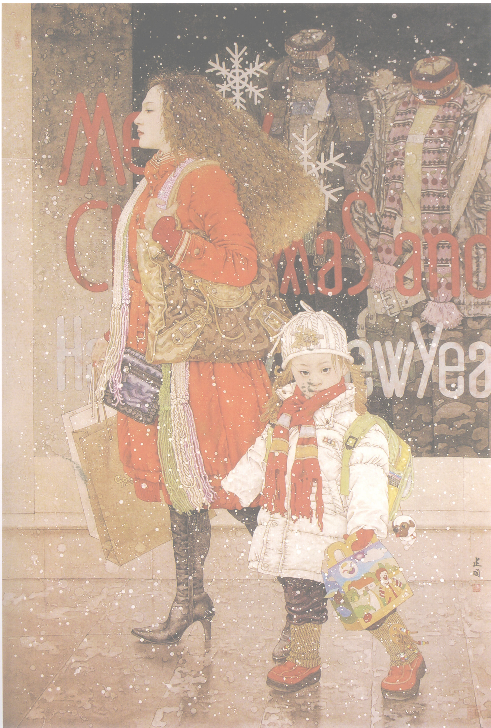
桑建国 | 少妇 185cm × 126cm 2006年