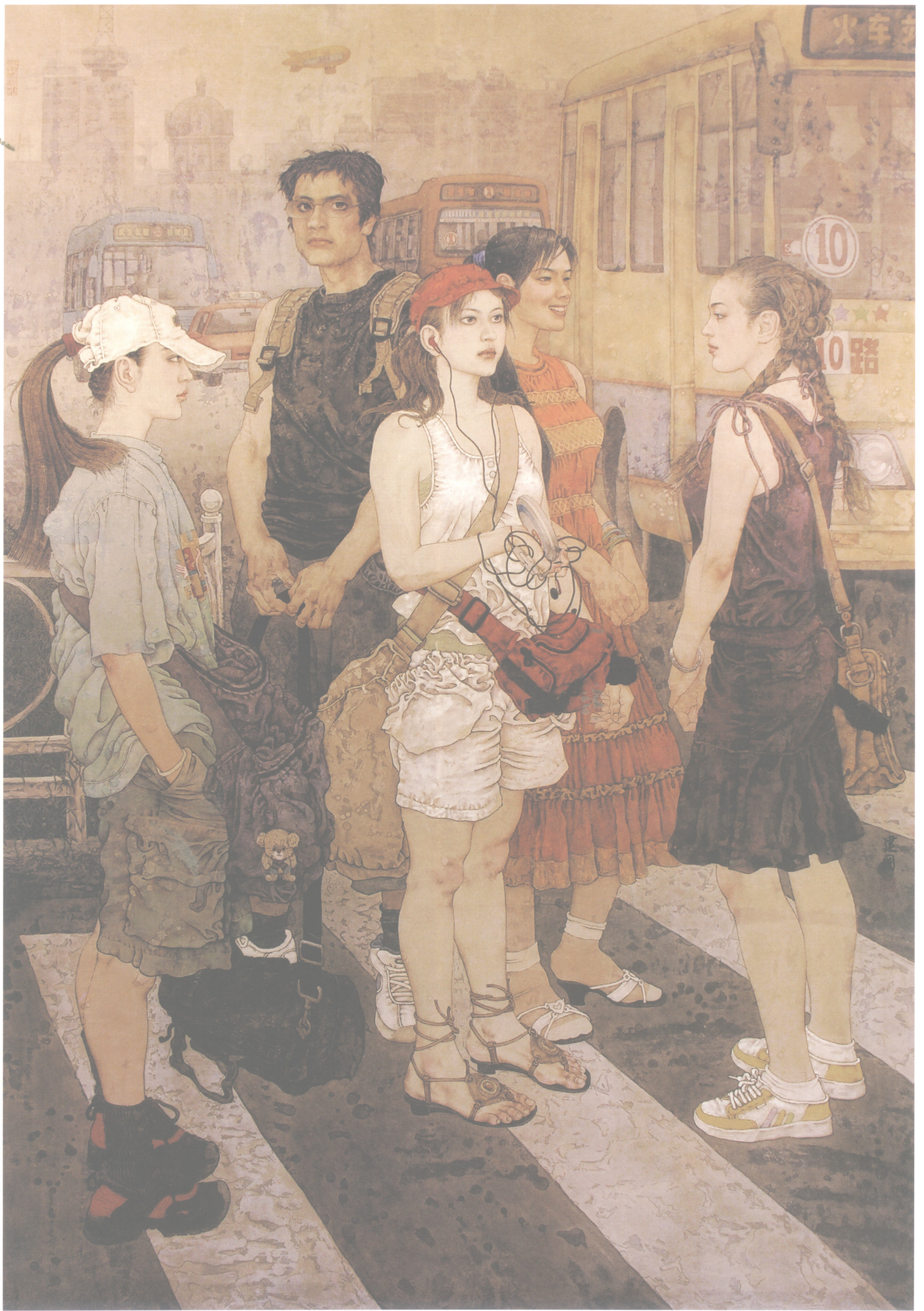
桑建国 | 我们到哪里去 185cm × 126cm 2005年