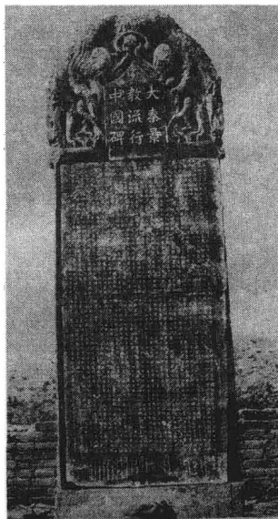
图1 大秦景教流行中国碑

脱里(Nestorius,约380-451,又译聂斯脱利、聂斯托尔、内斯多略)原系安提阿(Antiochia,今土耳其安塔基亚,Antakya)近郊隐修院修士,后出任君士坦丁堡(Constantinople)大主教。聂思脱里教派反对一位论,主张二性二位说,否认基督的神性与人性结合为一本体,认为是神性本体附在人性本体上。聂思脱里教派在431年以弗所(Ephesus)公会议上被判为“异端”,聂思脱里本人也遭革职流放。但仍有许多信徒追随其后,逐渐形成聂思脱里派。聂思脱里派在叙利亚、美索不达米亚、波斯、伊拉克等地较有影响。聂思脱里教派形成后,逐渐向东传播。约5-6世纪从波斯传入今中亚、新疆等地,7世纪时传入内地,“大秦景教流行中国碑”碑文所记即为此时之事。