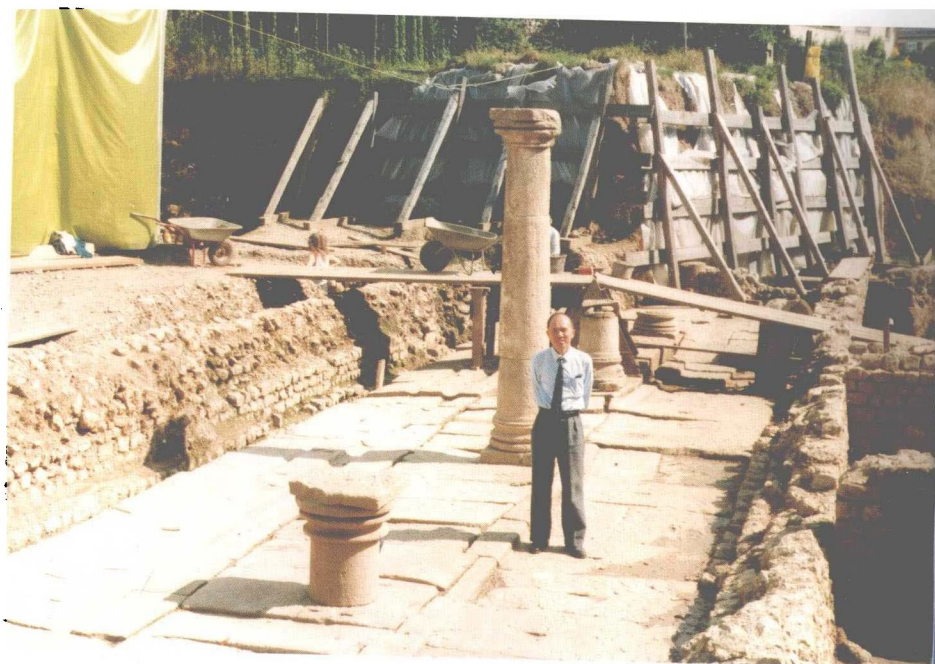
作者考察古罗马公共温泉浴室遗址