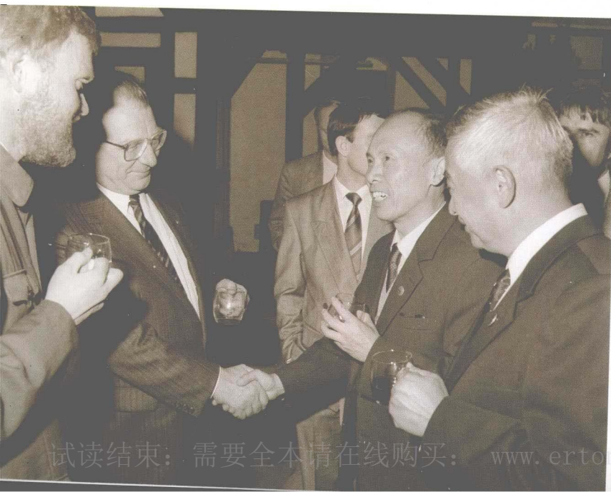
作者访德期间与国外友人交谈