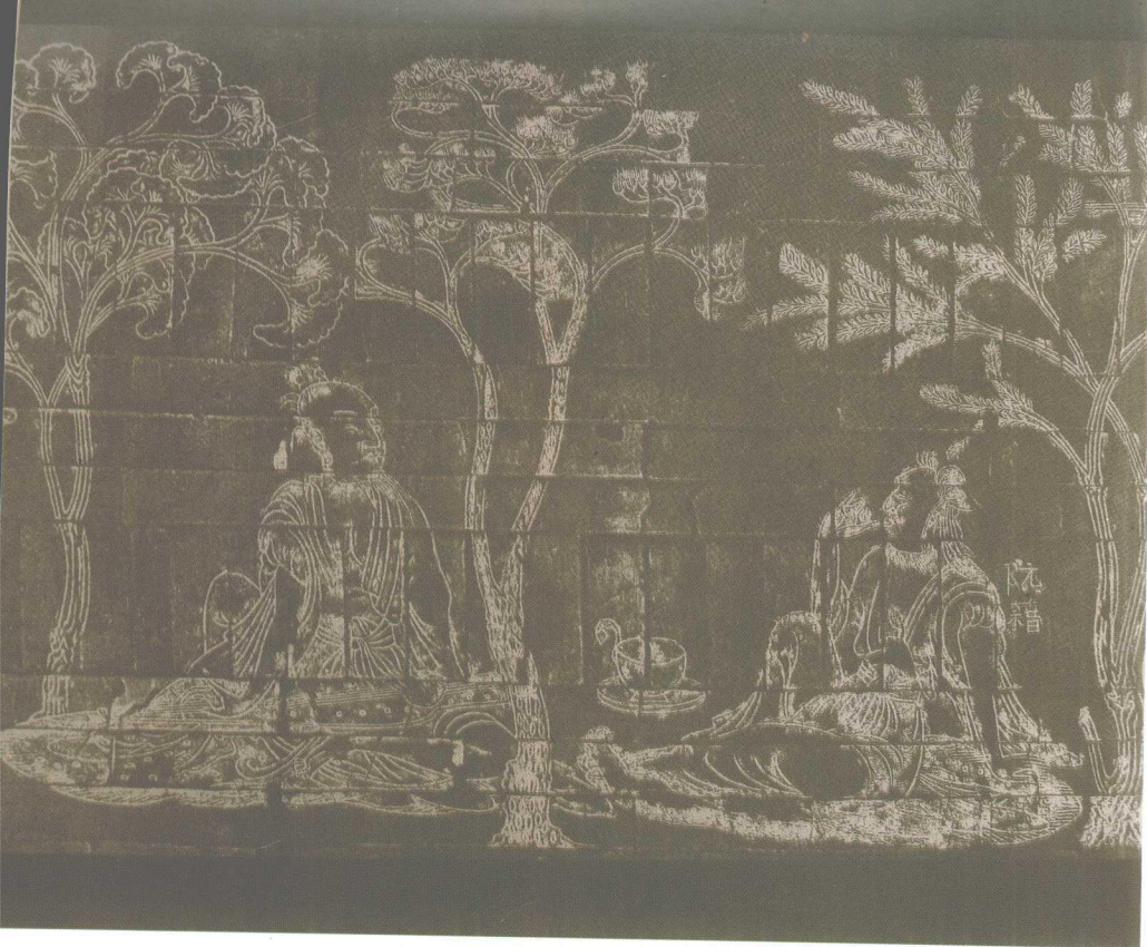
竹林七贤砖刻壁画