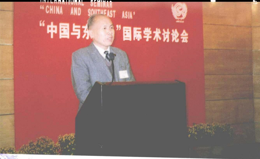
作者在学术会议上作报告