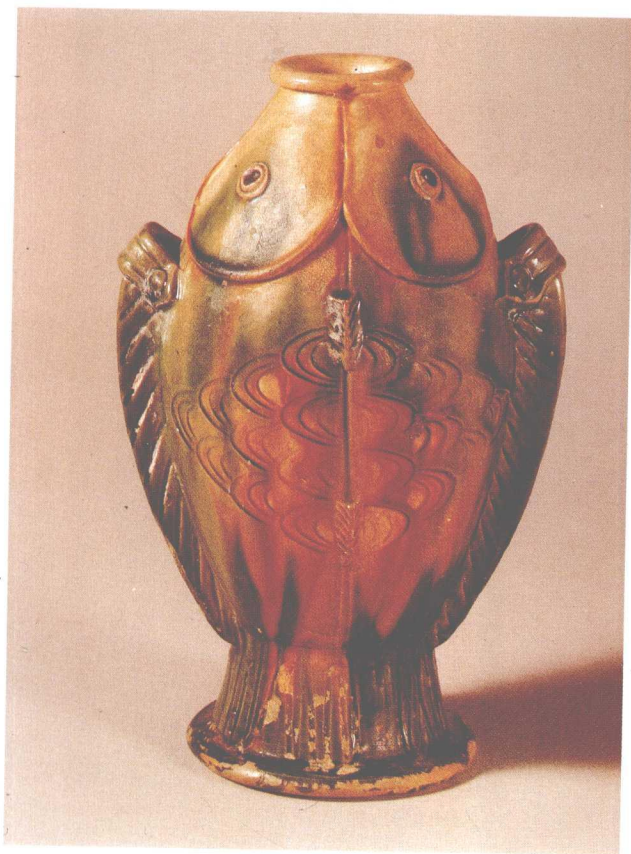
扬州唐城出土三彩鱼壶