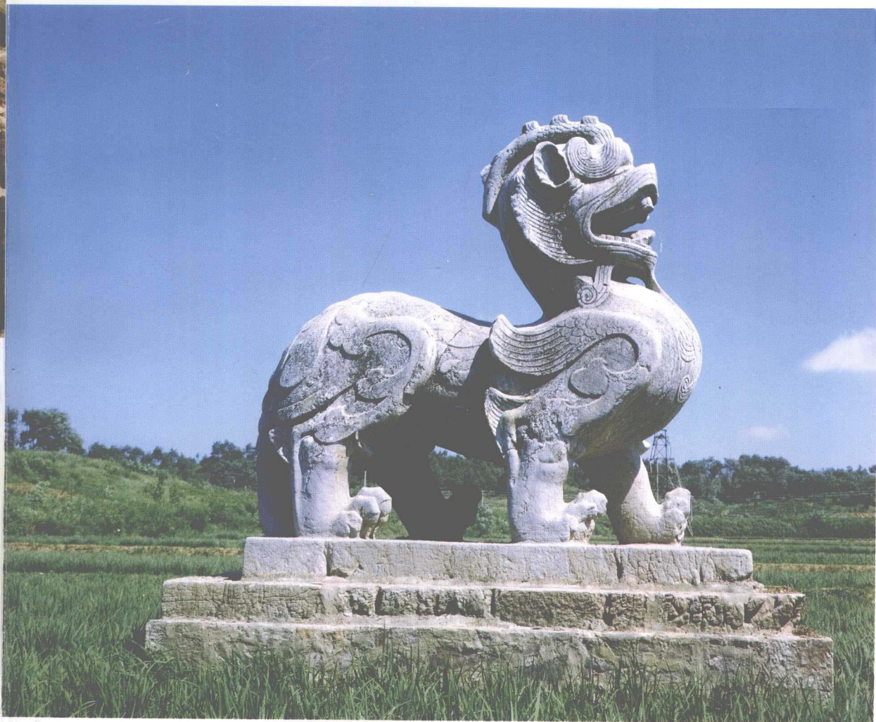
六朝陵墓神道石刻