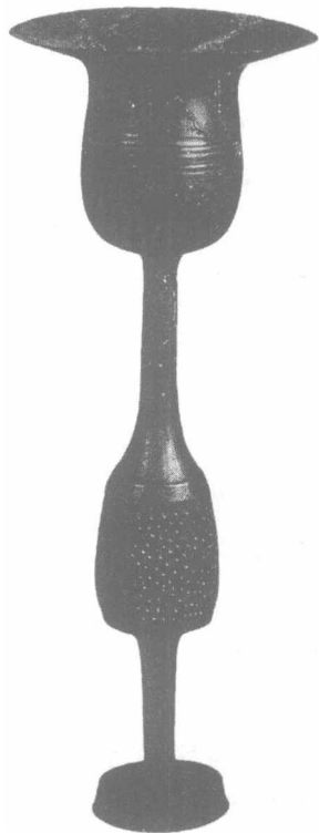
新石器时代的黑陶

中国美学的真正起点是老子。老子提出和阐发的一系列概念，如“道”、“气”、“象”、“有”、“无”、“虚”、“实”、“味”、“妙”、“虚静”、“玄鉴”、“自然”等等，对于中国古典美学形成自己的体系和特点，产生了极为重大的影响。老子开创了道家美学的传统。中国古典美学的元气论，中国古典美学的意象说，中国古典美学的意境说，中国古典美学关于审美心胸的理论，等等，都发源于老子的哲学和美学。