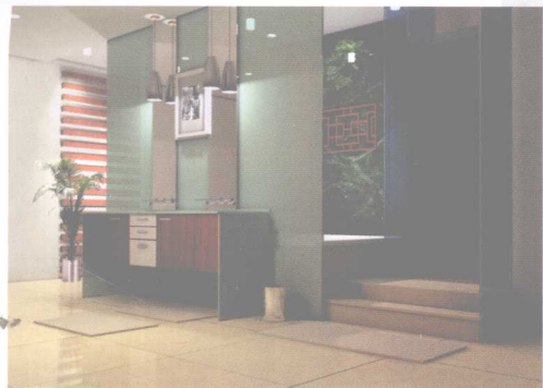
此图的表现手法利用了中西方文化的融合，墙面镶嵌传统装饰纹样，具有独特的传统风格。 /孟广宇