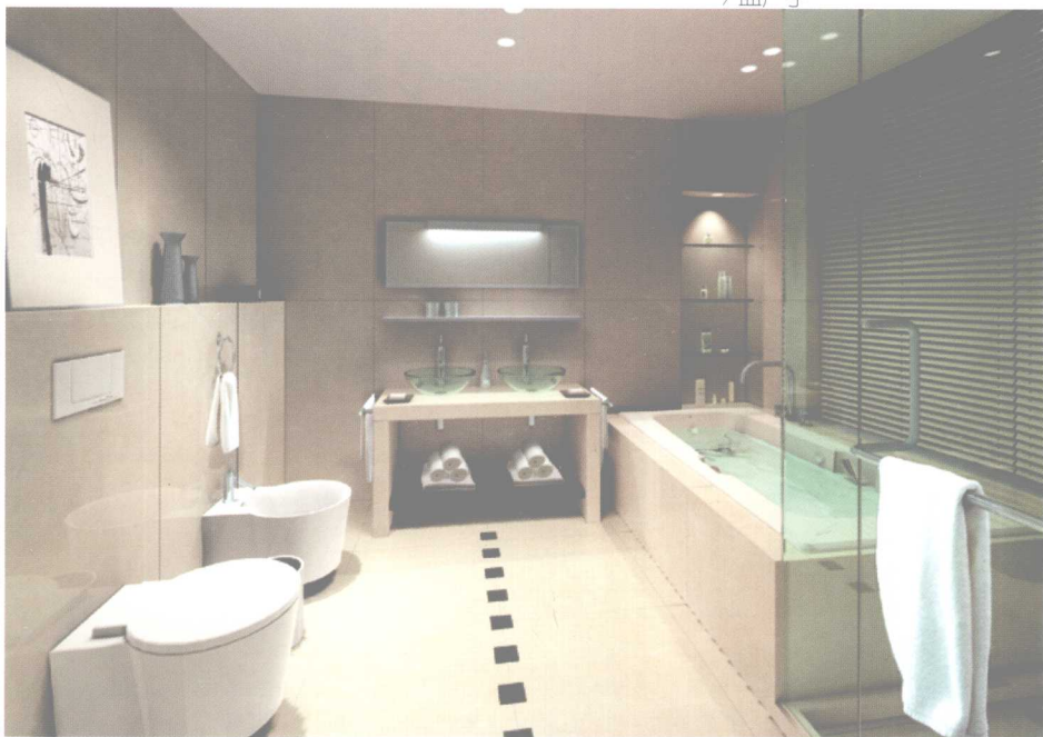
此设计以绿灰为主色调，点、线、面的合理搭配具有强烈的视觉冲击力。整个空间既简洁又富有变化。暖色调给人以古典、变化丰富的感受。