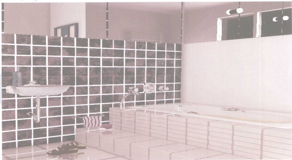
直线与方格的造型,次序与节奏感较强,表现一种力度与速度的特征。