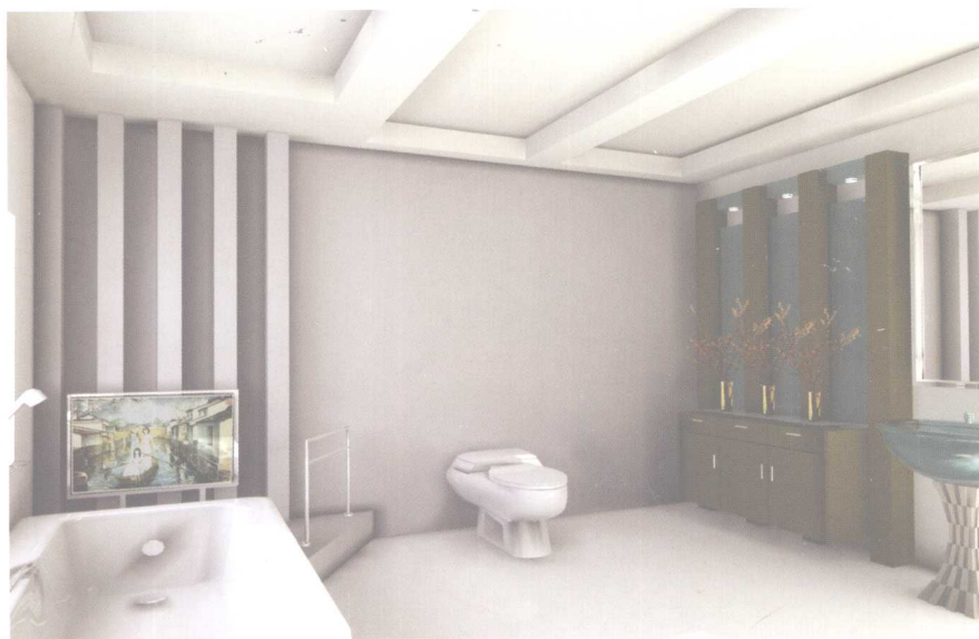
直线分割空间,天棚与直线形成呼应,有高耸的空间感。