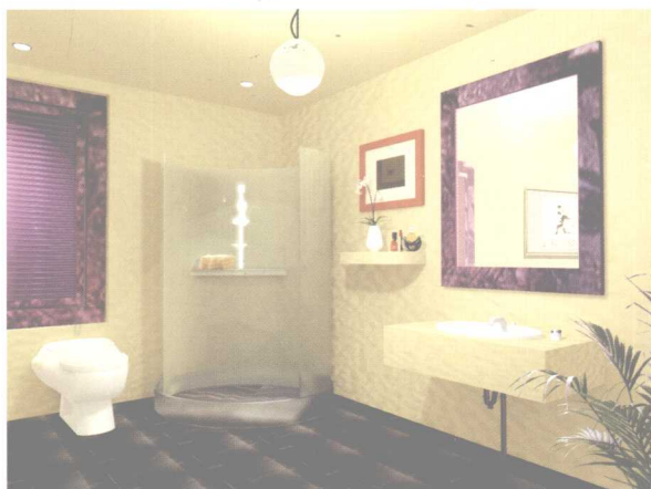
整体采用黄色调,配以紫色的窗框,对比色的运用给人以活泼生动的感觉。