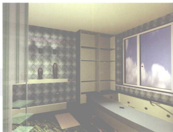
用曲线分割空间,既活跃空间气氛,又增加主题的表现力。