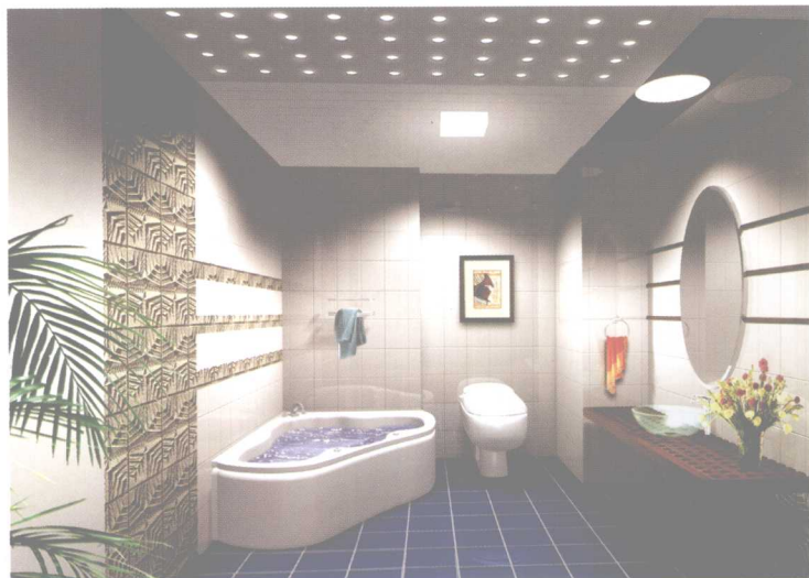
采用角式浴盆,流畅的曲线分割,凸凹的壁砖活跃了浴室气氛。