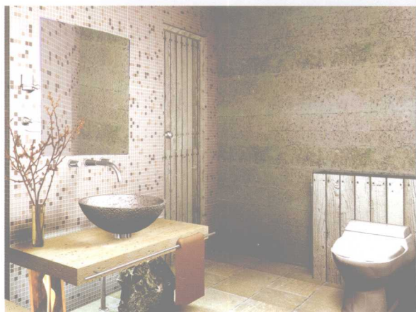
追求古朴的风格，体现了文化韵味和设计主题，表现了较强的个人品味。 / 王彦鹏