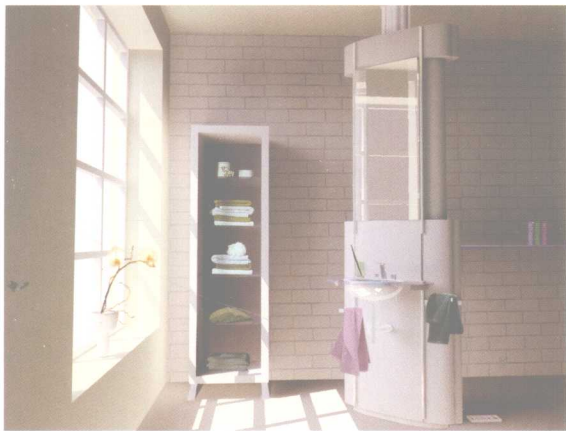
以浴室器具为主的设计，省略了装饰物，强调功能的作用。 / 王彦鹏