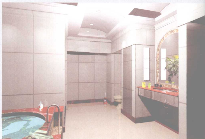
清晰的色调、和谐的灯光、深红色的台面和角线的运用，更具设计美感。 /王长明