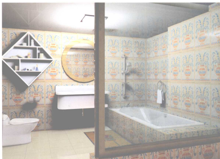
强调材质的相互映射,独特的瓷砖纹样,有田园风格的卫浴设计。