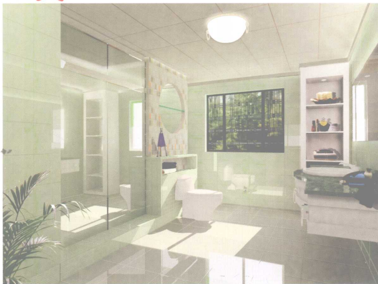
卫生间采用绿色调,与户外绿色相呼应,使人感到清新自然。