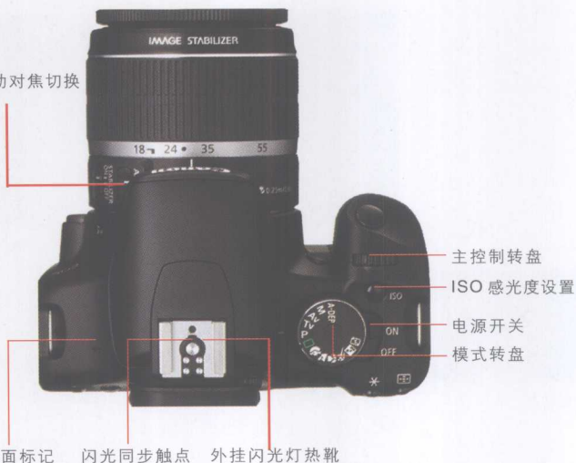
相机顶部各控件名称和功能