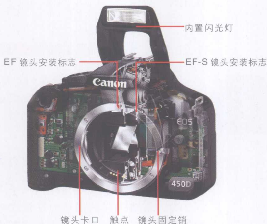
镜头卡口及内置闪光灯