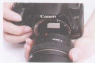
将机身与标志对齐

安装数码相机专用 EF-S 镜头时的安装位置标志。为区别于 EF 镜头安装标志，显示为白色方形。