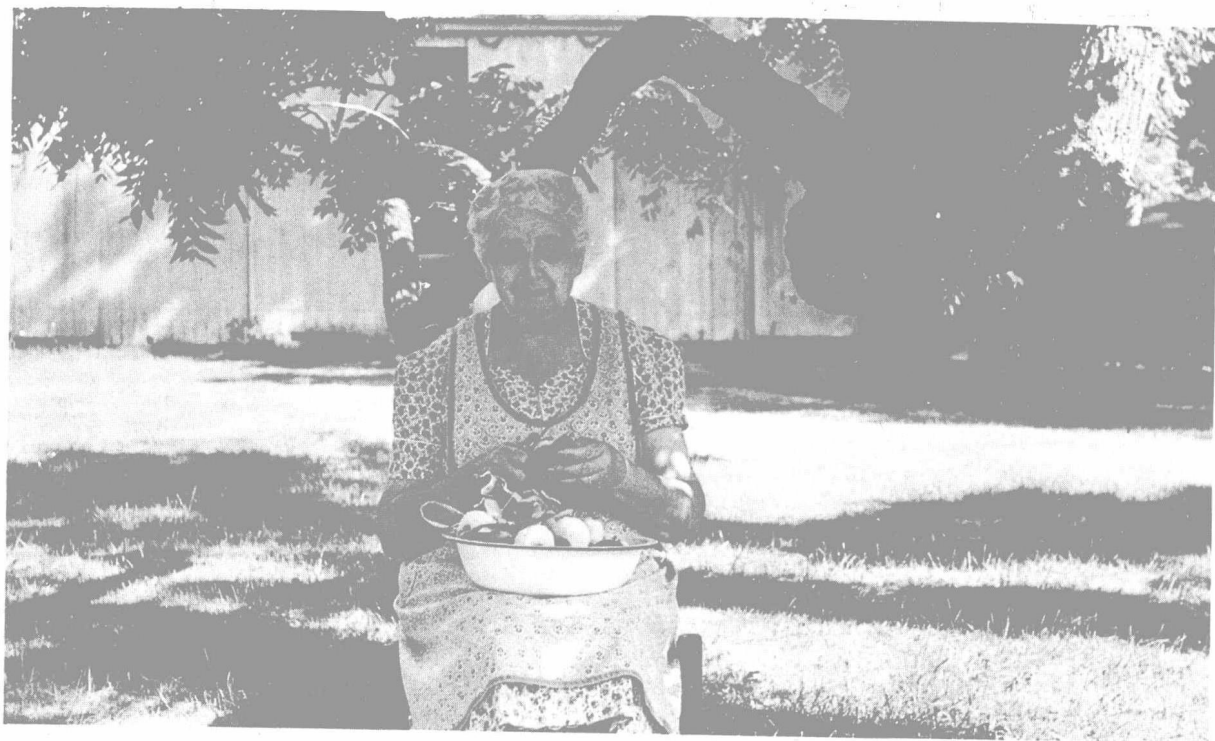
图 1·1