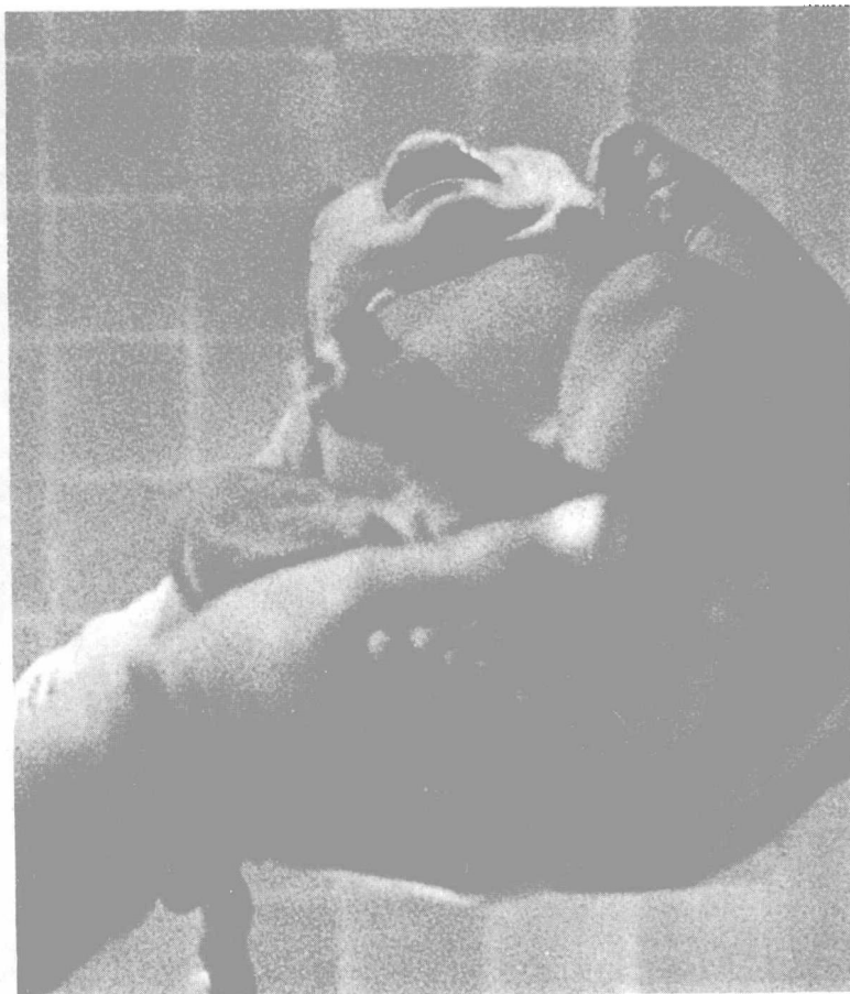
图 1·3