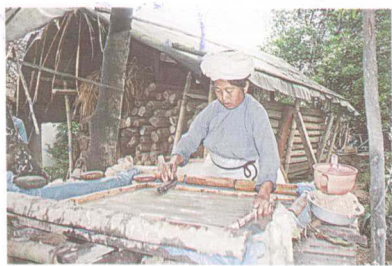
孟定傣族的原始造纸