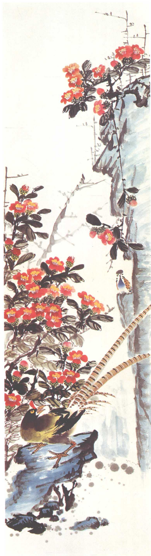
《百花齐放·锦鸡山楂旁》