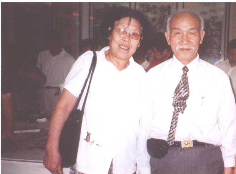
作者与台湾著名书法家 曾熙先生合影