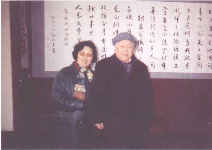
作者与著名书法家 孙轶青先生合影