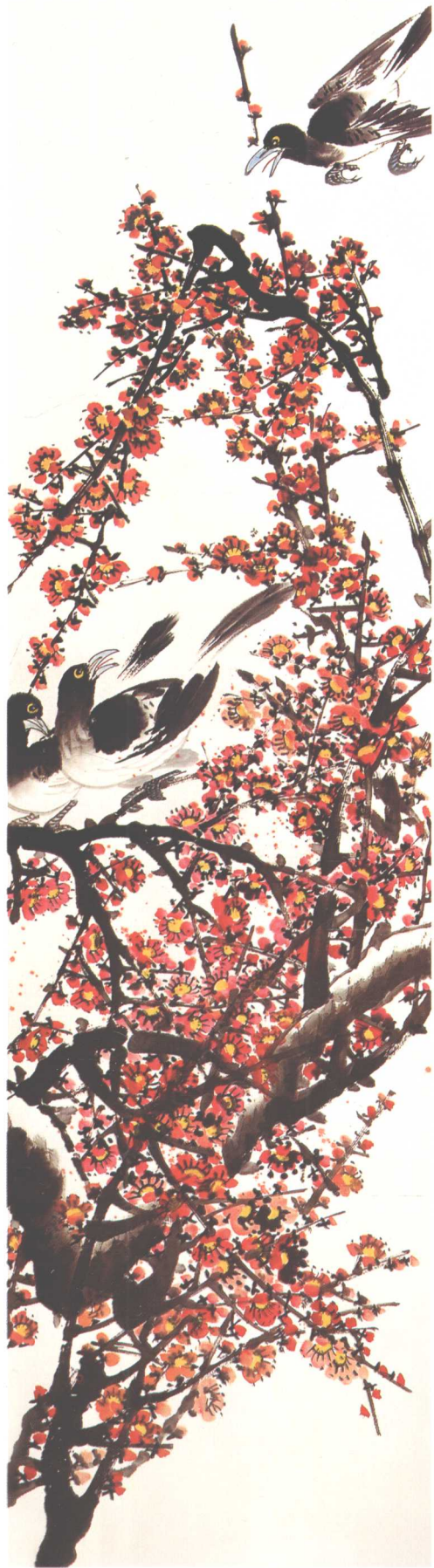
《百花齐放·喜鹊梅端叫》 200cm x 50cm

百花齊放百家爭鳴。是二五六年。毛主席提出的。這二十一年。來自百方針的正確指引。下。我國的社會主義文化。藝術。和科學。