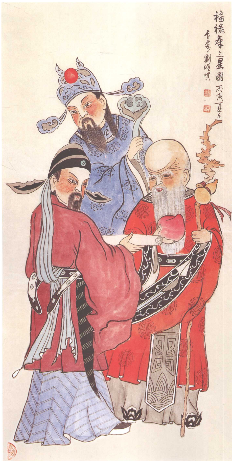
《福祿壽三星圖》 140cm x 70cm