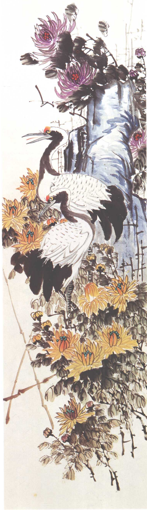
《百花齐放·白鹤黄花边》 200cm x 50cm