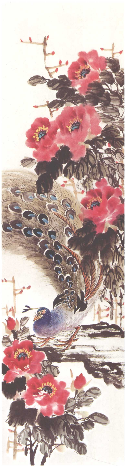
《百花齐放·孔雀戏牡丹》 200cm x 50cm