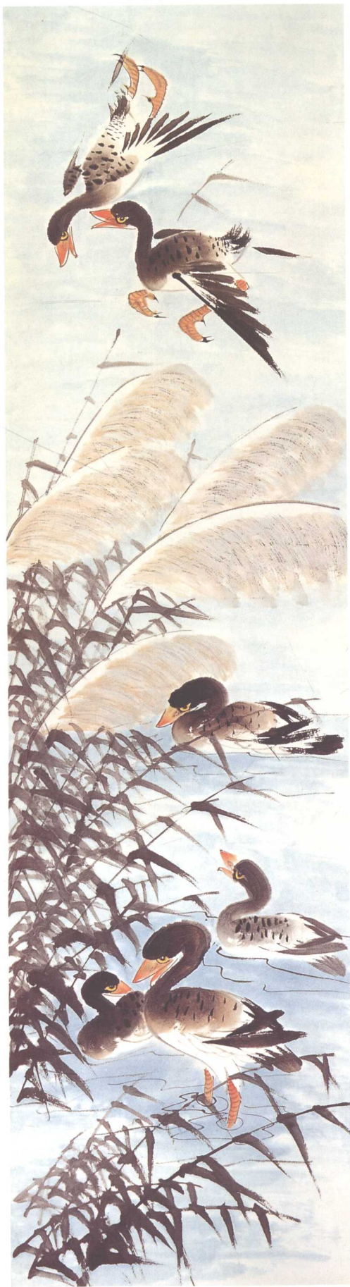
《百花齐放·苇丛宿芦雁》