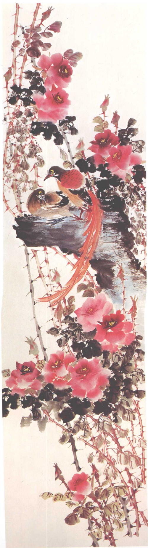
《百花齐放·月季隐绶带》 200cm x 50cm