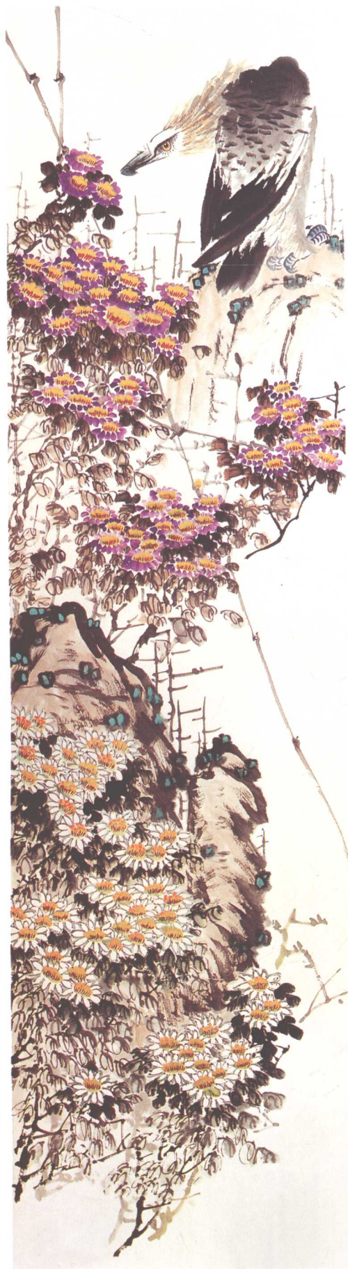
《百花齐放·鹰睨山菊美》 200cm x 50cm