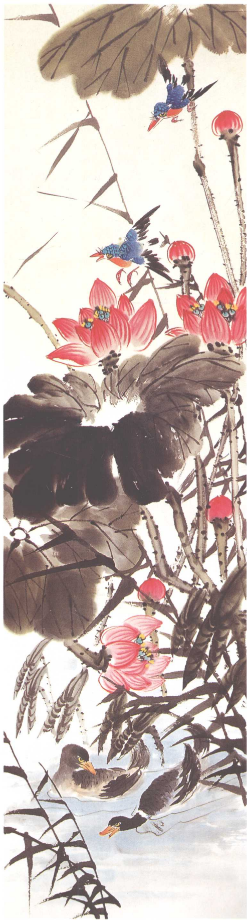
《百花齐放·翠鸟荷间舞》 200cm x 50cm