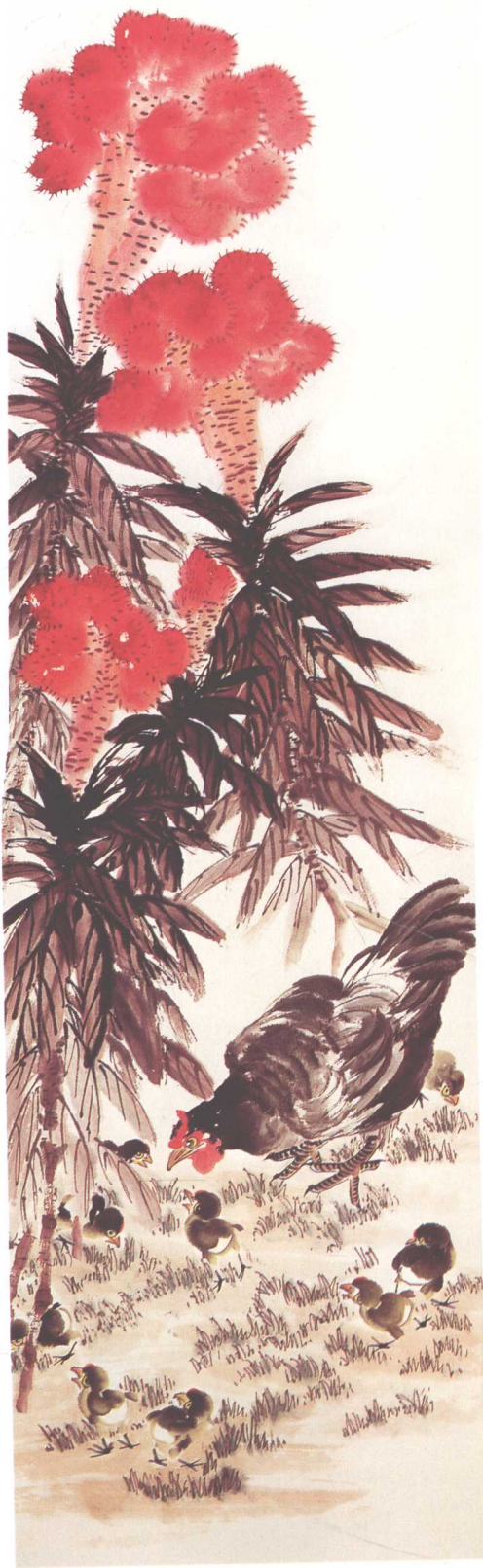
《百花齐放·幼稚偎鸡冠》 200cm x 50cm