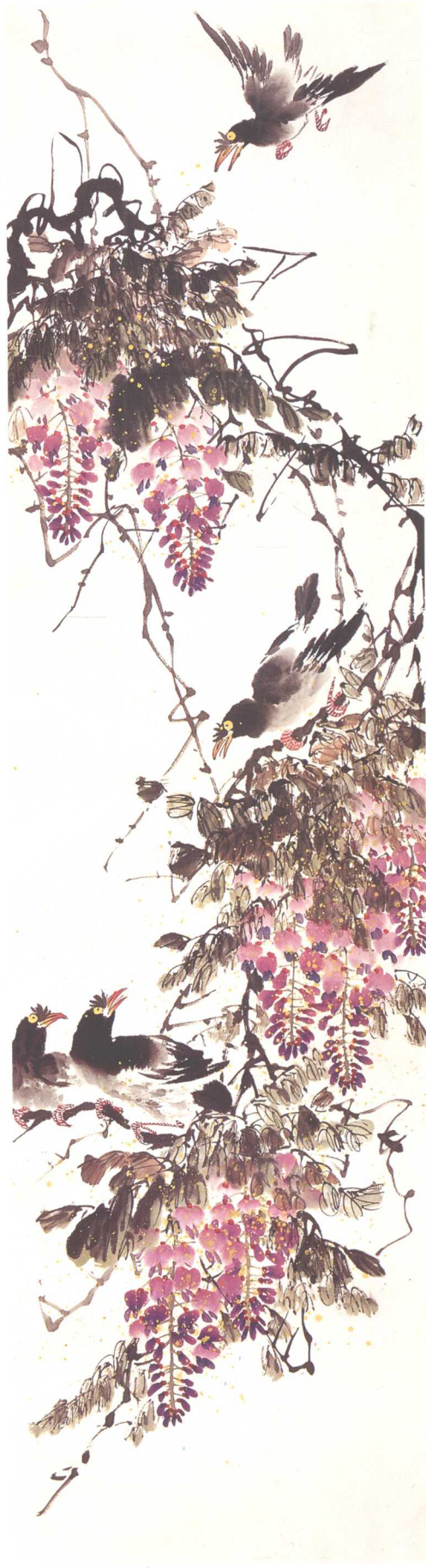
《百花齐放·八哥紫藤言》