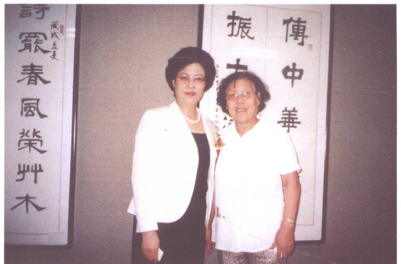
作者与中国政协委员、中国民主建国会 副主任委员于小文女士合影