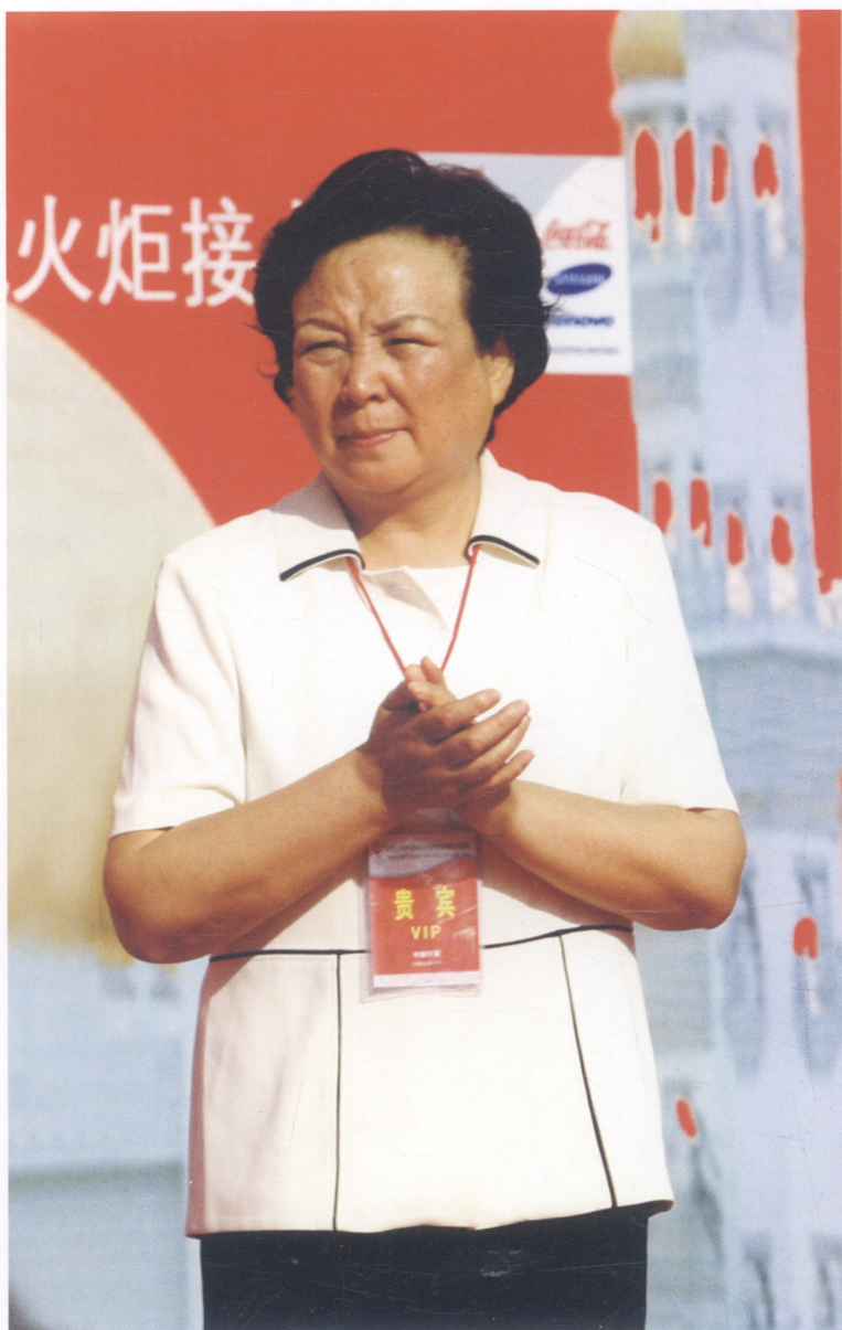
宁夏回族自治区人大常委会副主任马秀芬出席银川市点火仪式