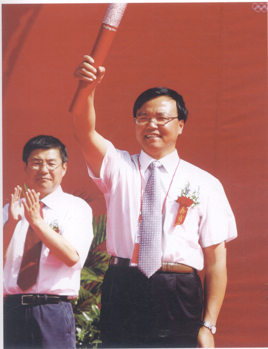
宁夏回族自治区副主席李堂堂在中卫市收火仪式上展示火炬