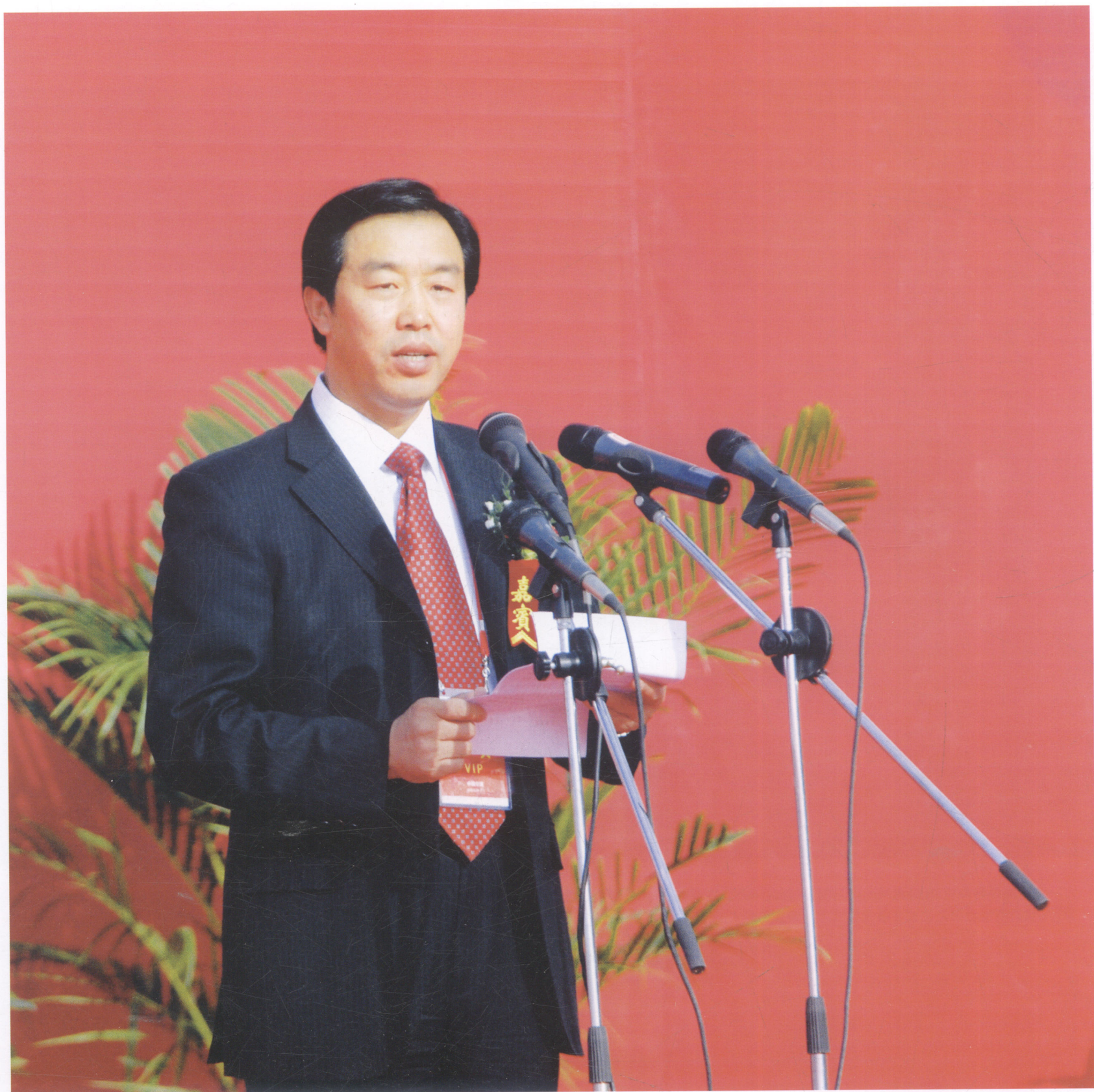
宁夏回族自治区党委副书记于革胜在中卫市点火仪式上致辞