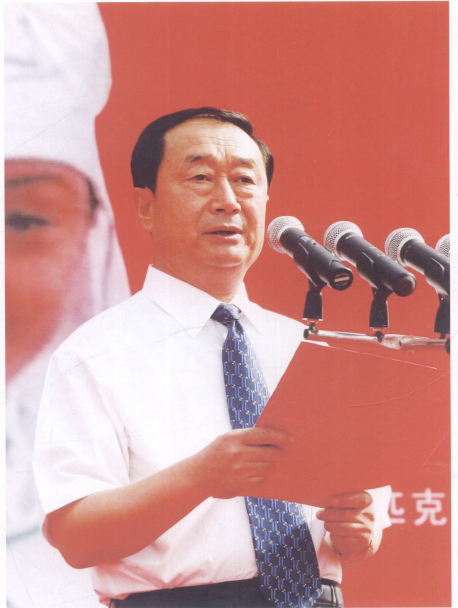
宁夏回族自治区人大常委会副主任马瑞文在吴忠市点火仪式上致辞