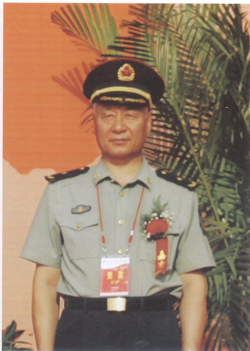
宁夏回族自治区党委常委、宁夏军区司令员陈二曦出席中卫市点火仪式