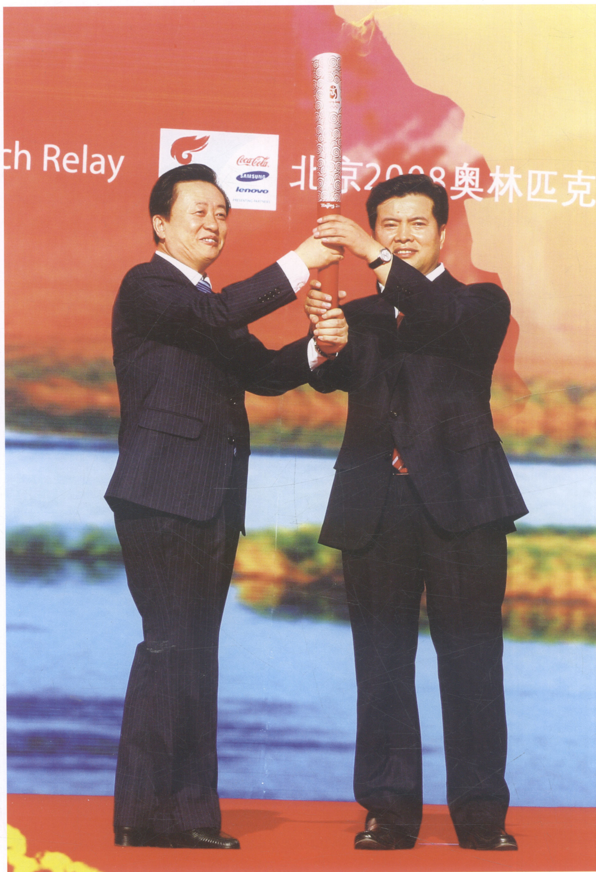
奥运火炬在宁夏银川市传递时，自治区主席王正伟从北京奥组委委员、 国家新闻出版总署副署长孙寿山手中接过火炬