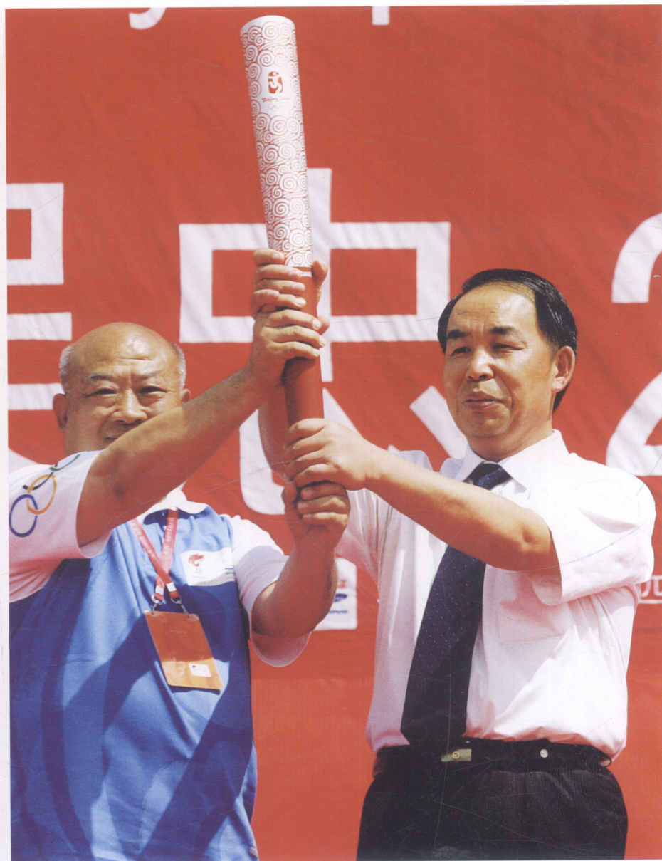
宁夏回族自治区副主席姚爱兴在吴忠市收火仪式上展示火炬