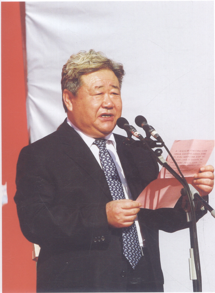
宁夏回族自治区党委常委、自治区副主席齐同生在银川市点火仪式上致辞