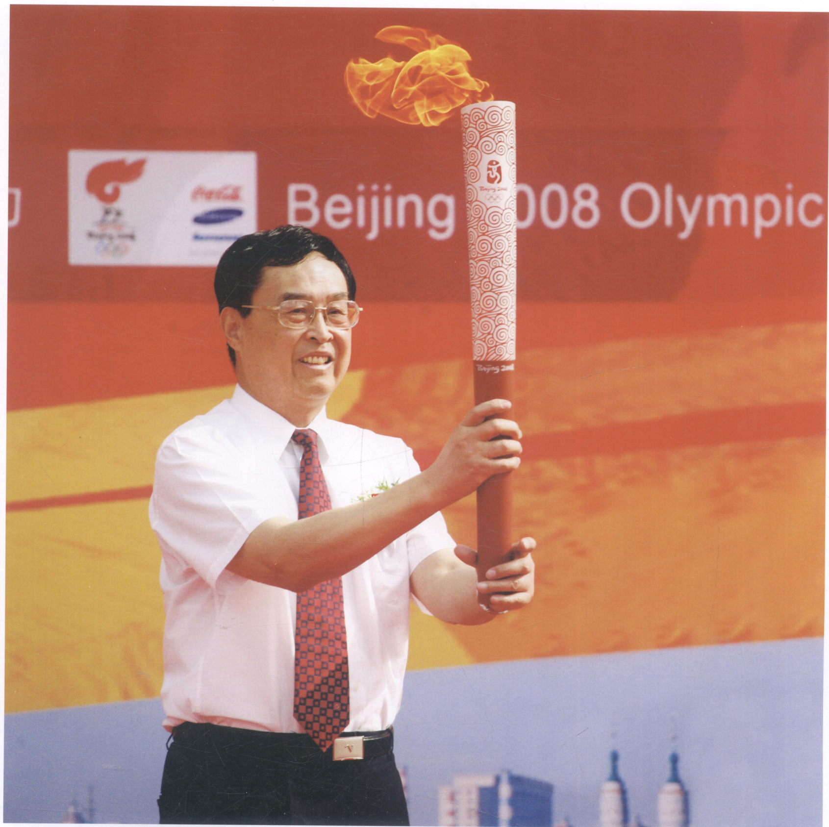
宁夏回族自治区政协主席项宗西在吴忠市点火仪式上展示火炬