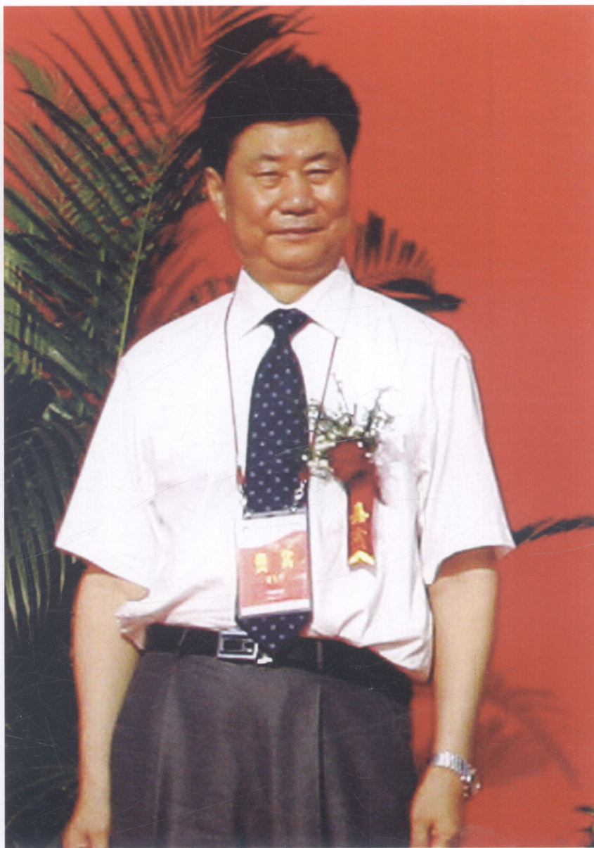
宁夏回族自治区人大常委会副主任刘天贵出席中卫市点火仪式