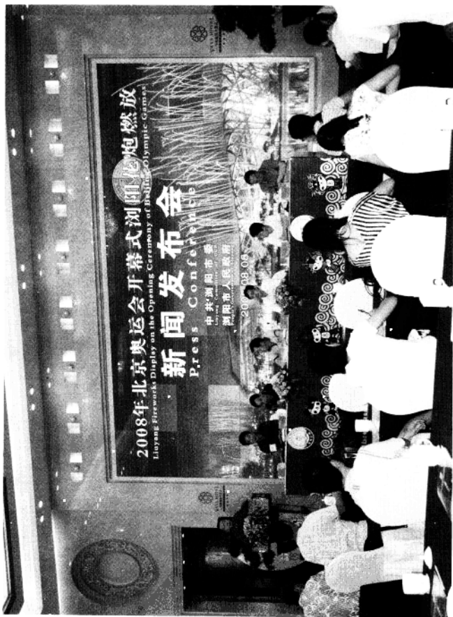
2008年北京奥运会开幕式浏阳花炮燃放新闻发布会