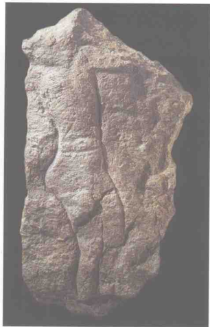
图1-5 《维纳斯》法国 约公元前21000年 波尔多阿坤廷博物馆藏