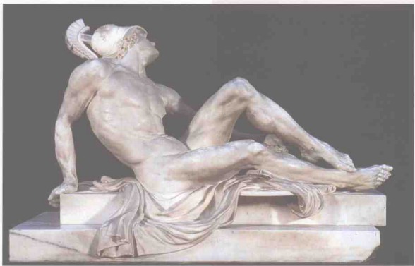
《受伤的阿喀琉斯》 吉罗 1789年