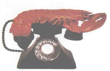
图1-11 《龙虾电话》 达利 西班牙 约1936年