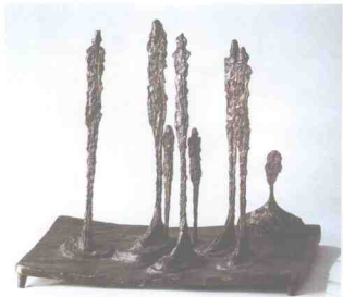
图 1-12 《七个人物与一个人头的构图》(森林) 贾科梅蒂 瑞士 1950 年