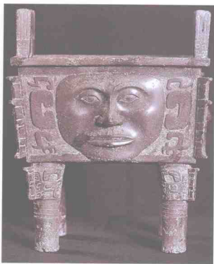
《人面纹方鼎》商 湖南省博物馆藏