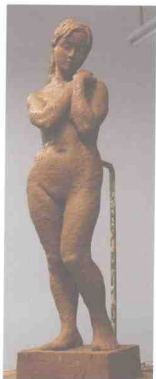
《女人体》 四川美术学院学生作品