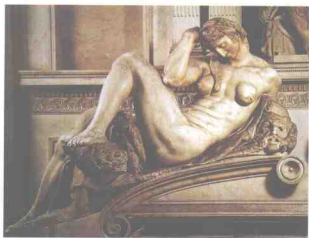
图1-17 《夜》 米开朗基罗 意大利 1475-1564年