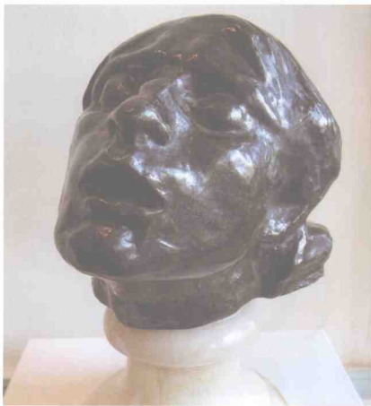
图 1-7 《悲伤之首》 罗丹 法国 1882 年