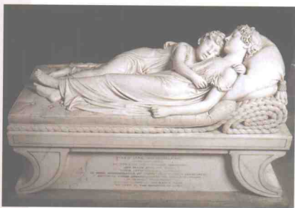
《安睡的孩子》 钱特里 英国 1817年