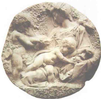
图 1-6 《塔代奥·塔代伊圣母》 米开朗基罗 意大利 1502~1504 年

雕塑是以雕刻和塑造为基础手段制作多维空间形象的艺术,其名称缘于雕、刻、塑三种制作方法的总称。使用各种可塑的材料,如黏土、油泥等制作的方法叫塑造;以各种可雕可刻的硬质材料,如石头、木头等制作的手段叫雕或刻。雕刻硬质材料用的是削减法,塑造软性材料主要是用堆加方法。米开朗基罗喜欢运用雕的方法,“除掉石材上那些多余的部分,使隐藏在其中的艺术生命解放出来”,这或许可称为“减法雕塑”。(图1-6)罗丹虽然推崇米开朗基罗,但采用的方法却与之不同,他运用塑的方法,把一团团泥巴堆集在一起,渐渐形成所需要的艺术形象,这种方法可以把它称之为“加法雕塑”。(图1-7)