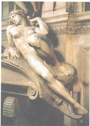
图1-16 《僕》 米开朗基罗 意大利 1475-1564年

在人体泥塑中,具体的单个形体应是对对象感觉后的概括。模特自身的特点给我们启示与感受,在此基础上把这种感受明确地进行概括、归纳,使之比对象更鲜明、强烈,特征更明朗,并在其中赋予几何体的因素,这样的形体就不再是原来的自然形态了,而是经过抽象与综合后感觉与概括的重新结合。这种概括并不是对客观对象的不尊重,而是主观感受在客观对象基础上的更准确表达。自然人体中骨骼肌肉的凸起和凹陷基本关系构成了人体形基本的点、线、面,结合内部解剖结构来塑造出来的形体结构也是防止概念化的分块分