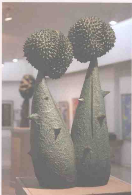
《留恋》 四川美术学院学生作品