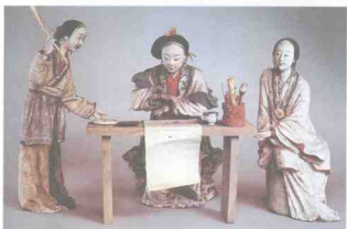
图 1-13 《惜春作画》清 故宫博物馆藏