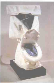
图 1-15 《软厕所》奥尔登堡 瑞典 1966 年

般不大,也有室内、室外之分,它是以雕塑为主体去充分表现作者自己独特的想法和感受、风格和个性,甚至是某种新理论、新想法的试验品。它的形式、制作手法让人眼花缭乱,内容题材更为广泛,材质应用也更具时代性,它给有才能的艺术家提供了无限的创造性空间,从而使雕塑这种艺术形式不断地得以向前发展。(图 1-12)