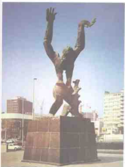
图1-8 《被毁灭的蒙特丹市纪念碑》 扎德金 法国 1951-1953年