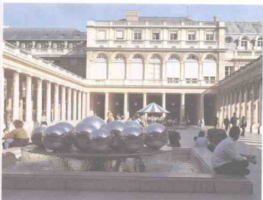
图1-10 《王宫之泉》 布里 比利时 1966年