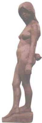
《女人体》 四川美术学院学生作品

比作一条链环，则应该着重对这些链环中 联结点的细微之处进行分析并加以研究， 以寻找出其中的规律性。(图 1-3)