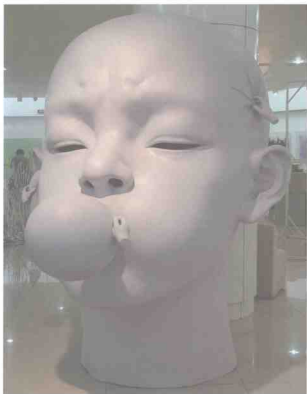
《创作》 四川美术学院学生作品