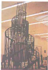
图1-9 《第三国际纪念碑设计稿》 塔特林 俄国 1920年