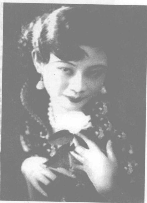
特工头子戴笠和电影皇后胡蝶