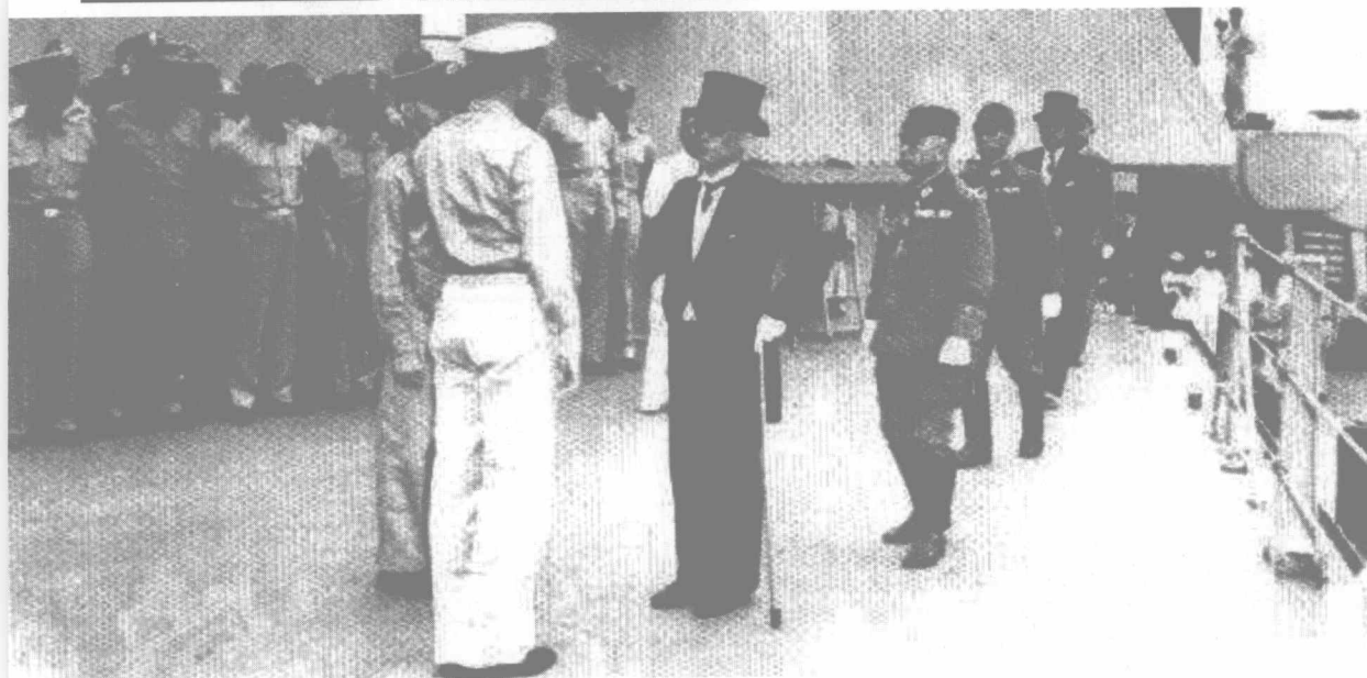
断一腿的重光葵代表日本政府、梅津美治郎将军代表帝国统帅部,准备在密苏里号战舰上签署投降书