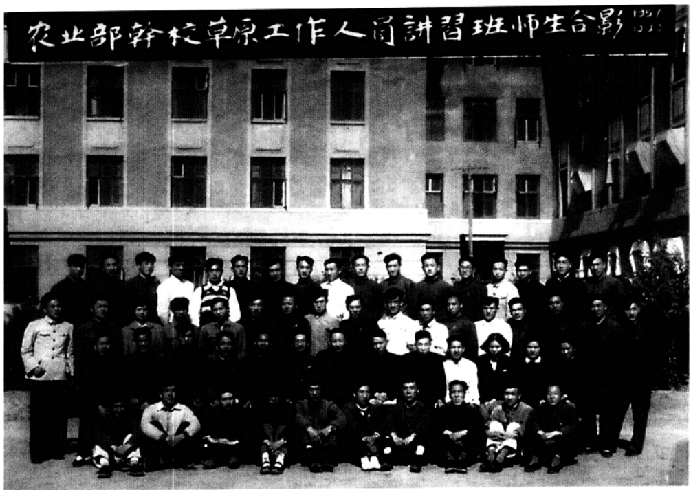
农业部干校草原工作人员讲习班（1957年10月）师生合影