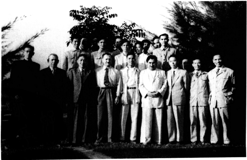
任继周先生（前排右3）1958年赴越南讲学期间与苏联专家和越南政府官员合影