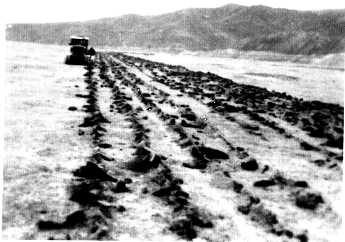
20 世纪 60 年代研制和使用第一代草原划破机——燕尾犁划破草皮改良草原