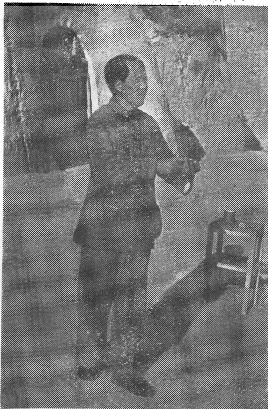
毛泽东同志1939年在延安抗大作报告时的情景

绿叶扶持”，党委要学会“弹钢琴”，党员要经常“洗脸”、“扫地”等等，不胜枚举。“言而无文，行之不远”。可以想见，如果我们的革命导师不是采用如此生动的语言、比喻，那些教导我们做一个好党员、建设一个好的党的道理，未必能起到至今刻骨铭心的作用。