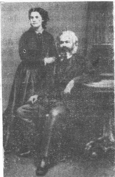
与马克思和他的女儿燕妮

希望，聚集和汇合了多少中华优秀儿女。旧中国连年军阀混战，各种政派团体纷起，最多时达到300多个，其中许多根本没有什么原则，今天鼓吹共和，明天又主张立宪，甚至拥戴倒了台的皇帝，人民早就厌透了这种把戏。唯独