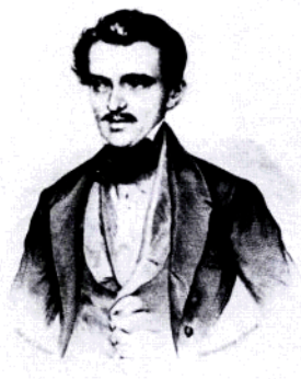
老约翰·施特劳斯肖像

19世纪，统治欧洲乐坛的是圆舞曲。老约翰·施特劳斯凭借150多首圆舞曲奠定了维也纳音乐的基础，被誉为“圆舞曲之父”。