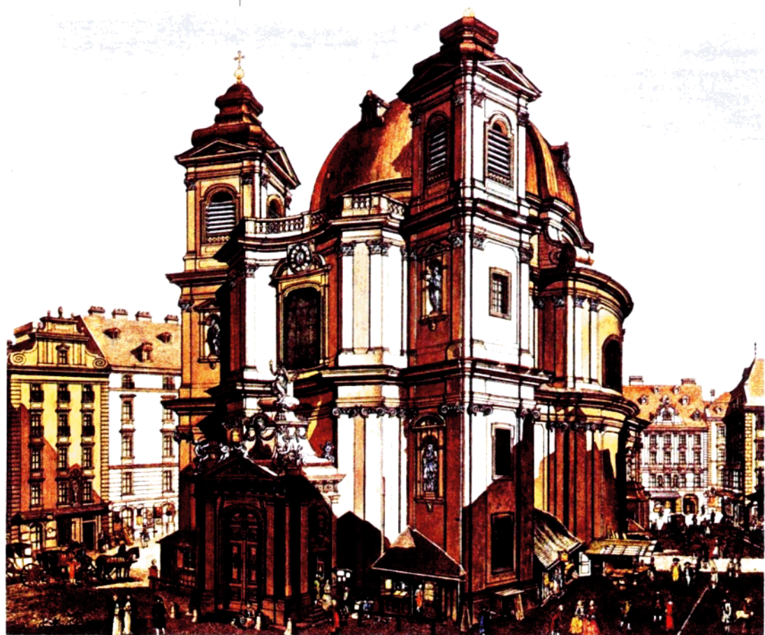
维也纳圣彼得教堂近景

刻要求再奏一遍。在观众热烈的欢呼声中，乐队演奏了初次登台的青年作曲家小约翰·施特劳斯自己创作的华尔兹舞曲、四组舞曲和波尔卡舞曲。等到他演奏他父亲创作的最优美的圆舞曲时，全场观众热情高涨，达到疯狂的程度。这支曲子就是老约翰·施特劳斯在1843年写的《莱茵河罗蕾莱的回声》圆舞曲，老约翰·施特劳斯一生作品不少，就只有这一首圆舞曲显示出他作为音乐诗