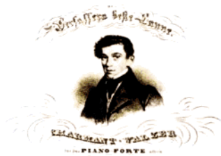
老约翰·施特劳斯25岁时的肖像。

约瑟夫·兰纳(1801—1843)维也纳作曲家、演奏家。兰纳出生于维也纳一个手工匠家庭，深受“音乐之都”音乐氛围的影响，他并未承继父业，而是进入当时著名的米夏埃·帕默舞曲乐团担任小提琴手。1819年，兰纳离开帕默乐团，自组三重奏小乐队，在维也纳乐坛一举成名。兰纳与老施特劳斯一同奠定了维也纳圆舞曲在乐坛中的地位，并对其进行了革新，他一生创作了一百多首圆舞曲，不愧是圆舞曲的“开山鼻祖”。