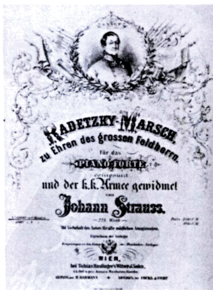
老约翰·施特劳斯《拉德茨基进行曲》琴谱封面。

要想在维也纳乐坛立住脚，抓住听众的心是关键！细心的小约翰发现，在维也纳，波希米亚、塞尔维亚、斯拉夫等少数民族处于被人遗忘的角落之中；同时，年轻人也没有属于自己的音乐。干吗不为他们写歌呢？把他们变为自己的有力支持者！