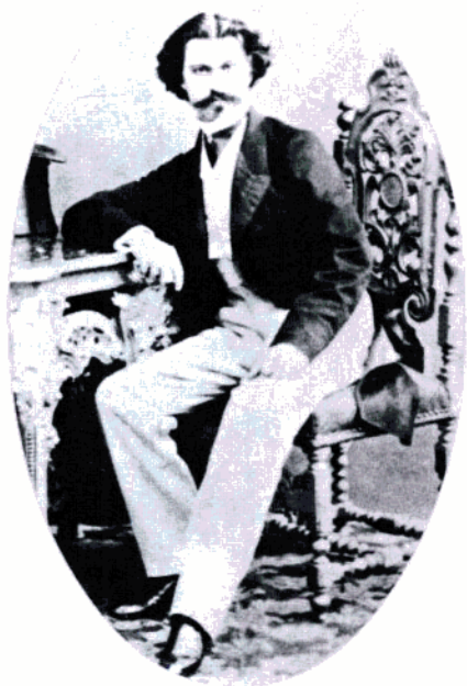
1850年的小约翰·施特劳斯

随着时间的推移，老约翰·施特劳斯与家里的关系日趋恶化。这首先是由于他性格上的弱点：专横跋扈，独断专行，性格暴躁，神经过敏。他在家里变成一个专制暴君，对亲人缺乏耐心、缺少感情。但家庭关系恶化的最主要原因还在于他另有新欢，后来甚至搬到小公馆另立家庭。