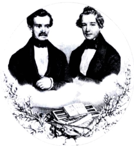
老约翰·施特劳斯(左)与约瑟夫·兰纳。他们俩是维也纳华尔兹的真正创始人。

维也纳圆舞曲：圆舞曲的变种，奠基人是维也纳著名音乐家约瑟夫·兰纳和老约翰·施特劳斯。维也纳圆舞曲通常附有标题，乐曲开始有序奏，末尾有再现主题的尾声，主体部分由3至5首小圆舞曲构成。比起传统圆舞曲来，维也纳圆舞曲更为轻松明快、通俗易懂、格调高雅、风格活泼。维也纳圆舞曲的集大成者为小约翰·施特劳斯，他一生共创作了维也纳圆舞曲近200首，并使维也纳圆舞曲由纯粹的舞会伴奏乐变为可供欣赏的音乐。