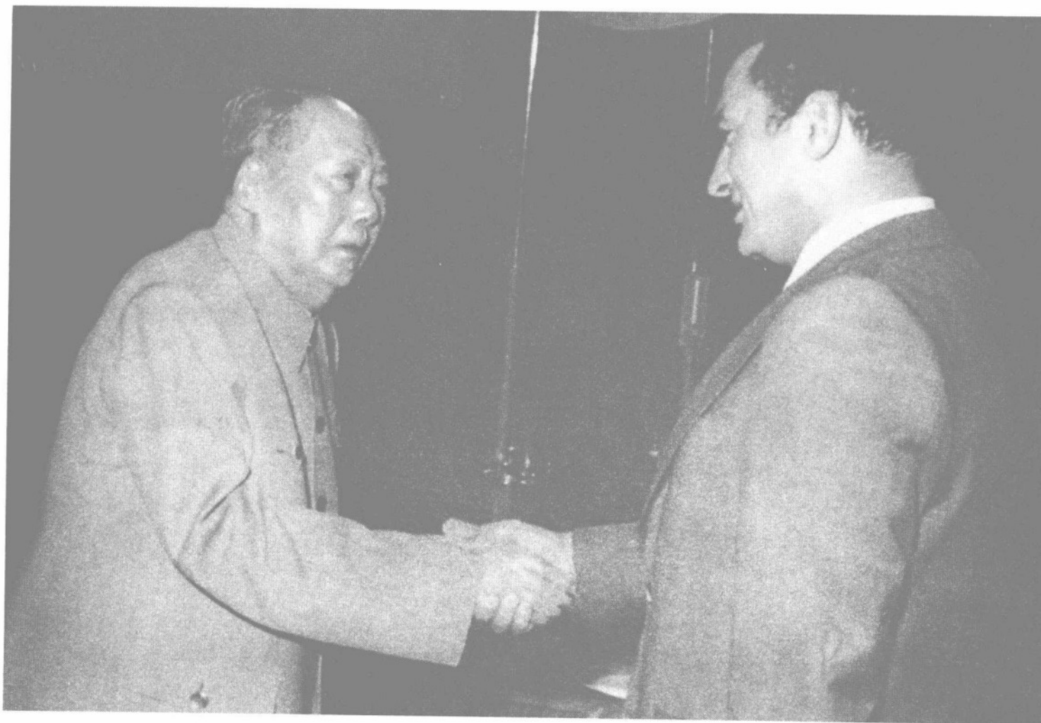
1976年4月20日,毛泽东主席会见访华的埃及副总统穆巴拉克。