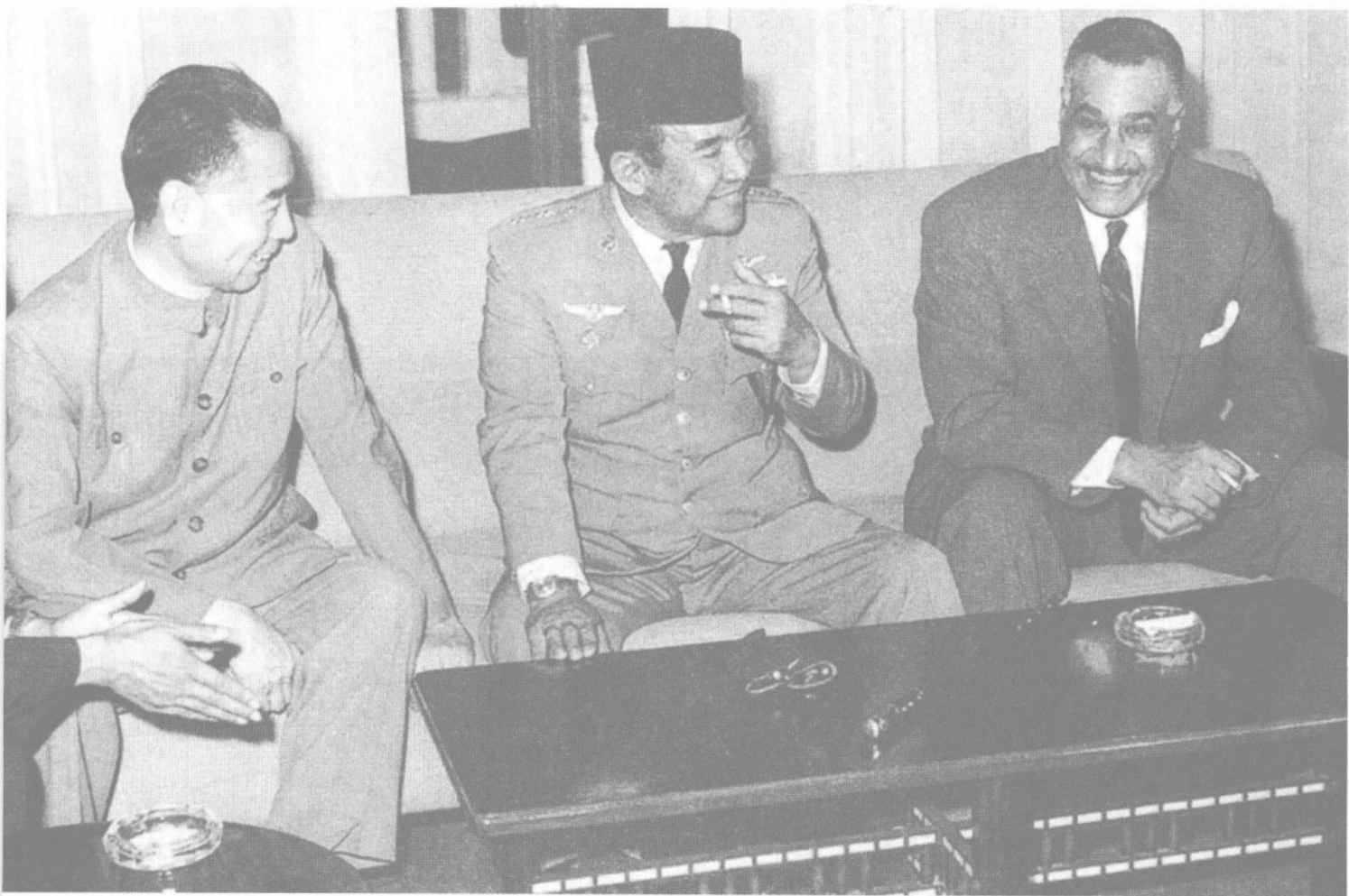
1965年6月，周恩来总理在开罗与印度尼西亚总统苏加诺（中）和阿联（今埃及）总统纳赛尔（右）在一起。