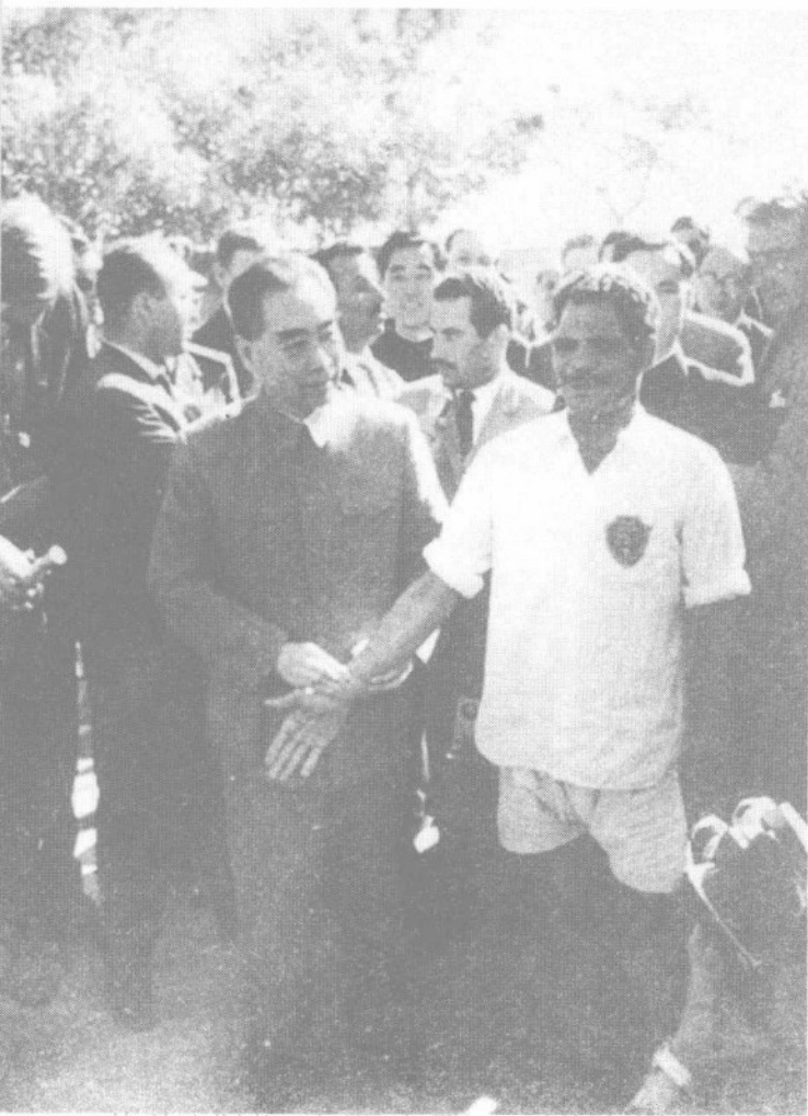
1963年12月，周恩来总理在金字塔前和阿联（今埃及）运动员交谈。