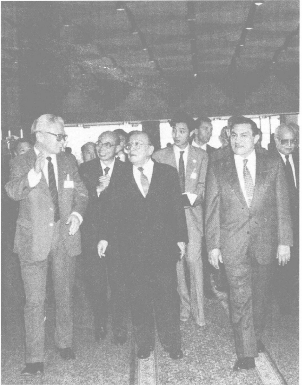
· 1989年12月,杨尚昆主席同埃及总统穆巴拉克并肩走进开罗国际会议中心,詹世亮大使(左二)陪同。