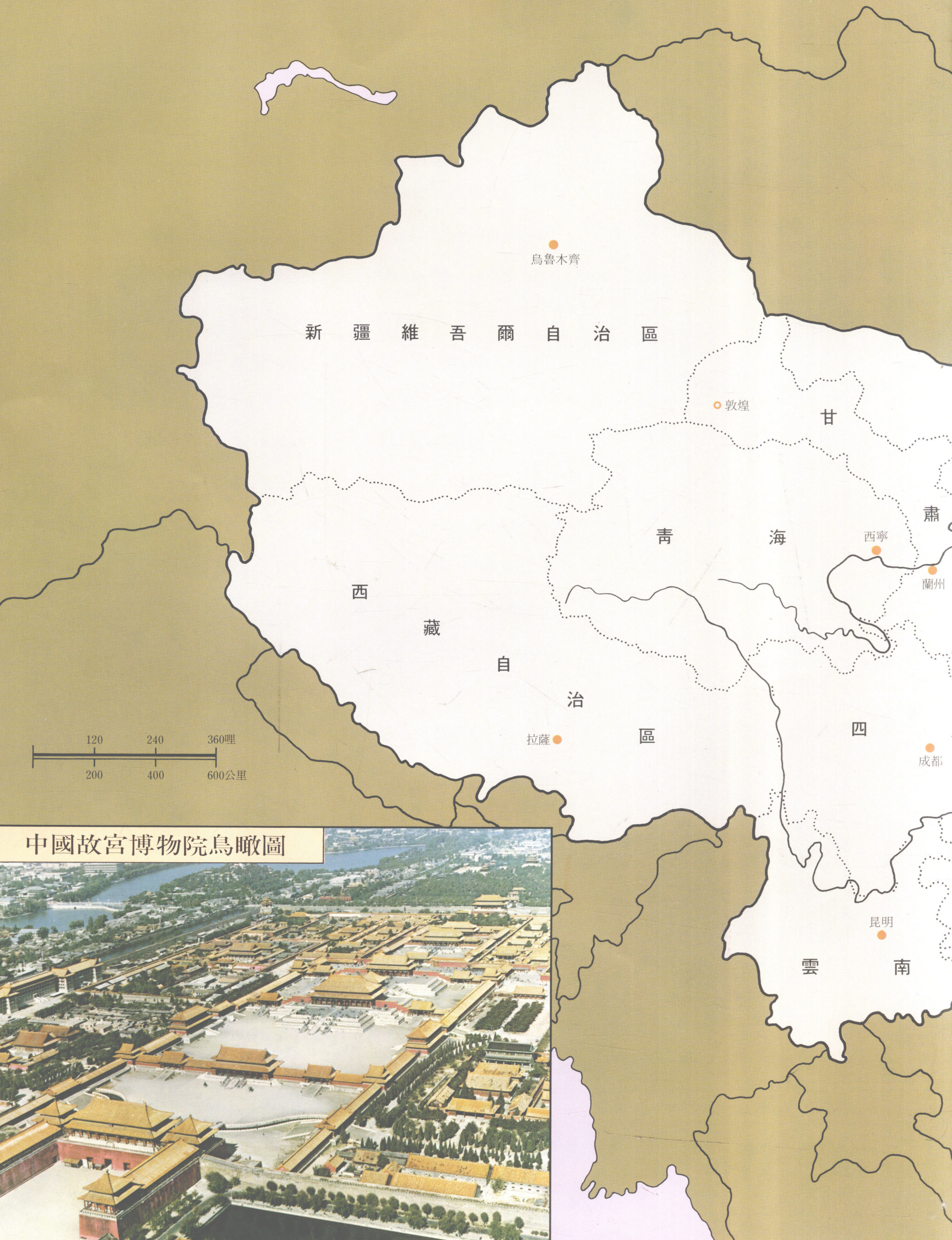
中國故宮博物院鳥瞰圖