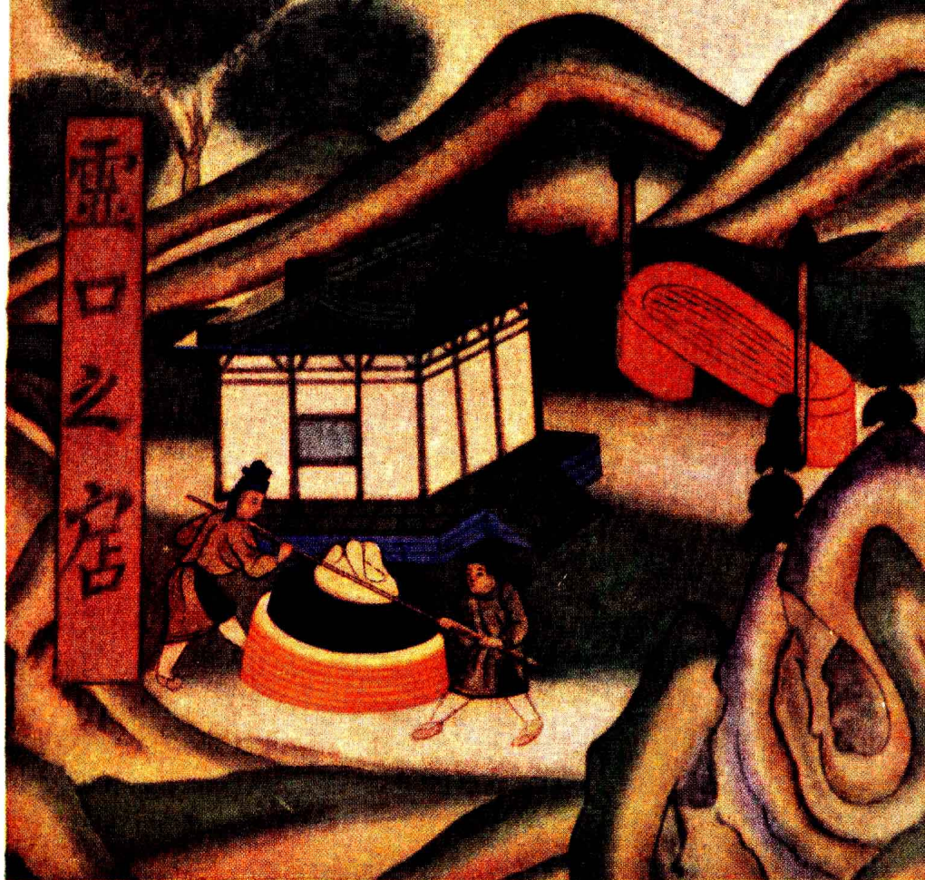
3. 推磨图 (宋·第61窟) 李承仙摹