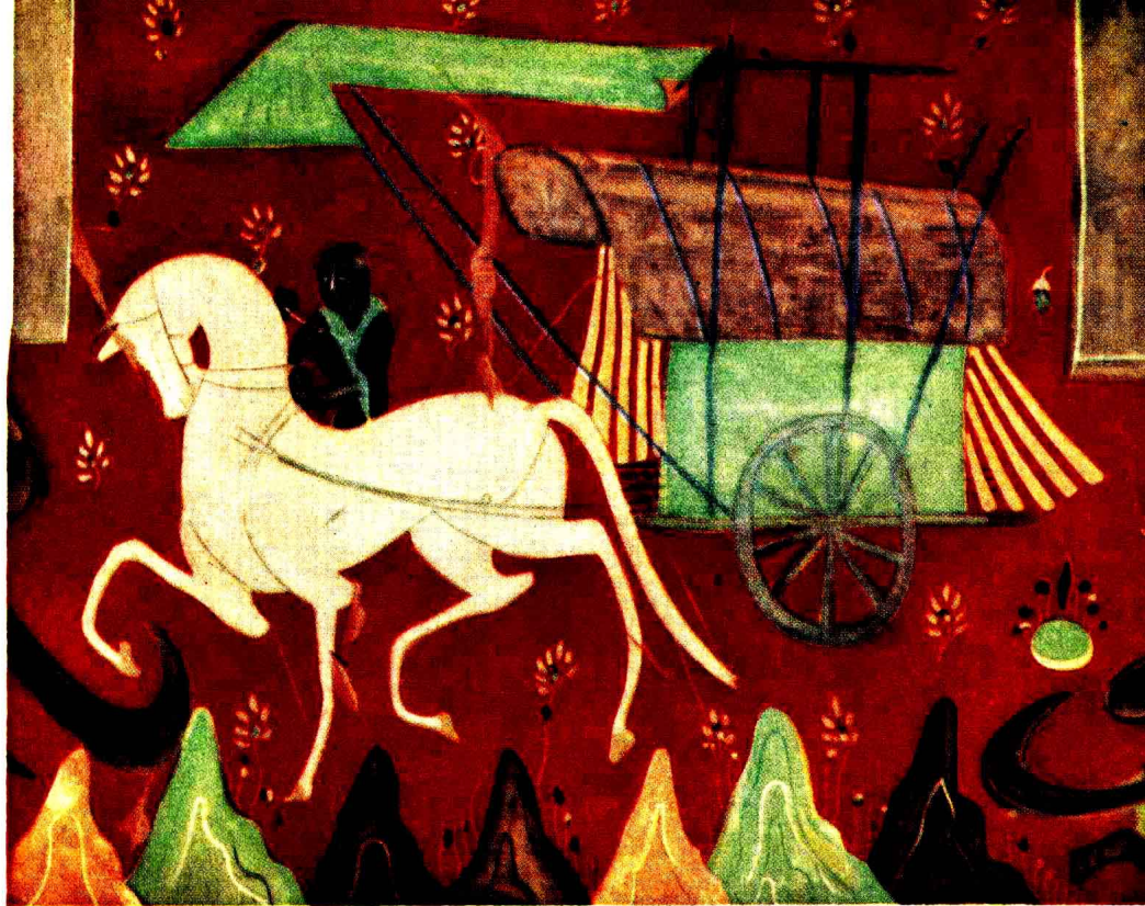
1. 馬車 (晉魏·第 257 窟) 常書鴻摹