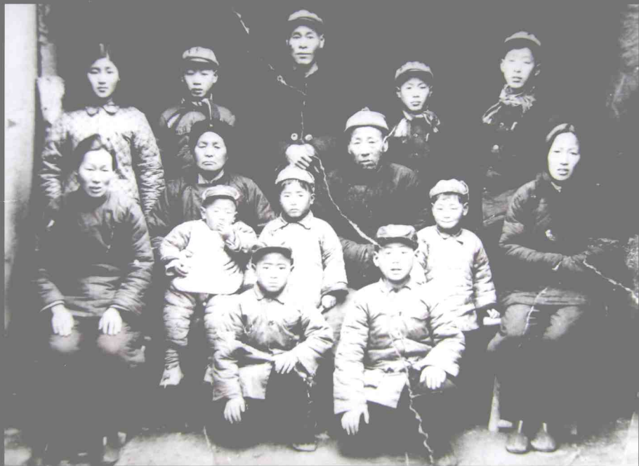
二排中祖母怀抱着的孩子为作应议