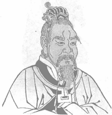
图说：颛顼帝高阳氏

可以说，以奴隶社会为主要形态的上古社会，是人类文明初步建立并迅速达的社会，在政治、经济、社会生活和文方面，都对后来各国的进一步发展产生了深远的影响。