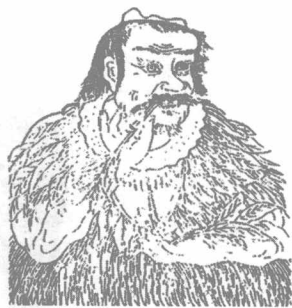
图说：三皇之一神农氏

上古帝王神农氏继女娲后为天下共主。传说他人身牛首，头上有角，生于烈山石室，长于姜水，有圣德，以火德王，故号炎帝。炎帝少而聪颖，三天能说话，五天能走路，三年知稼穡之事。他一生为百姓办了许多好事：教百姓耕作，百姓得以丰食足衣；为了让百姓不受病疾之苦，他尝遍了各种药材，以致自己一日中七十次毒。他又作乐器，让百姓懂得礼仪，为后世所称道。至他开始，中华民族开始进入农耕社会。