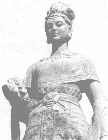
图说:伏羲女娲像页,唐,绢本。吐鲁番遗画。