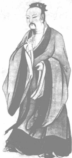
图说：唐尧定历法，施德政，抗天灾，建国制，选贤能，政绩卓著。

涿鹿之战后，炎、黄两部落发生了战争，黄帝击败了炎帝。从此，中原各部落都尊黄帝为共主，炎、黄等部落在黄帝的领导下融合成华夏民族。故中华民族素自称为“黄帝后裔”，也称为“炎黄子孙”。