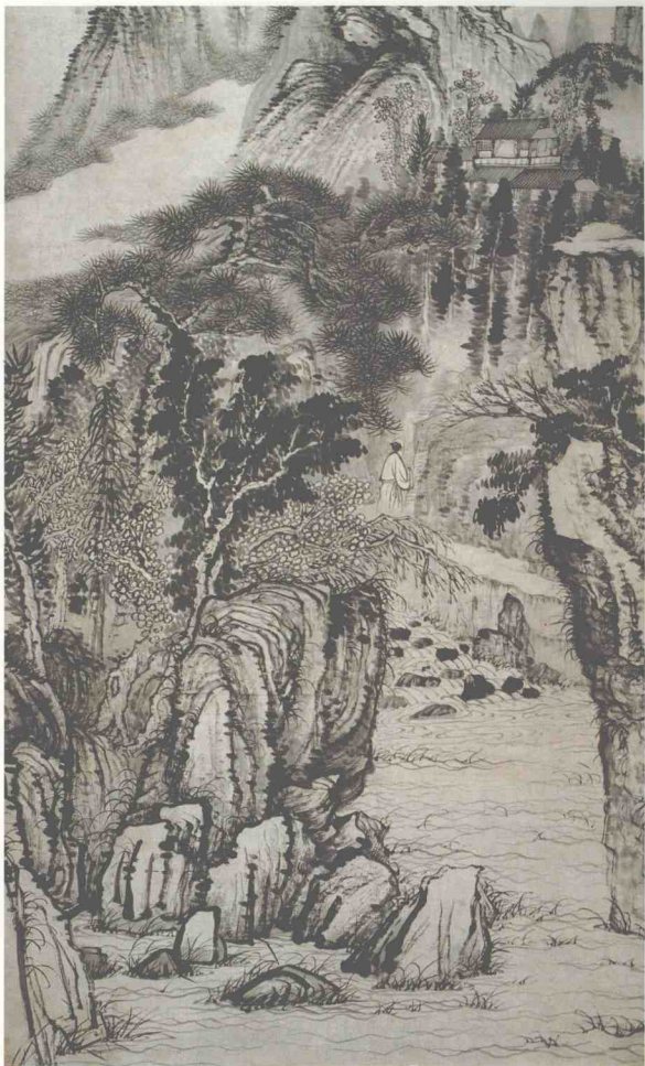
13. 为徽五作山水局部