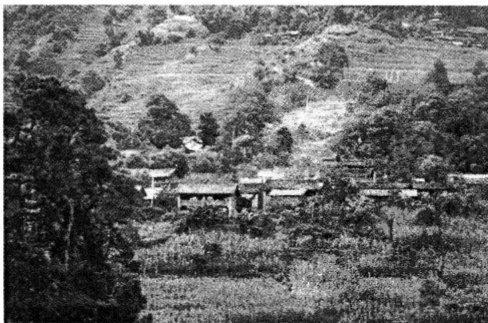
图2 乌木龙乡乌木龙村民委员会所在地——大寨