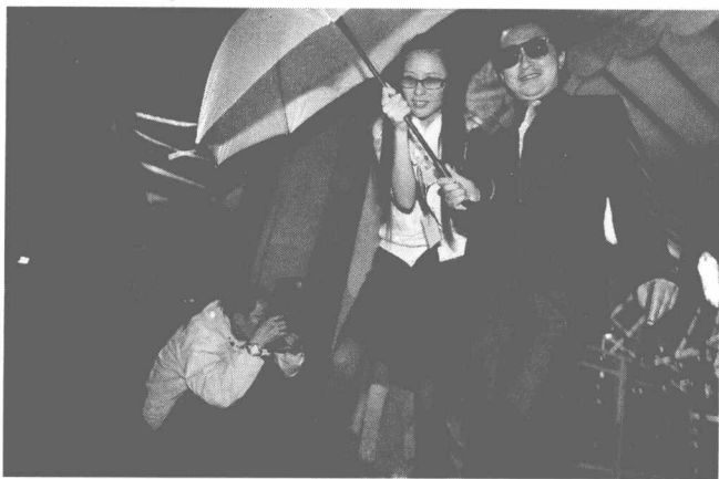
2006年11月25日,大肆标榜“富翁 VS 美女”的征婚派对,在浦江游览船“船长一号”上高调开场。十几位被称是亿万富翁的单身富翁,掩面而入,与所谓的美女相亲。