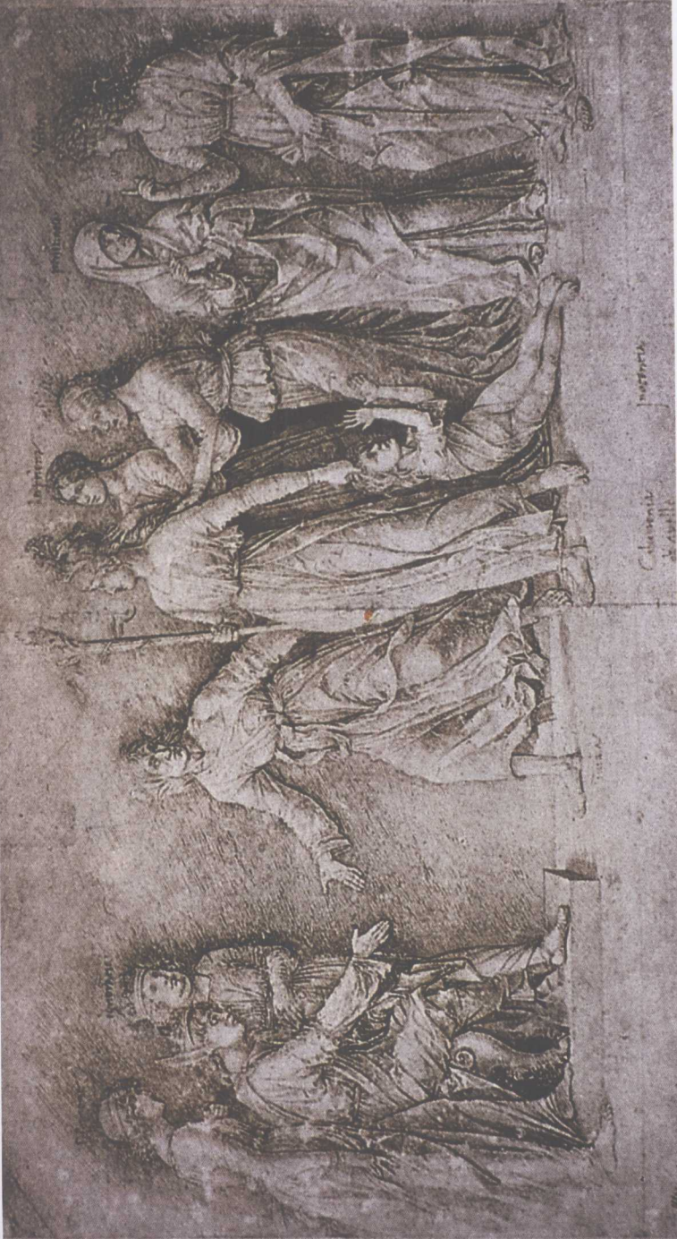
安德烈·曼特尼亚 Andrea Mantegna (意大利) (1431—1506)