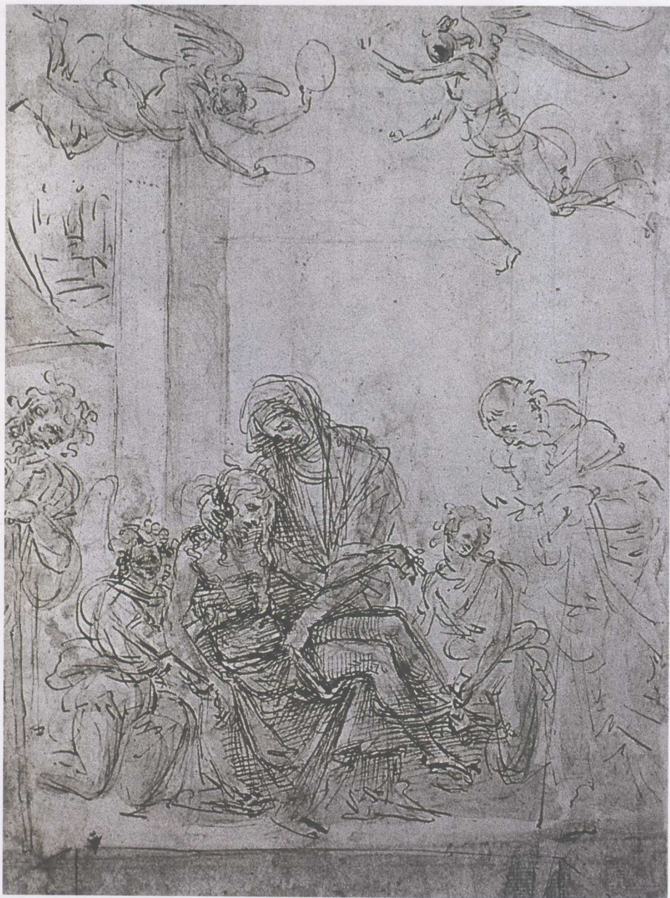
菲利皮诺·利比 Filippo Lippi (意大利) (1457-1504)