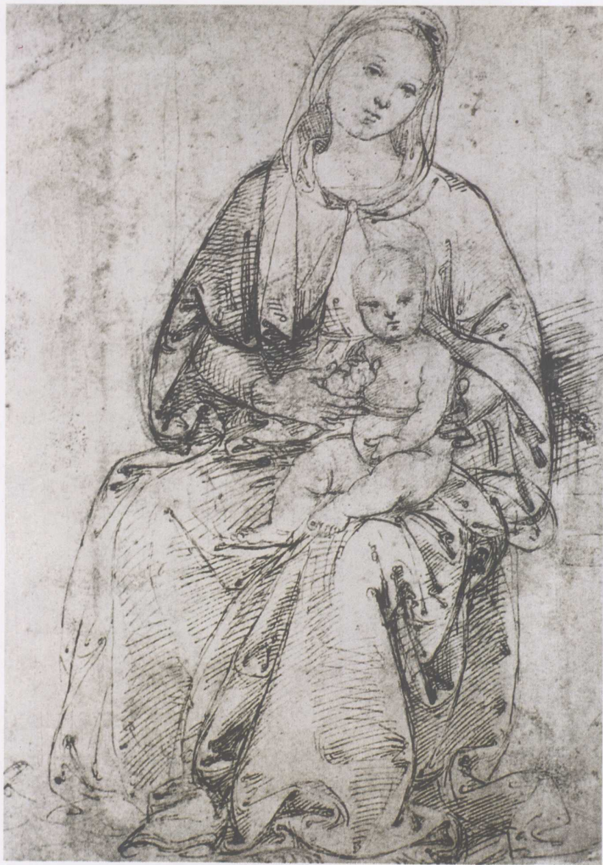
平托利奇奥 Pinturicchio (Bernardo di Betto) (意大利) (1454—1513)