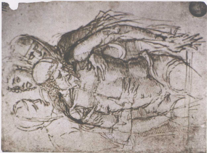
乔瓦尼·贝利尼 Giovanni Bellini (意大利) (约 1430—1516)

左图：圣殇 钢笔 墨水 12.9 × 9.8cm 右图：圣殇 褐色淡彩 13 × 9.4cm