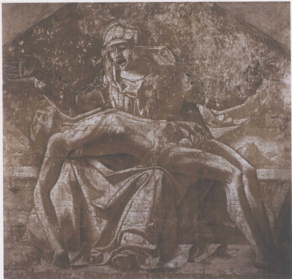
埃克尔·德·罗贝蒂 Ercole De' Roberti (意大利) (约 1456—1496)