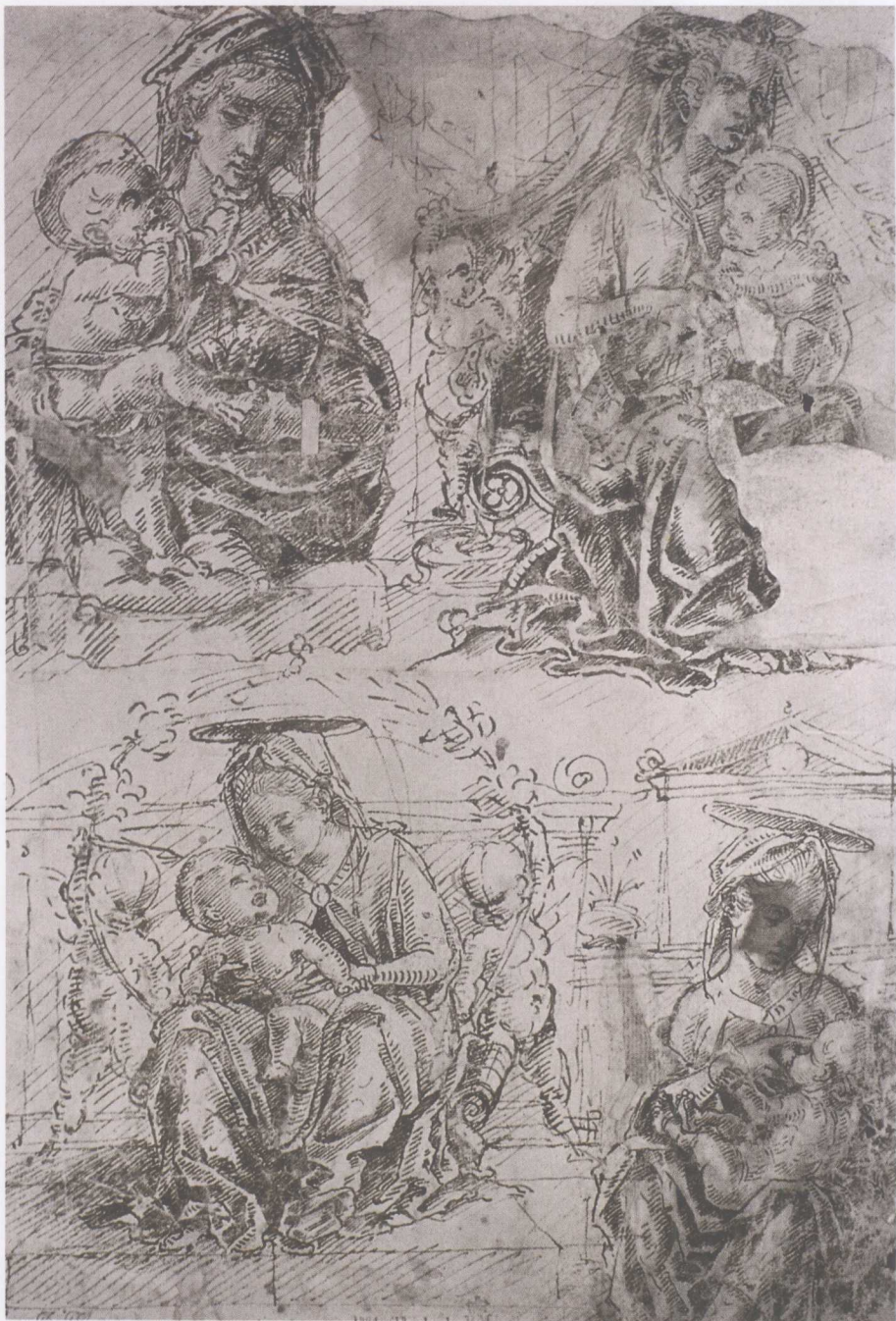
马可·佐普 Marco Zoppo (意大利) (1433—1478) 圣母子习作 钢笔 27.4 × 18.2cm 威尼斯画家，是斯卡拉奇奥的学生，不过受图拉的影响更大。