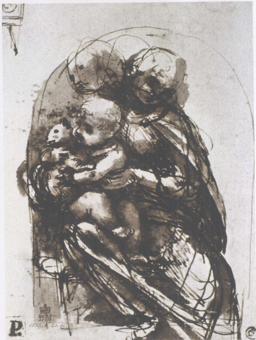
列奥纳多·达·芬奇 Leonardo Da Vinci (意大利) (1452—1519)