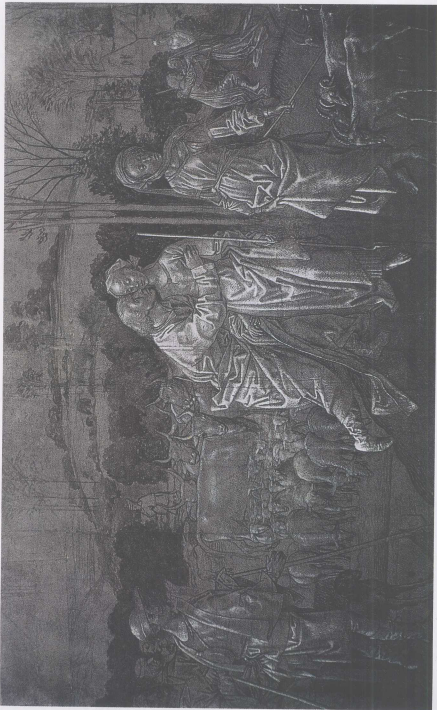
雨果·凡·德尔·古斯 Hugo Van Der Goes (弗兰德斯) (1439/40-1482)

雅各与拉结 钢笔 褐色墨水 褐色淡彩 白色提高光 深灰色打底的纸 34 × 57cm