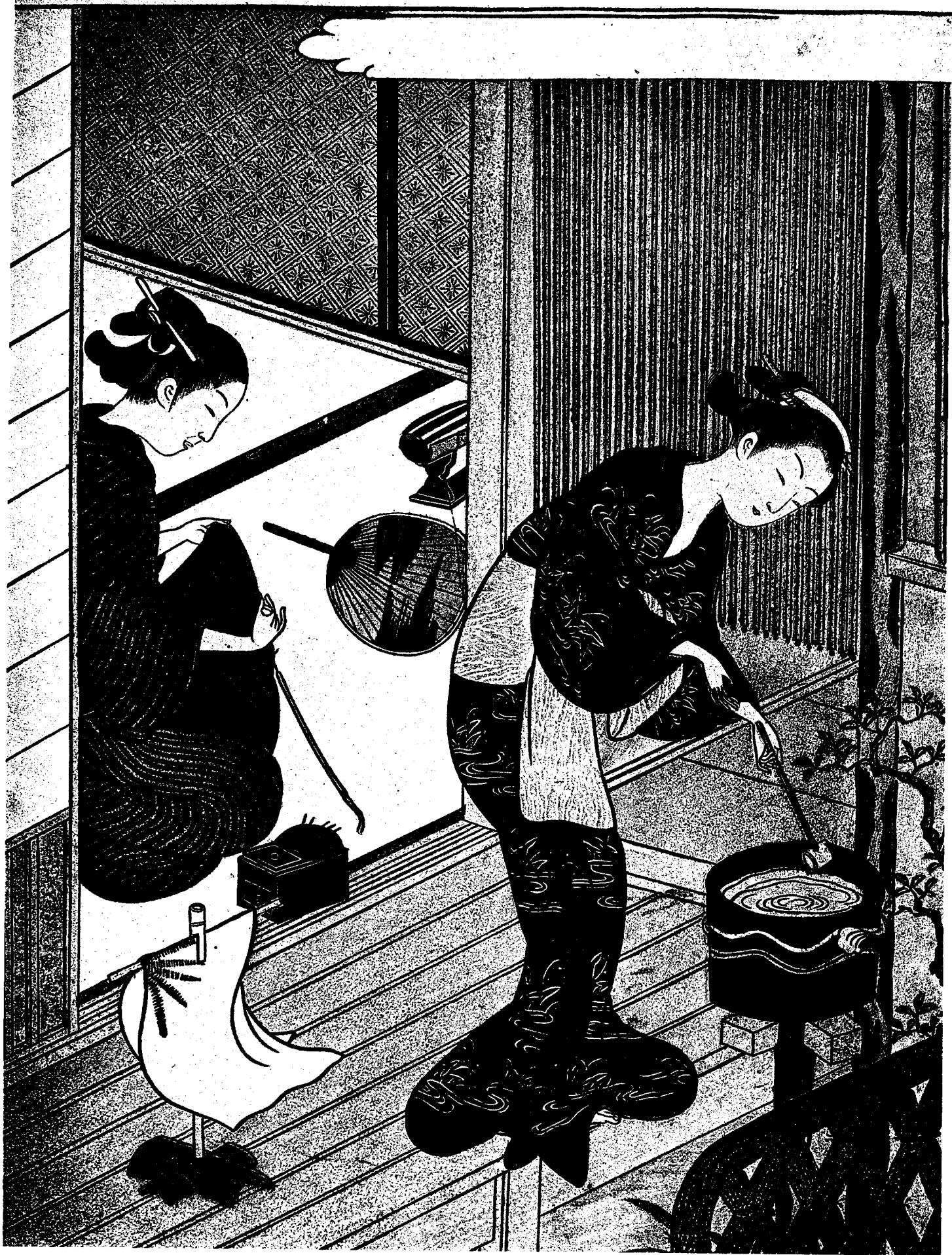
14. 座敷八景 架上洗后的毛巾