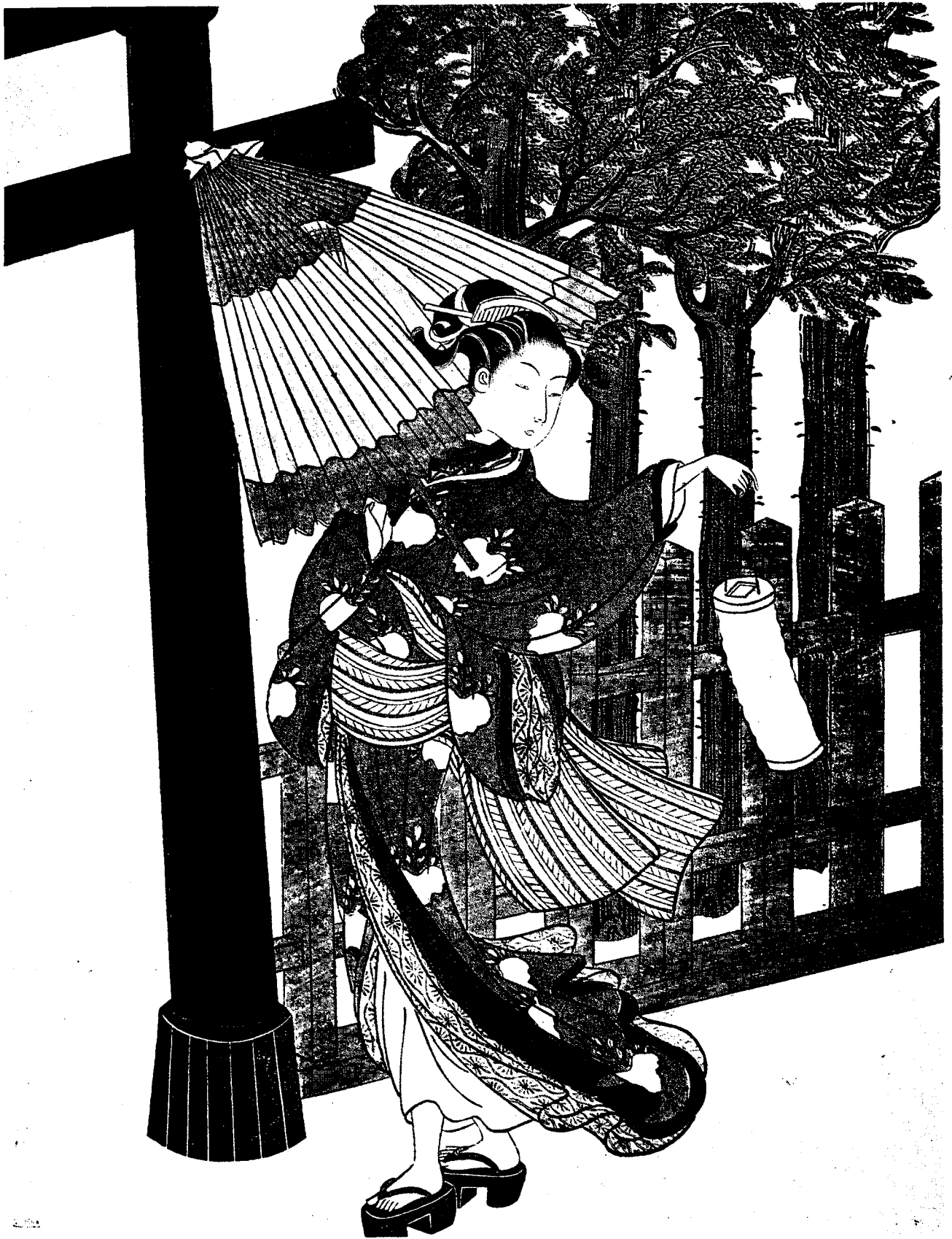
3. 冒夜雨进宫闱的美女