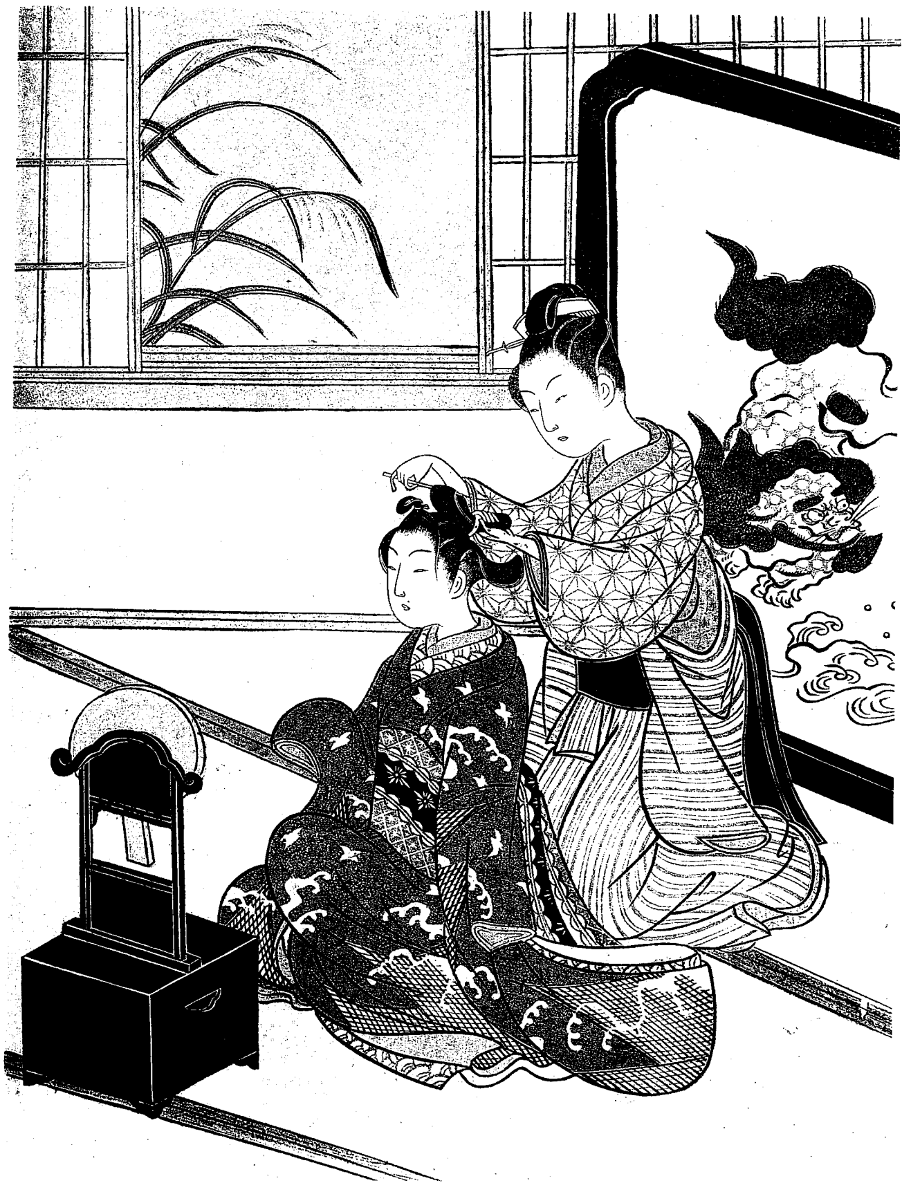
6. 座敷八景 镜台秋月