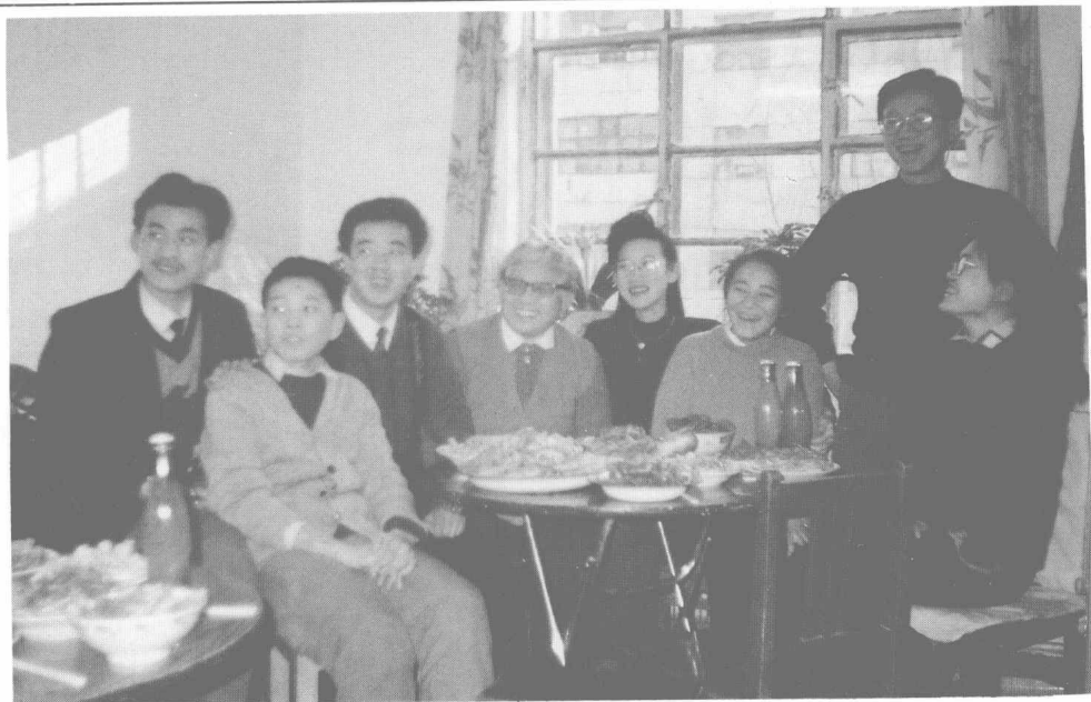
古丁夫人与古丁第三代。