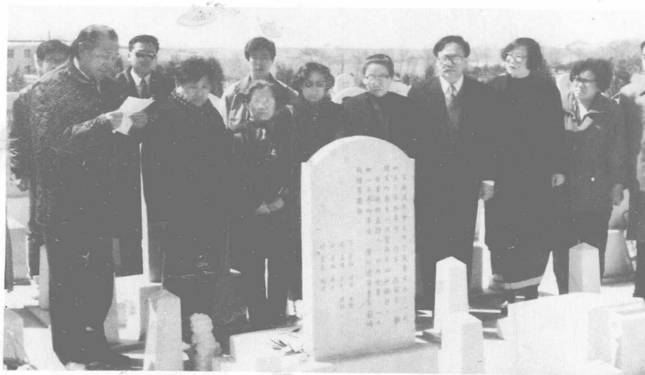
古丁夫妇合葬仪式