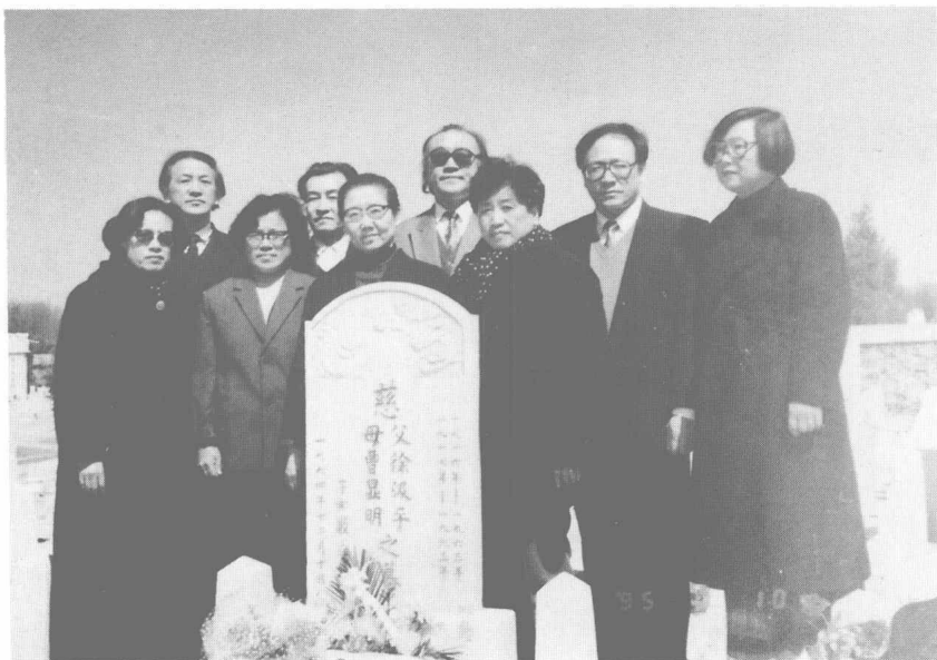
古丁的子女在其父母合坟墓前。