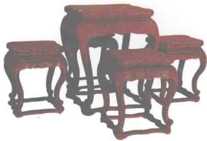
图13 清代红漆五件套桌与凳（上海博物院藏，引自展览图录）

清代的各种漆家具，我们从《红楼梦》中描写大观园陈设的家具中，也可知其一斑。书中描绘，凡厅堂、书斋、别院，常以漆饰家具最为讲究、最显尊贵，如十二扇“百寿图”大围屏是泥金的；有成套的雕漆椅子，雕漆护屏，矮足短榻；又有海棠式、荷叶式、梅花式雕漆几；以及梅花式洋漆小几、洋漆茶盘、洋漆书架等，均可藉以说明清代漆饰家具