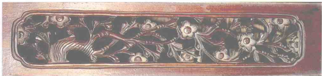
图10 明代拔步床上透雕的梅花纹图案

生的中国明式家具，在某种意义上，竟已成为西方世界设计革命的榜样和兆端。因此，我们需要不断提高对我国古典家具的鉴赏能力，能提出更多的真知灼见，从传世的明清家具实物中，去努力地挖掘出更多的珍贵的民族文化精粹。以创造出新时代的物质产品来体现人类自身的进步和生活的理想，这是人类社会永远不会停止的造物 and 精神的相互转化与升华。因而，我们在通过提高鉴赏古典家具水平的同时，同样可以更好地去推进民族先进文化的继承和发扬。