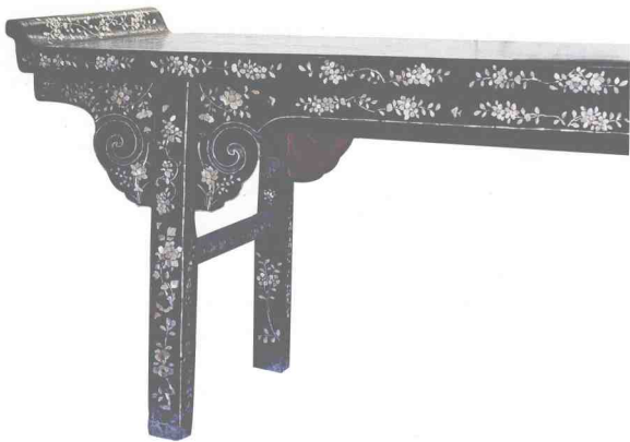
图14 清代黑漆嵌螺钿平头案（故宫博物院藏）

价仅一两的花梨木床相比，高级的漆饰家具在当时显然比硬木家具要贵重得多。这一事实无疑很好地说明了漆饰家具在明代家具中的独特地位。明人何士晋辑的《工部厂库须知》卷九，载有万历十三年（1585）宫中传造龙床等四十张的工料费用，竟耗资白银高达三万二千六百零一两之巨，如此高价格的龙床，就更能说明明代漆饰家具在宫廷生活中的重要意义。