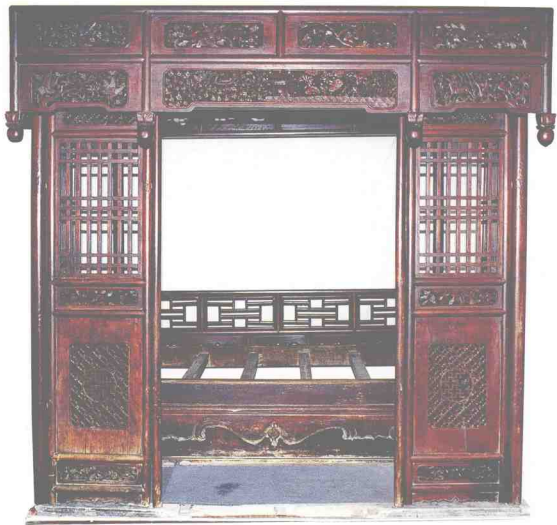
图1 明代垂花柱式拔步床