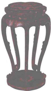
图17 清代雕填龙纹梅花式香几（故宫博物院藏，引自《中国美术全集·工艺美术篇11》竹木牙角器）