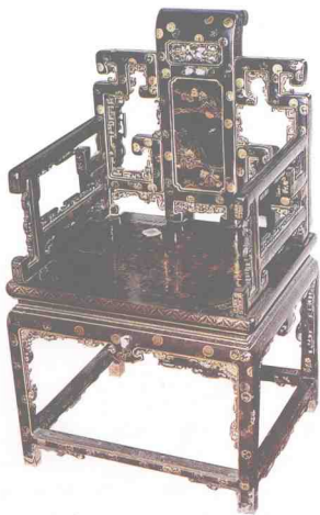
图15 清代黑漆描金扶手椅(故宫博物院藏)

至今,北京故宫保存的大量明清家具中,漆饰家具同样占有相当多的比重,精品之显耀、水平之高级,是特别惹人注目的。我们要感谢故宫博物院,通过有关工作人员的清理、研究和介绍,让更多的人看到了这些家具的历史面貌和真实情况(图14-15)。还有不少已流失海外的明清漆家具,也无不都是代表卓越水平的艺术珍宝(图16)。如康熙年间(1662-1723)的剔红云龙纹宝座,是这一时期极其优秀罕见的雕漆家具,它是苏州织造府的制品。黑漆嵌螺钿圈椅、黑漆金髹龙纹交椅、绀色地戗金细钩填漆龙纹梅花式香几(图17)、黑漆嵌螺钿山水人物平头案、雕填花卉纹漆几、花鸟博古纹