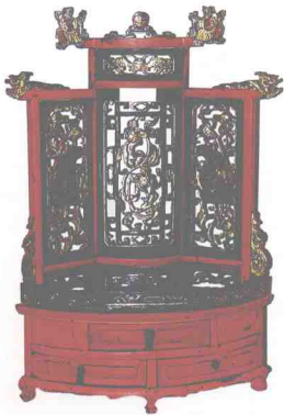
图18 清代朱漆金彩镜台（浙江省博物馆藏）

具新材料的运用，同人类科技发展史上的情况一样，常常引起时代性的变化，不仅使传统家具的生产、品种、制造工艺等发生重大革新，同时，对人们的生活环境、生活方式、审美情趣和文化心理也都会产生各种影响。南京博物院珍藏的老花梨木书桌腿部刻制的诗铭，就是最生动的历史写照：“材美而坚，工朴而妍，假而为凭，逸我百年”的赞叹和感慨，不能不是当时士大夫们生活情怀和审美旨趣的真实流露。对一种优质硬木桌子竟然能如此感叹而深爱，这完全是明式家具所产生的艺术和精神，赋予了时人一种新的生命力。