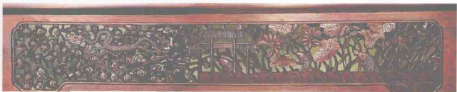
图5 明代拔步床上透雕的鲤鱼跳龙门、莲塘、云龙纹图案