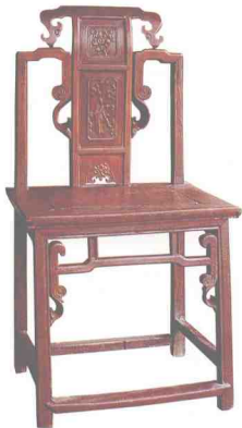
图19 清代晚期朱漆靠背椅（浙江卢宅藏）