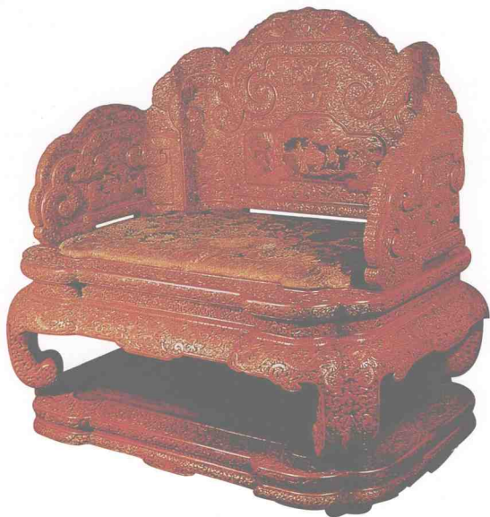
图16 清代剔红宝座（已流失海外）