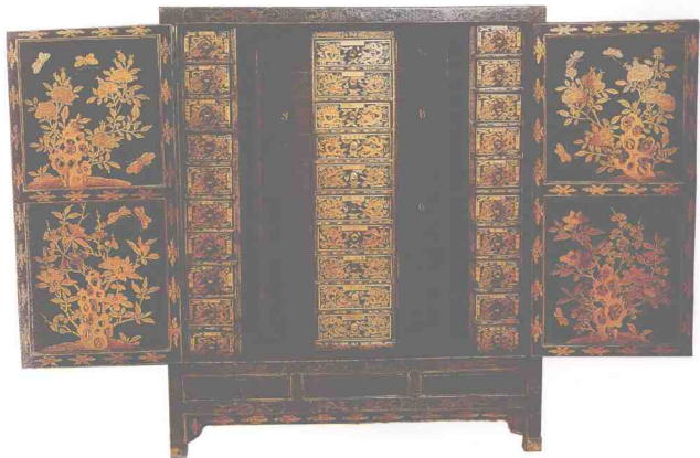
图11 明代黑漆描金药柜（故宫博物院藏，引自《中国历代艺术·工艺美术篇》）