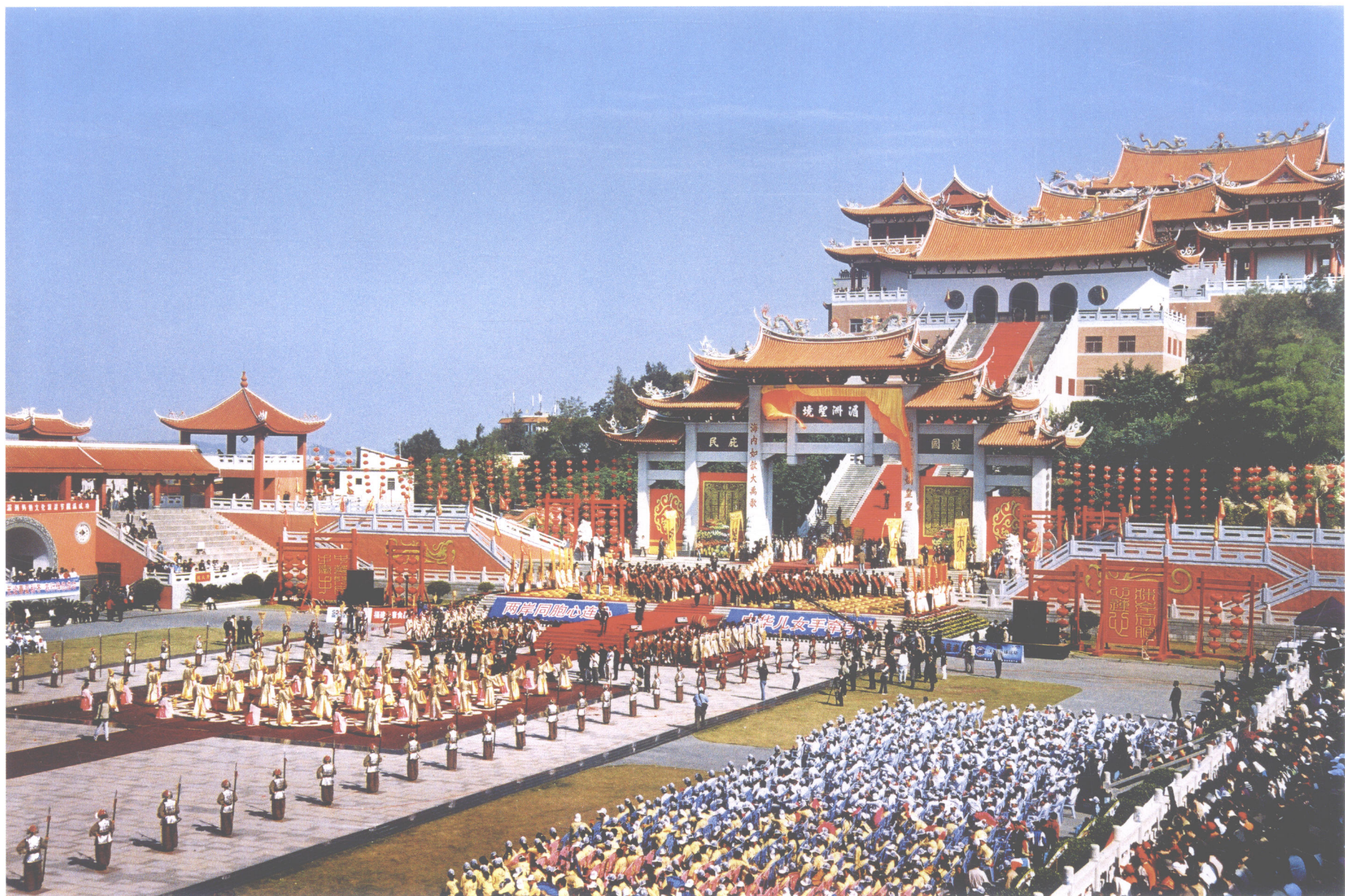
【盛大的妈祖祭祀活动】

湄洲妈祖信仰习俗入选第一批国家级非物质文化遗产名录。妈祖助人为乐、救苦济难，是宋代至高无上的海上女神。为纪念妈祖，元明清朝廷均颁布谕祭，每逢农历三月廿三为妈祖诞辰、九月初九为妈祖升天纪念日，湄洲岛都会举行隆重的纪念妈祖庆典活动。