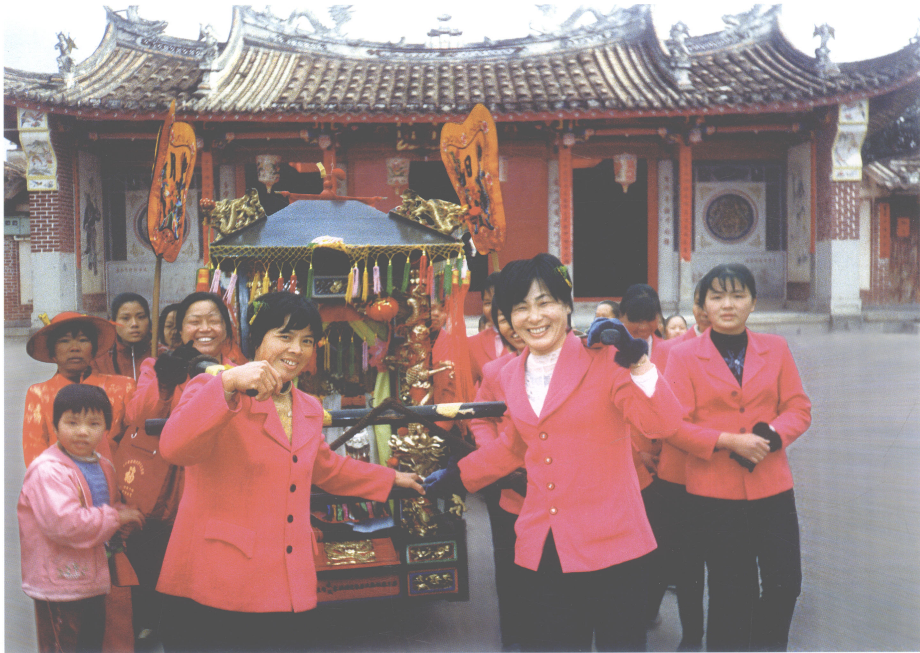
【妈祖回娘家】

妈祖回娘家祭祀民俗列入第二批福建省非物质文化遗产名录。妈祖回娘家是莆田市秀屿区贤良港天后祖祠流行近千年的独特民俗。港里村因女神妈祖诞生于此而出名。“妈祖回娘家”是一种由祖祠分香的官庙、或认同贤良港祖祠为原祖的官庙到港里妈祖祖祠来朝圣、进香，祖祠举行盛大祭礼的一种民俗活动。