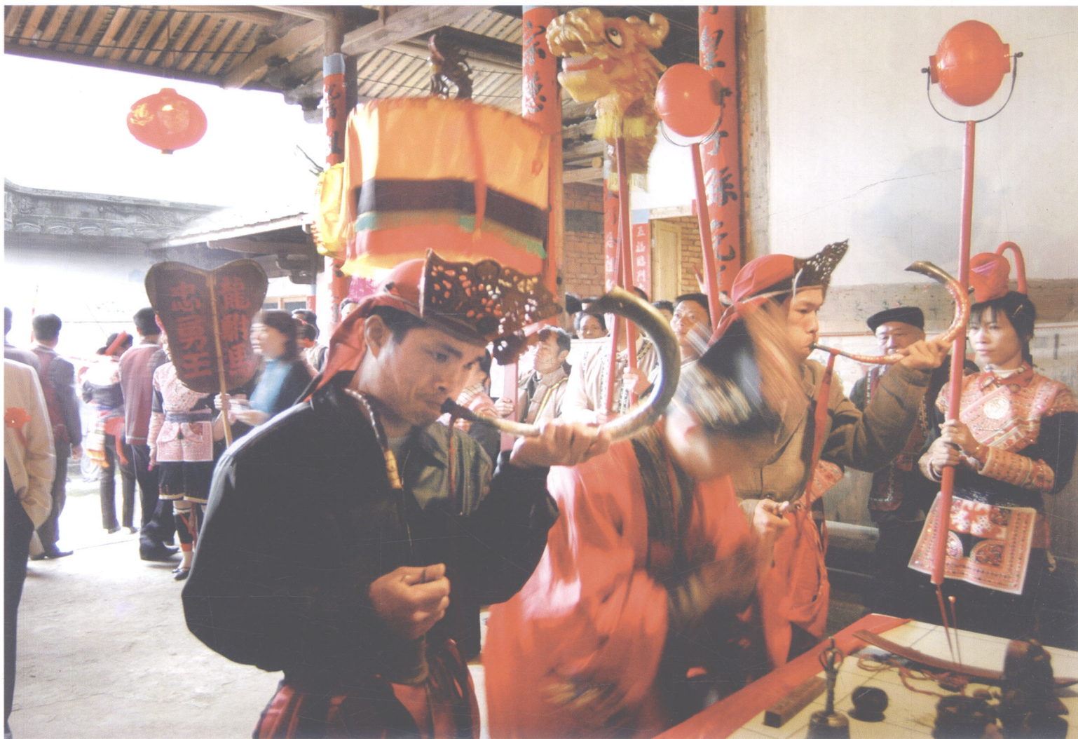
【畬族风情】（组照）