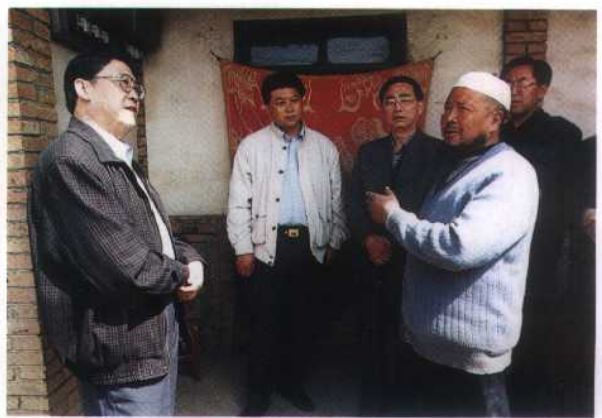
16. 1999年4月23日，青海省副省长苏森在大通县药草、板乐两乡视察农村电网改造工程