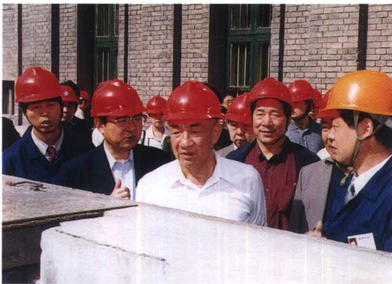
7. 1999年5月10日，全国人大副委员长邹家华视察西安灞桥热电厂除灰水的回收系统，连声称赞回收水的水质很好