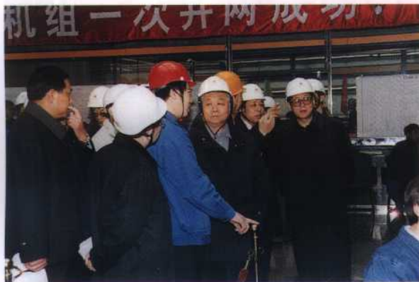
11. 国家经贸委主任盛华仁视察辽宁绥中发电厂