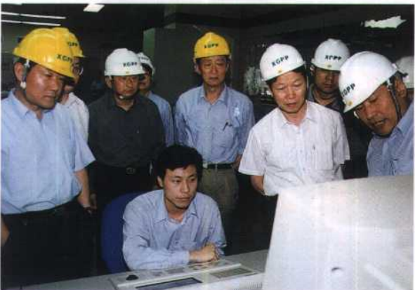
17. 国家经贸委副主任李荣融在南京下关电厂视察