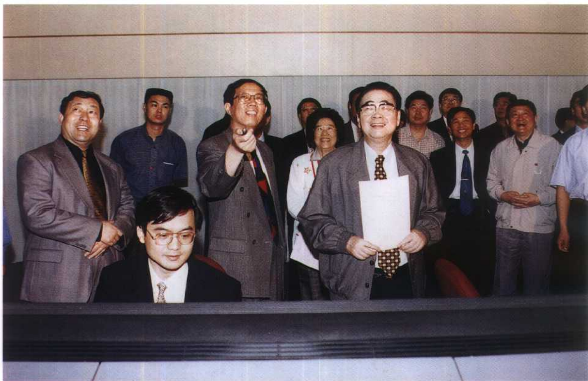
3. 1999年5月15日，李鹏委员长视察山东电网调度中心