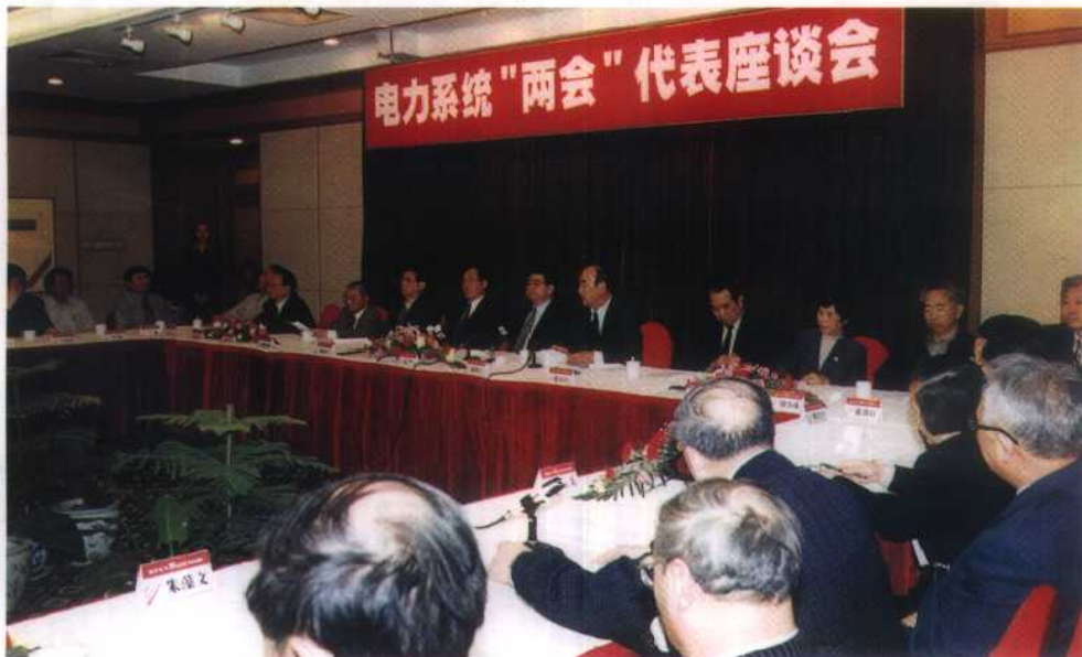
25. 1999年3月10日, 国家电力公司邀请电力系统全国人大代表和全国政协委员座谈