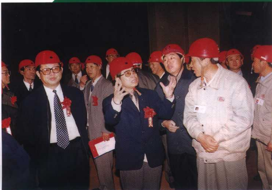
10. 高严总经理、张国光省长视察辽宁电网