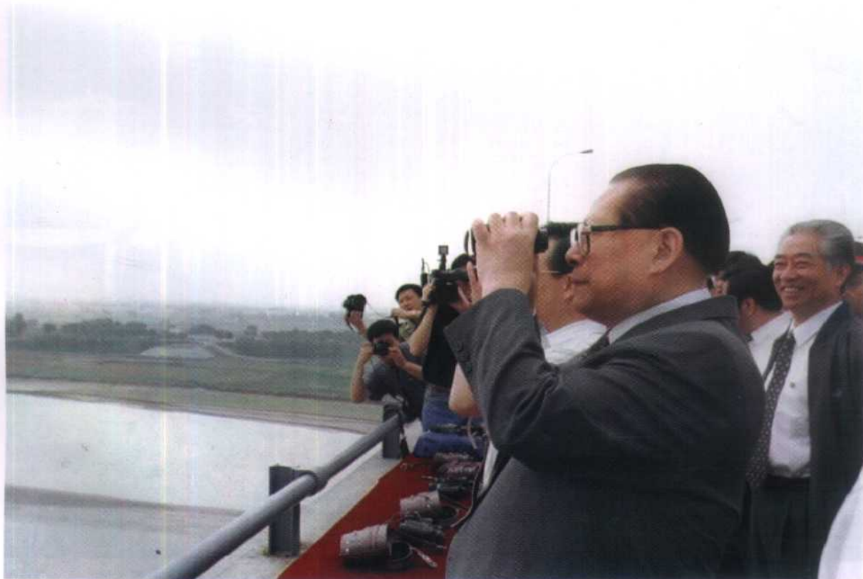
2. 1999年6月，国家主席江泽民行程数千公里，视察黄河的治理与开发情况