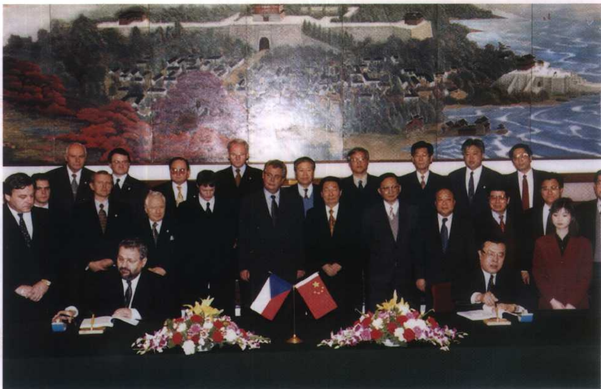
4. 1999年12月16日，山西神头第二发电厂进口捷克 2 \times 500\text{MW} 发电机组签字仪式在人民大会堂举行，国务院总理朱镕基和捷克总理米洛什·泽曼出席签字仪式