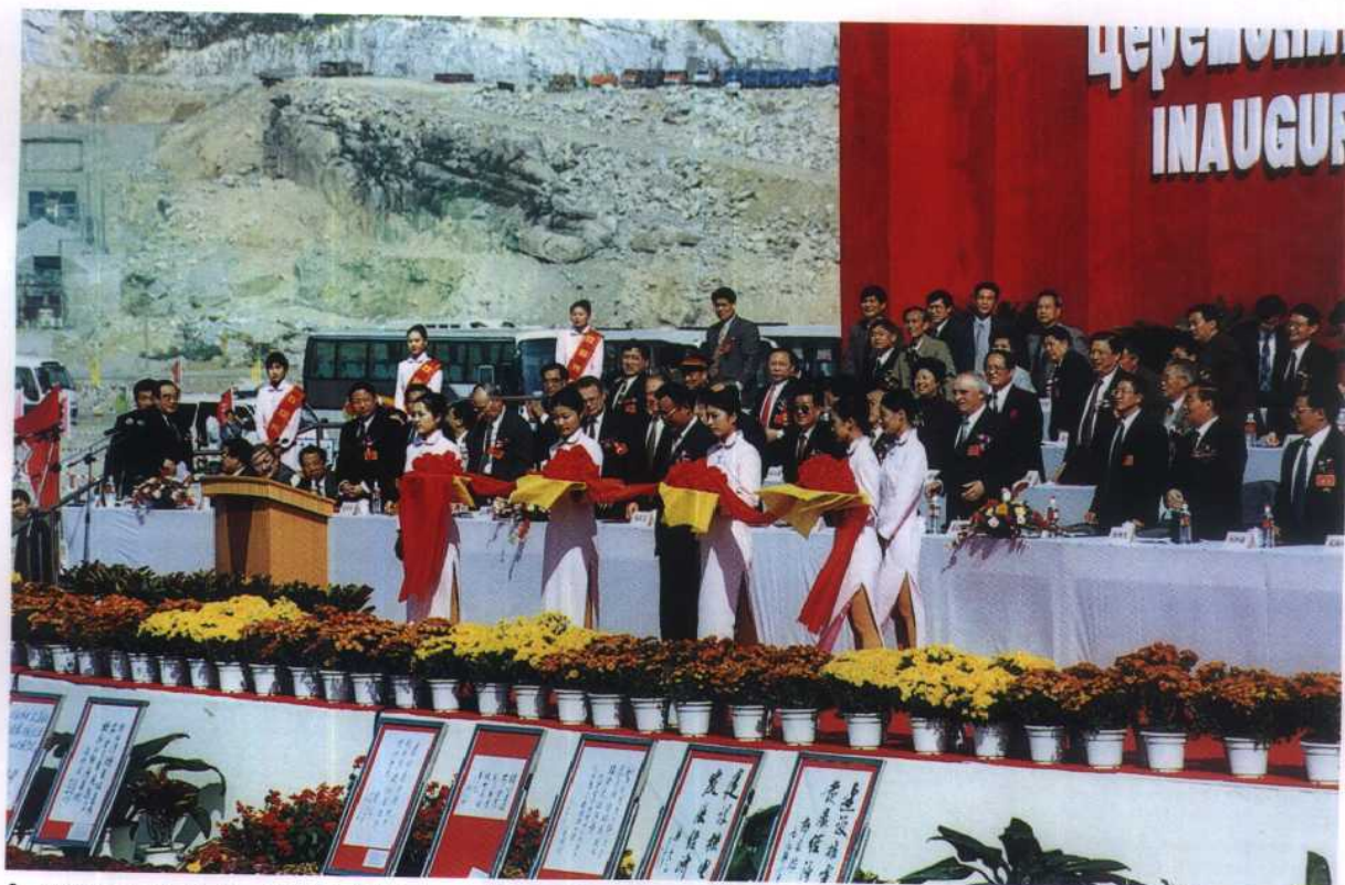
6. 1999年10月20日, 吴邦国副总理为田湾核电站(2×1000MW)开工剪彩