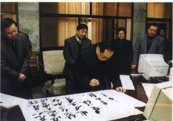
19. 1999年春节，内蒙古自治区政府主席云布龙到电力公司慰问节日期间坚持生产的职工并题词