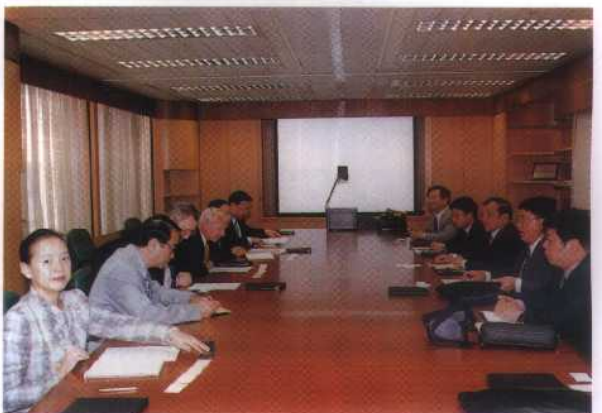
18. 1999年11月，国家经贸委副主任石万鹏访问香港中电控股有限公司