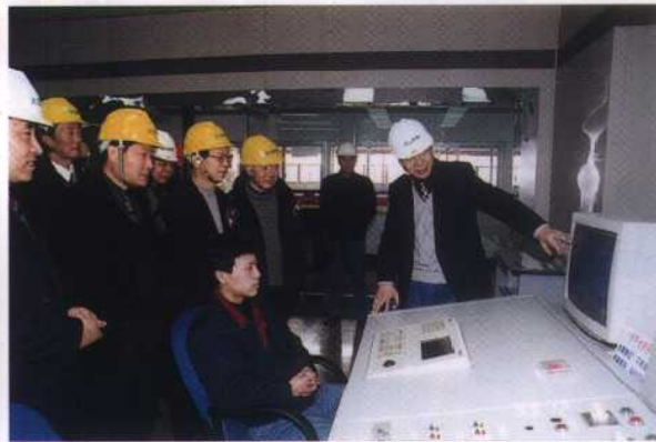
12. 实施烟气脱硫的南京下关发电厂通过竣工验收, 江苏省副省长陈必亭等在控制台前了解运行情况