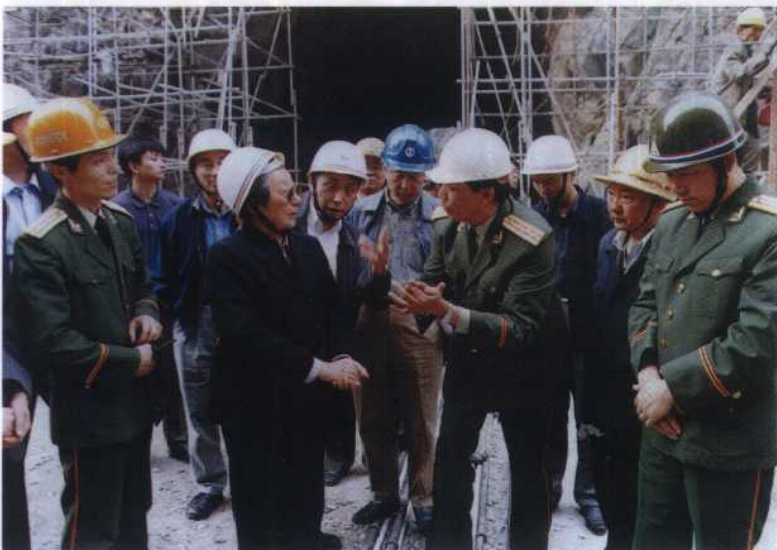
9. 1999年3月24日，全国政协副主席钱正英在三峡永久船闸闸室了解武警水电部队施工情况