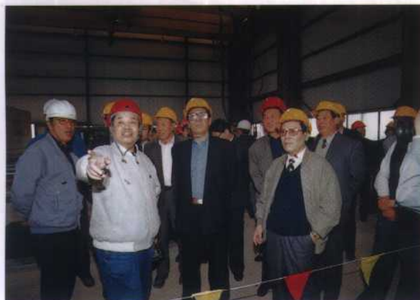
13. 1999年4月15日, 山西省副省长薛军等领导到阳城电厂工地现场办公