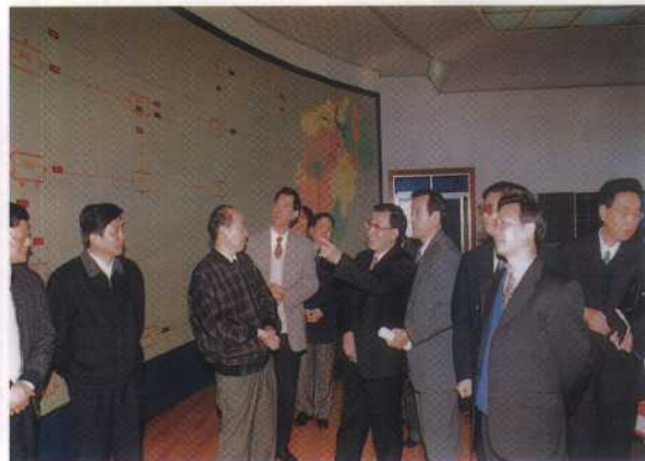
14. 1999年春节, 江西省省长舒圣佑、副省长朱英培等到省调通局慰问节日期间坚守生产岗位的电力职工