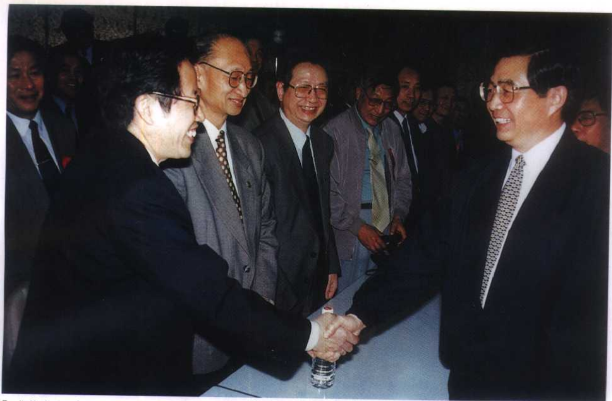
5. 胡锦涛副主席视察中国水利水电科学院并会见水利水电科技工作者