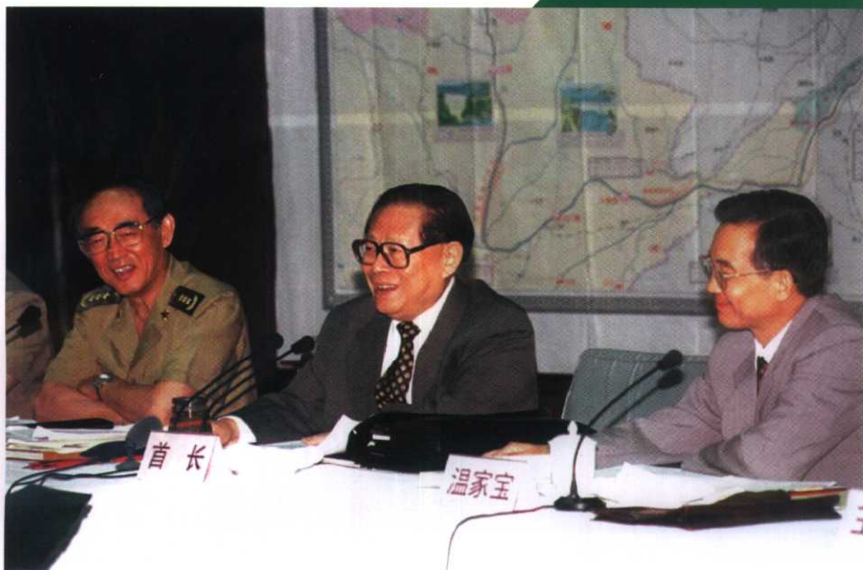
1. 1999年6月21日，国家主席江泽民主持召开黄河治理开发工作座谈会