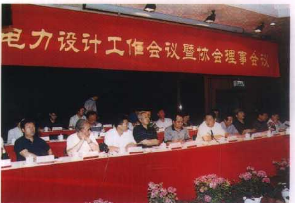
20. 1999年7月15日，全国电力设计工作会议暨协会理事会议在天津召开，国家电力公司周大兵副总经理等领导出席了会议。这次会议后，电力规划设计行业的管理职能由电规院移交给协会承担