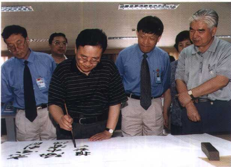
8. 全国政协副主席李贵鲜考察山东黄岛电厂海水淡化工程后，欣然题词：“充分利用海水资源，推动电力事业发展”