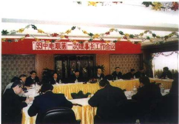
24. 1999年2月27日, 中国电力企业联合会在上海召开了本年度第一次理事长工作会议