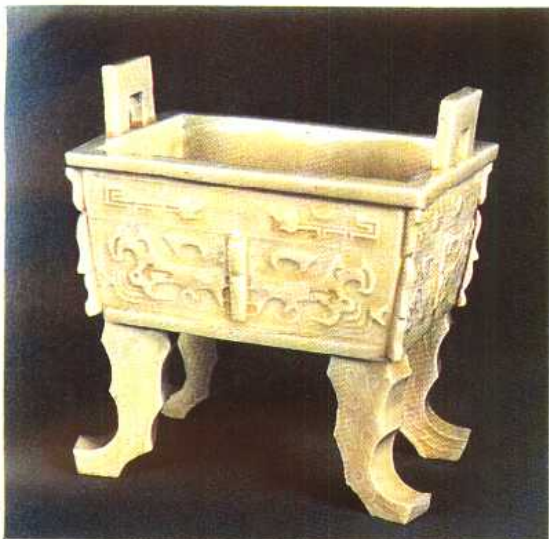
(明)白釉双耳四足方鼎