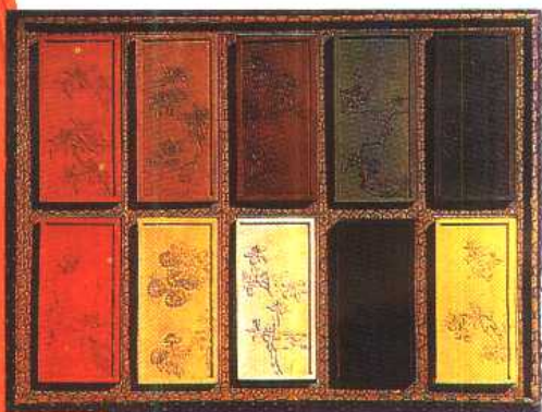
(清)乾隆御詠名華(花)詩十色墨，一面為花紋，一面為題字