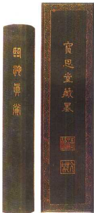
(清)康熙 55 年制墨，一面有《臨池真賞》字，一面有《寶恩堂藏墨》字，下鈐《清玩》、《人生一樂》二印