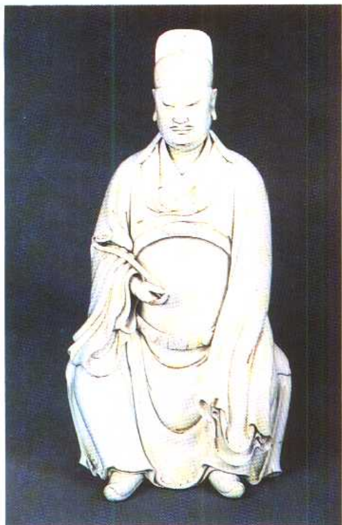
(明)白釉文昌帝君像