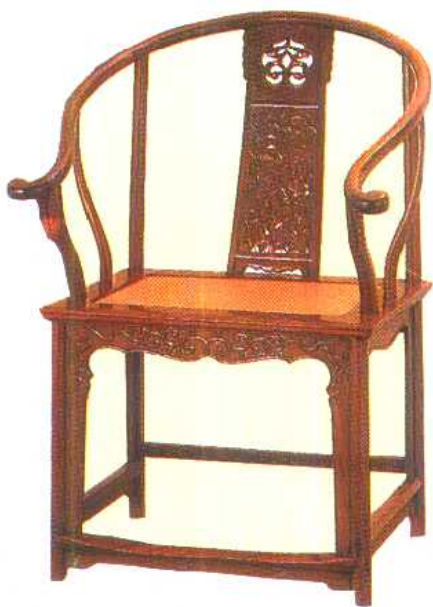
(清)黄花梨木精工 明代形制圈椅 (拍卖参考价: 50~60万港币)