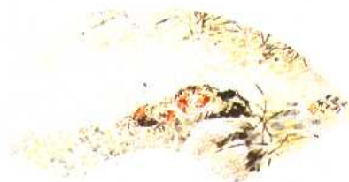
1. (清)蝴蝶扇面 温幼菊