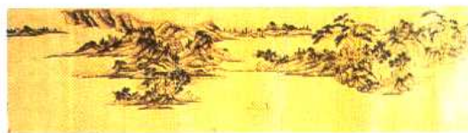
2. (明)文徵明 溪山无尽 图 (拍卖参考价:11 万美金)