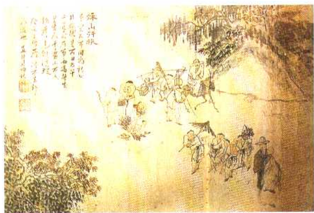
(清)秋山行旅 苏六明