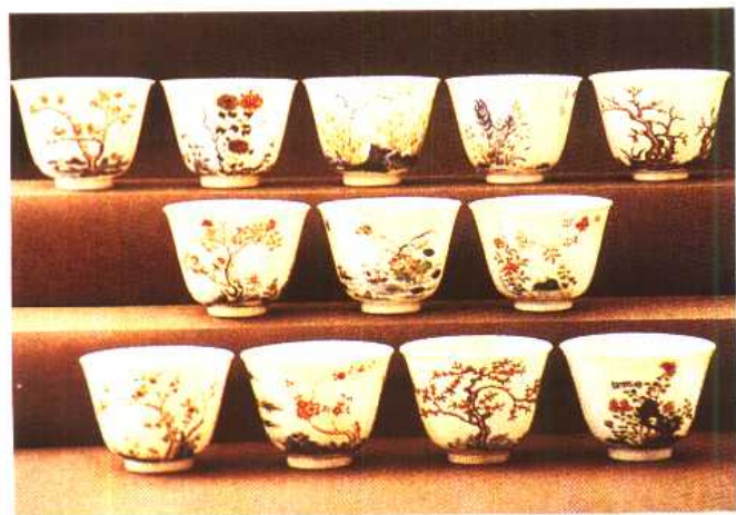
(清)五彩十二花神杯