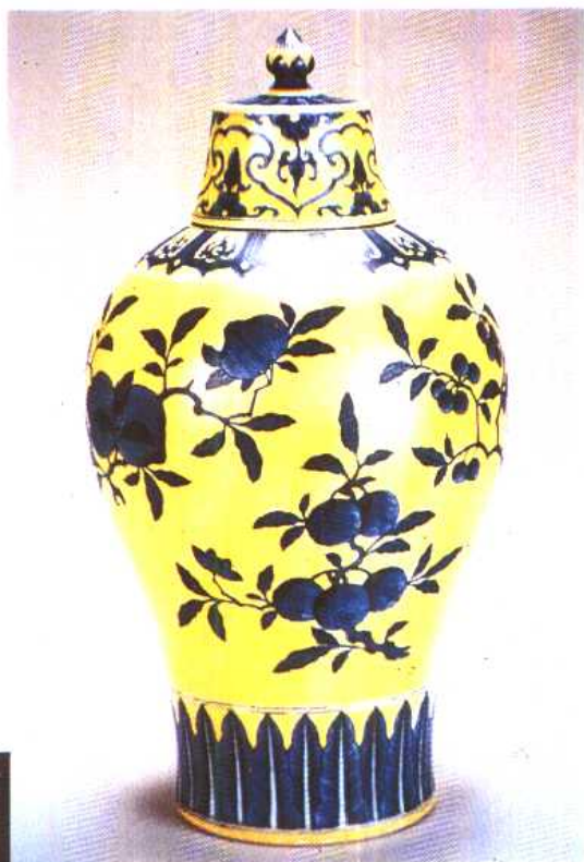
(明)僧帽壶瓷器 (五十便士购入,1.2万英镑卖出)