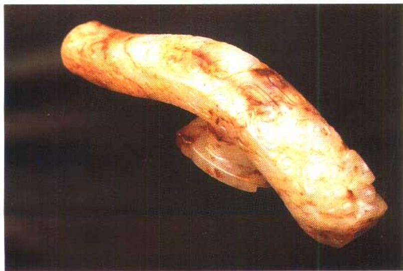
(宋)兽面蝉钮白玉带钩