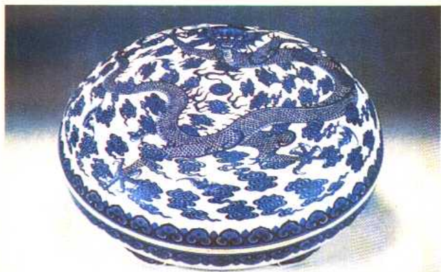
(清)珐琅彩花卉纹盘