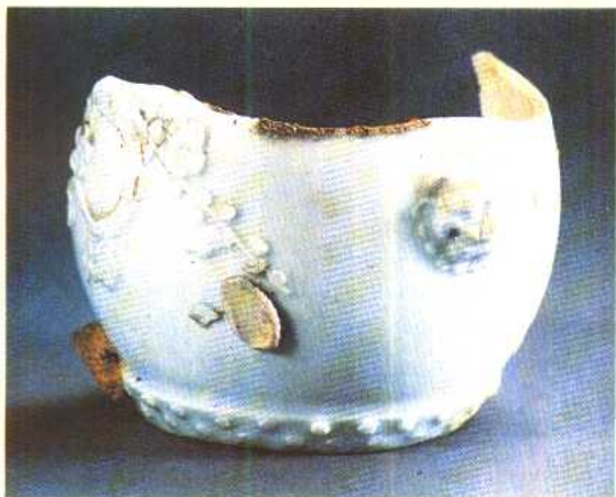
(清)白釉贴花鼓形器残片