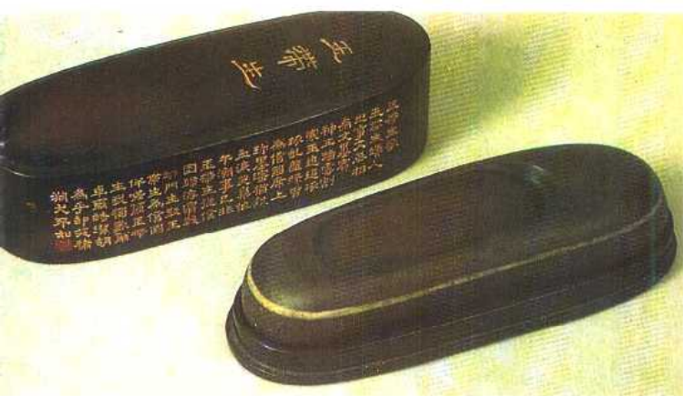
(宋)文天祥銘玉帶生硯，附墨漆盆。相傳為文天祥所用