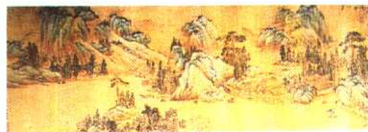
3. (明)文徵明 山水书法 设色绢本 手卷 (拍 卖参考价:3.2万美金)