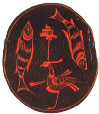
(秦)漆盂,内彩绘鱼鸟图