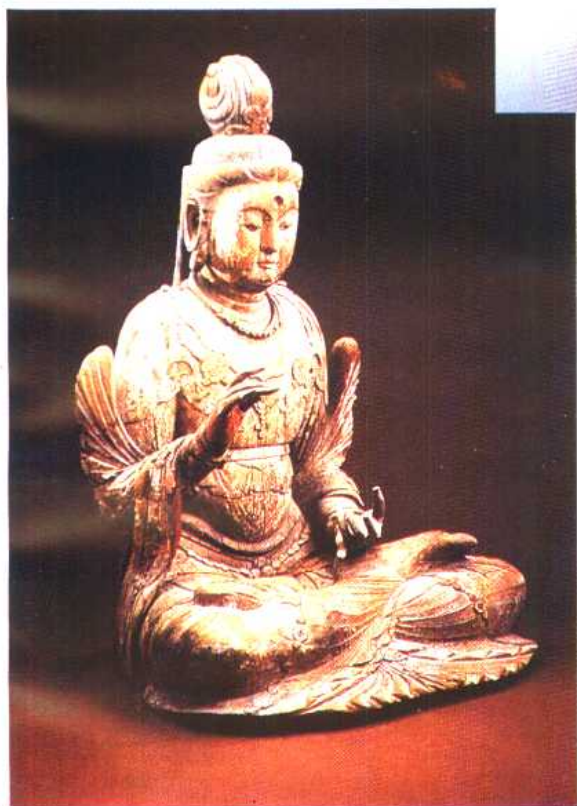
木雕观音 (拍卖参考价: 44万美元)