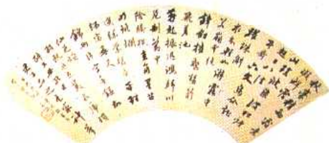
2. (清)行书扇面 梁同书