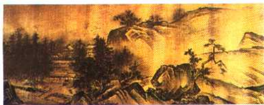
1. (明)无名氏仿宋代夏圭 溪山清远 水墨绢本