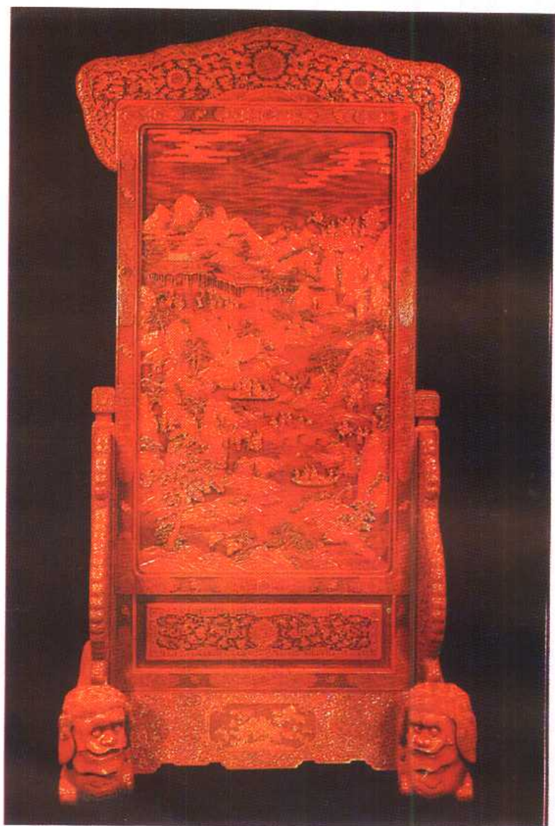
(清)雕漆大屏风 高 208 公分,雕工精细,极具立体感。(拍卖参考价:70~90 万港币)