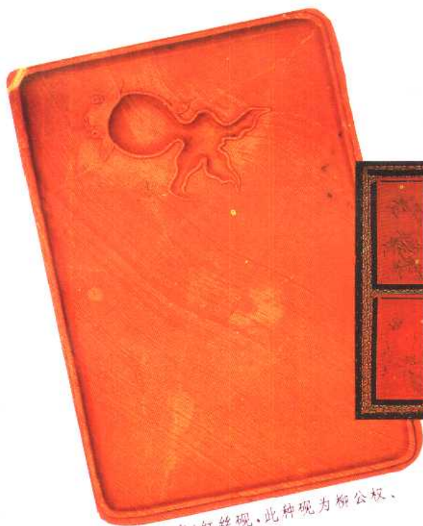
(唐)紅絲硯，此種硯為柳公權、南唐后主所厚愛