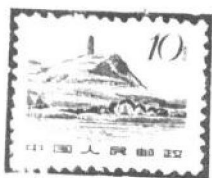
11 \times 11\frac{1}{2} 光齿

第二次发行组(6枚), (俗称文革追加组): 齿孔度数 11 \times 11\frac{1}{2}^{\circ} , 光齿(俗称光齿票)。(如图9)