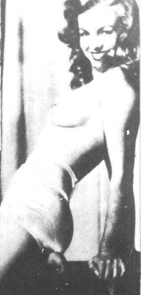
● 玛丽琳·梦露楚楚动人的玉照