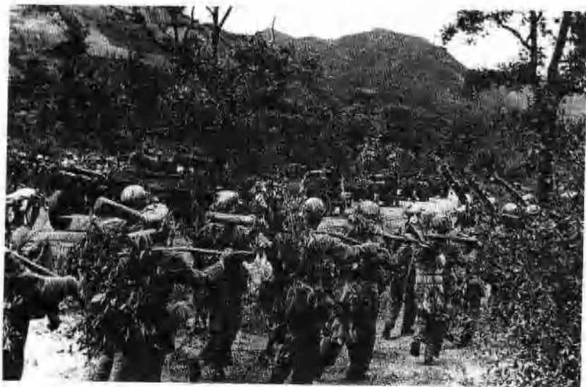
志愿军向前线开进。

1950年10月8日，毛泽东签署组成中国人民志愿军的命令。告知金日成，中国决定出兵朝鲜。