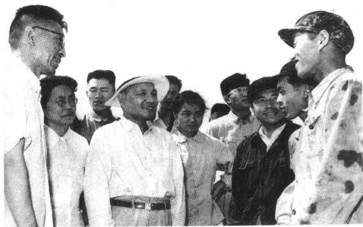
⑥ 1963年8月邓小平视察大庆油田时与工人亲切交谈