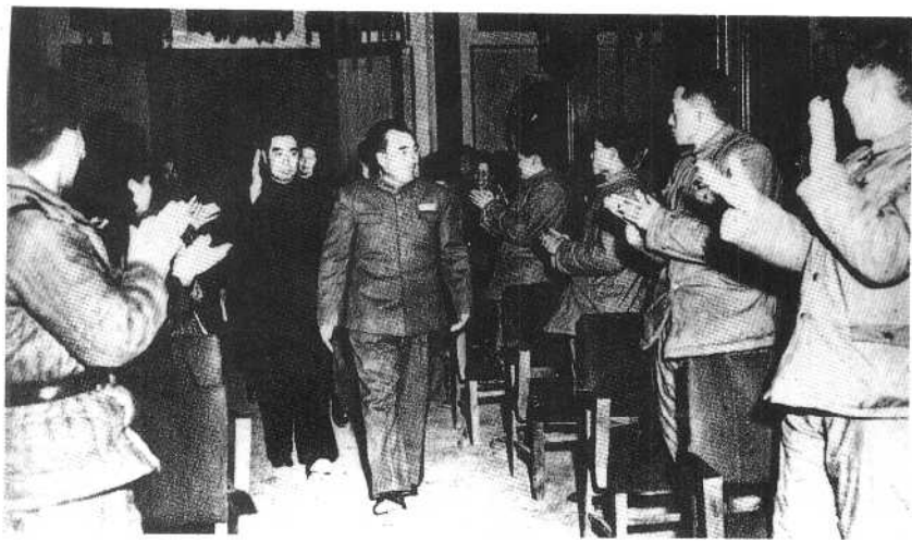
② 1952年朱德、周恩来接见朝鲜人民访华团和中国人民志愿军归国代表团