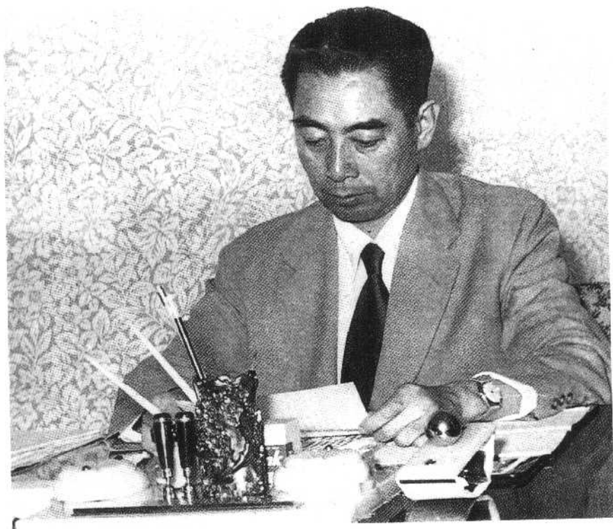
④ 1955年周恩来与印度总理尼赫鲁共同倡导和平共处五项原则。图为周恩来在万隆会议住地办公。