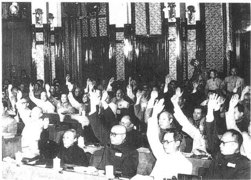
⑦ 1954年6月14日中央人民政府委员会一致通过《中华人民共和国宪法草案》