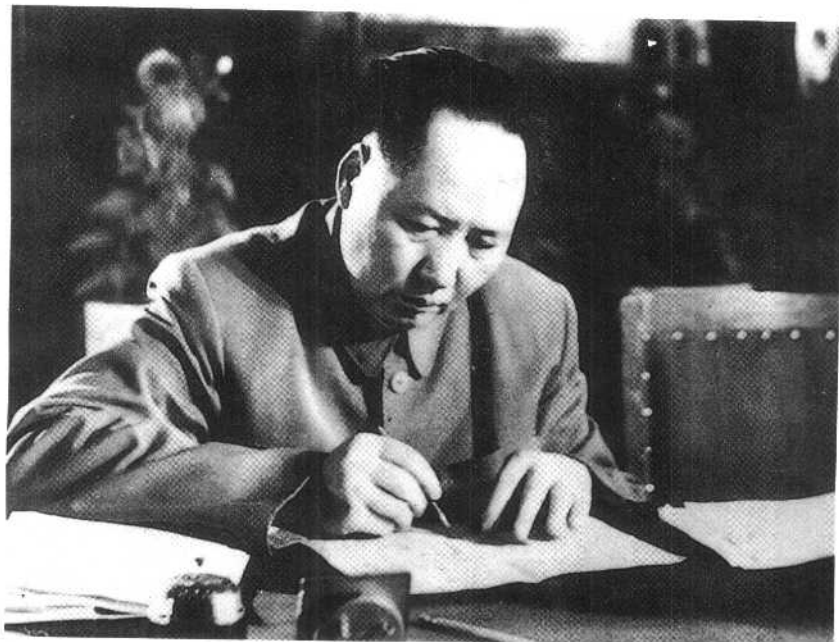
① 1955年9月至12月毛泽东主持编辑《中国农村的社会主义高潮》一书， 并为此书写了两篇序言及104条按语。