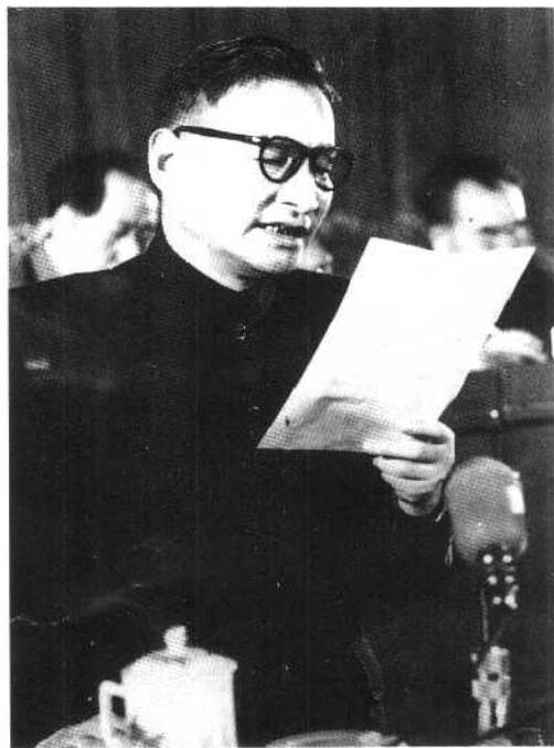
⑤ 1955年3月陈云在中国共产党全国代表会议上作报告