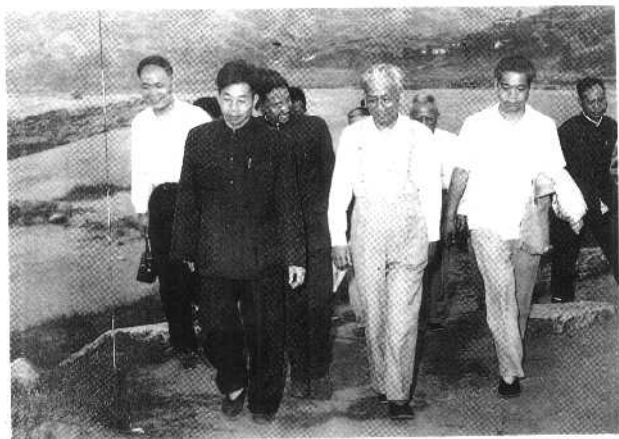
③ 1960年5月刘少奇在长江三峡察看地形