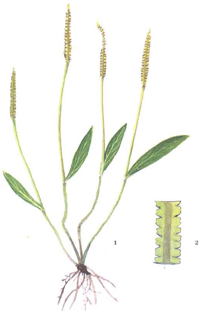
图1 狭叶瓶尔小草 1. 全株 2. 孢子叶 (放大)