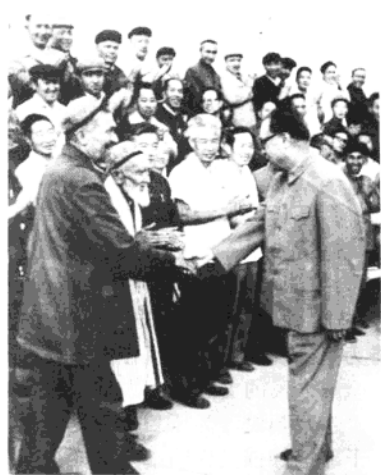
赵紫阳总理和喀什各族干部群众在一起

赵紫阳强调要加强团结，进一步发展新疆的大好形势。他说，加强民族团结是新疆第一位的大事，是搞好各项工作的关键。在新疆，任何时候、任何地方，离开了这个关键，一切工作都无从谈起。今后要开发新疆，建设新疆就必须继续发展这种安定团结的大好形势。要