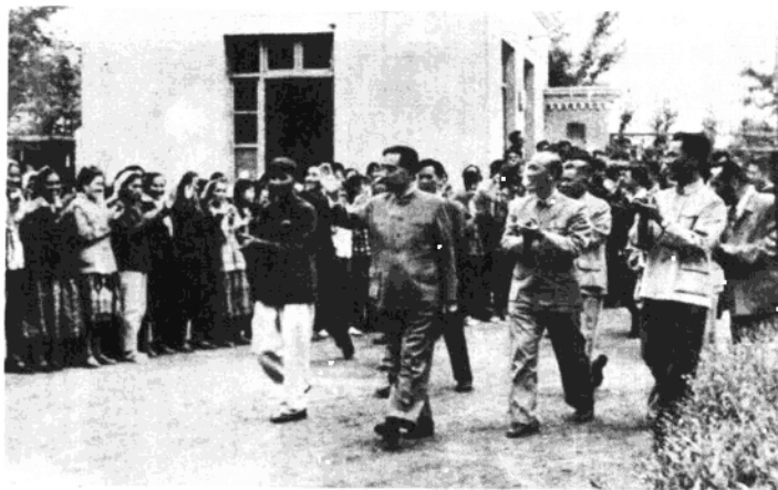
敬爱的周恩来总理来喀什视察

1985年是新疆维吾尔自治区成立30周年。回顾三十年来走过的道路，喀什各族人民永远忘不了党中央的亲切关怀。