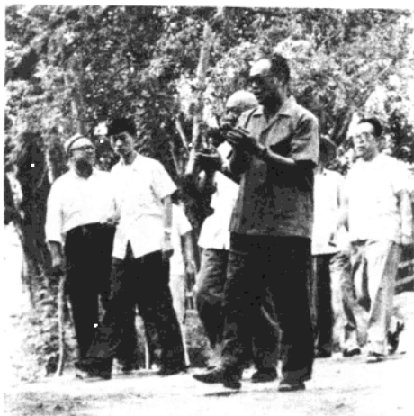
赵紫阳总理在喀什农村

赵紫阳指出，开发大西北中：新疆处于优先的地位，应当作为一个单独的经济区域来考虑。这不仅因为新疆在国防上战略地位重要，而且在经济上在我国“四化”建设中有着许多得天独厚的优越条件。他说，新疆是祖国“四化”建设中尚待开发的一块宝地，根据新疆的优势，展望新疆的前景，有理由认为新疆可能成为国家未来一个重要的畜产