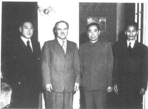
▲日内瓦会议期间,中、苏、朝等国代表密切合作,重挫了美国等西方国家代表的嚣张气焰。图为周恩来和莫洛托夫(左二)、朝鲜外务相南日(左一)、越南外交部部长范文同(左四)合影。