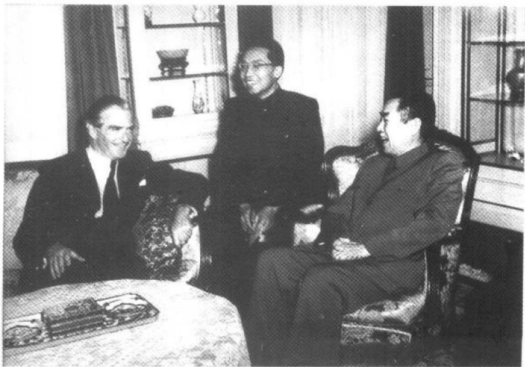
▼日内瓦会议两主席之一——英国外交大臣安东尼·艾登前往中国代表团驻地拜会周恩来。