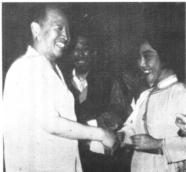
1964年彭真同志观看京剧《杜鹃山》演出后，上台接见赵燕侠（饰贺湘）、马连良（饰郑老万）等