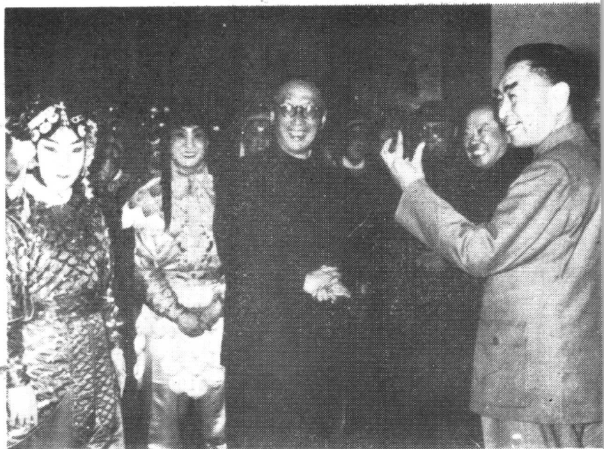
1963年周总理观看《碧波仙子》演出后，上台接见演员。 中立者马连良，总理身后站者为田汉、马彦祥、徐平羽同志