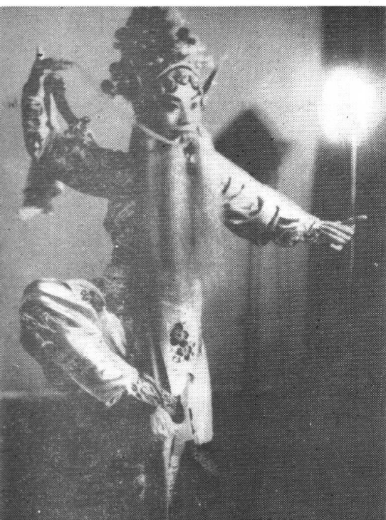
1959年演出《辛安驿》 剧照