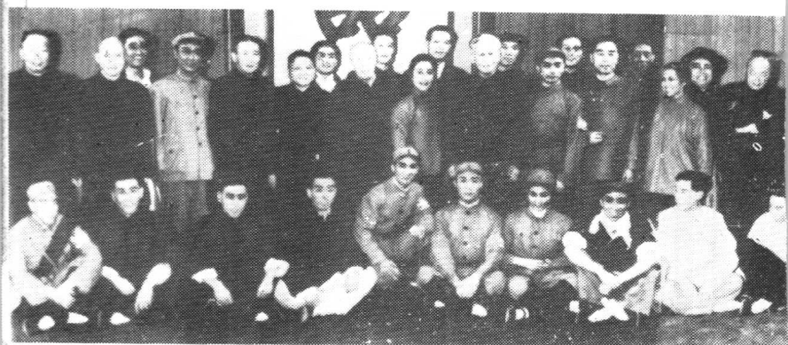
1964年7月24日《芦荡火种》演出后，刘少奇、周恩来、董必武、邓小平、陈毅、陆定一、邓子恢、聂荣臻等国家领导人上台接见全体演员时合影