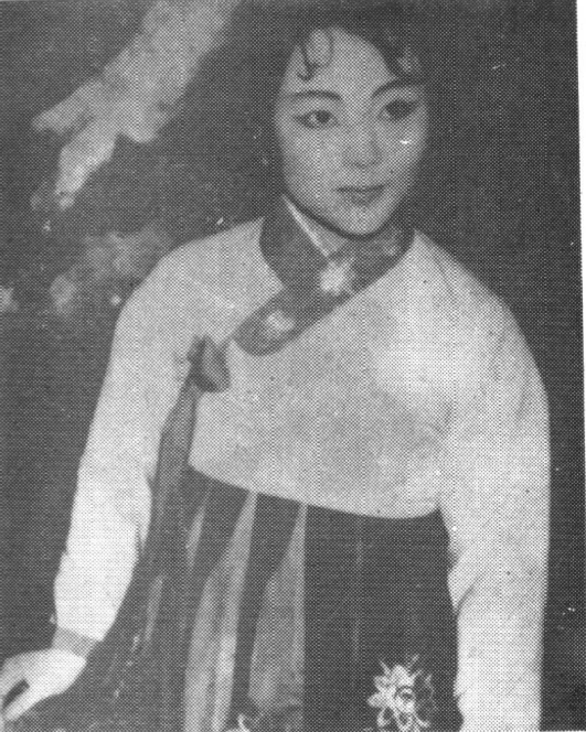
1955年演出《春香传》 剧照