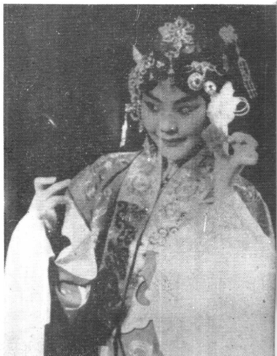
1963年演出 《碧波仙子》剧照