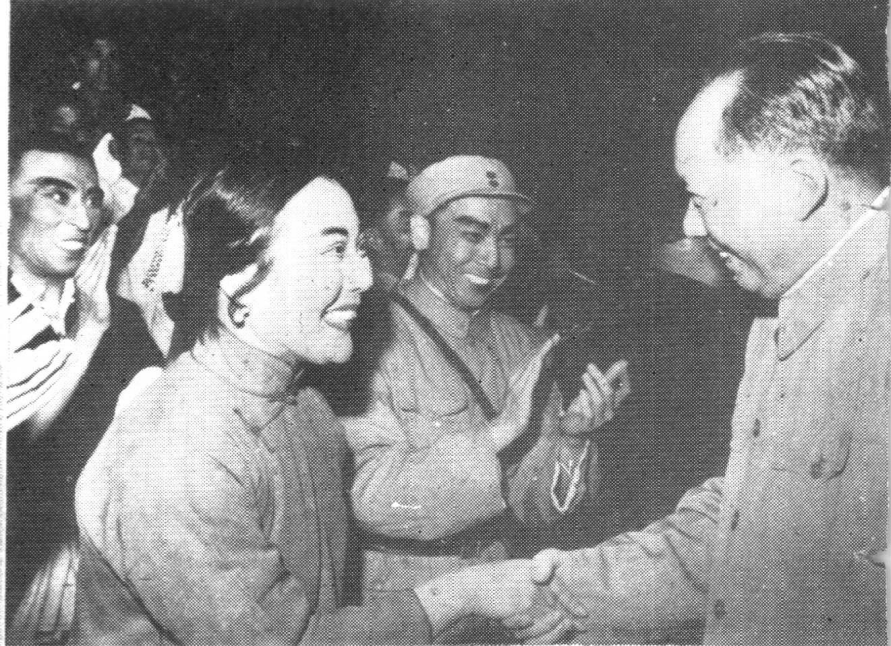
1964年毛主席观看《芦荡火种》演出后，上台接见赵燕侠