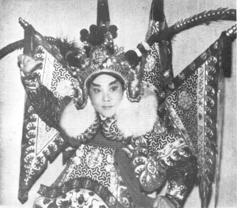
1980年演出 《大英杰烈》剧照