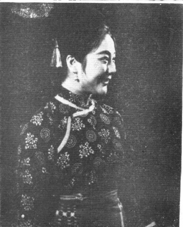
1964年扮演阿庆嫂剧照