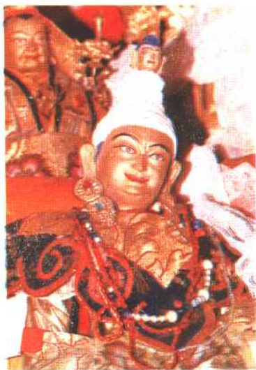
② 吐蕃著名赞普松赞干布（?—650）塑像