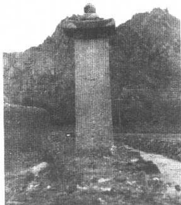
⑧ 赤德松赞赞普墓碑 （公元9世纪立）