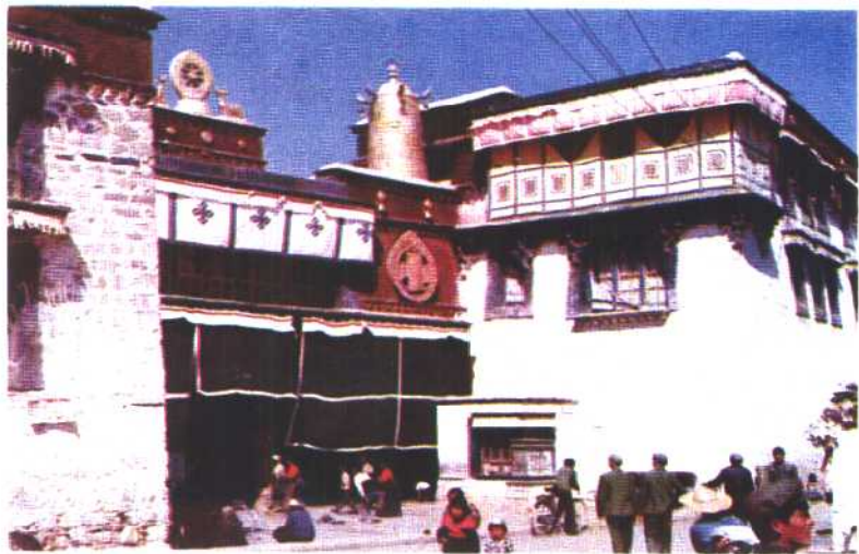
④ 大昭寺 (公元7世纪始建, 历代增修)