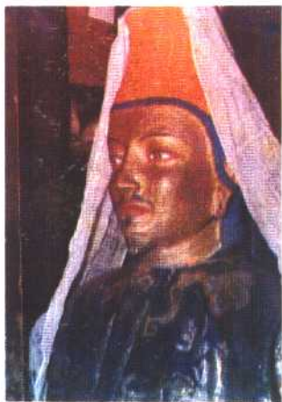
③ 吐蕃名相禄东赞 (? —667) 塑像