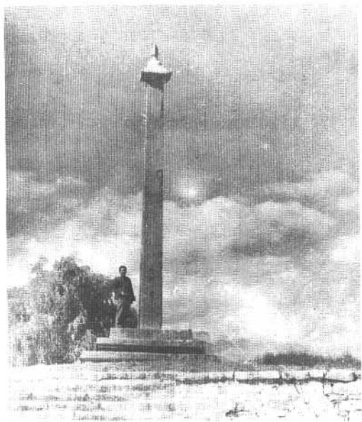
⑦ 恩竺·达札路恭 纪功碑（公元764 年立，现存于拉萨 布达拉宫前）