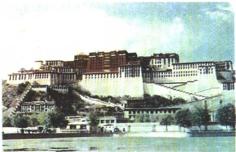
① 布达拉宫（公元7世纪始建，历代增修）