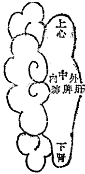
图 I-1 耳背分属五脏图

系，如《灵枢·经脉》指出：“小肠手太阳之脉……，其支者，从缺盆循颈上颊，至目锐眦，却入耳中”，“三焦手少阳之脉……；其支者，……系耳后直上，出耳上角……；其支者，从耳后入耳中，出走耳前”，“胆足少阳之脉，起于目内眦，上抵头角，下耳后……；其支者，从耳后入耳中，出走耳前”，“手阳明之别，名曰偏历，……入耳合于宗脉”。这四条阳经脉络的循行路线，均入耳中。《灵枢》又言：“胃足阳明之脉……上耳前”，“膀胱足太阳之脉……其支者，从巅至耳上角”。这些经脉循行分布于耳廓周围。《灵枢》中还论述了手太阳之筋、手少阳之筋、足阳明之筋和足少阳之筋与耳的联系，如指出：手太阳之筋……结于耳后完骨”。从经脉循行的规律看，六条阳经或直入耳中或布于耳周，构成与耳的密切联系。六条阴经则通过络脉与耳相联或通过经别与阳经相合，间接上达于耳。如手足少阴、太阴、足阳明之络皆会于耳中、上络左角；手太阴之正、上出缺盆、复合于别入耳中的手阳明大肠经；足厥阴之正合于循行耳部的足少阳