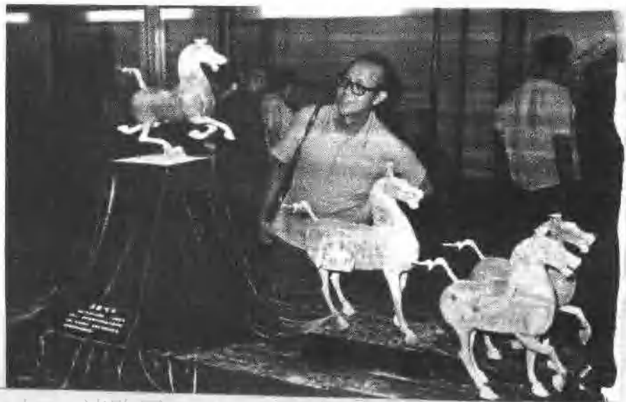
故宮博物館(北京) ASA 125 1/60 f11