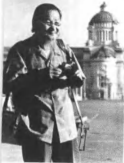
曼谷議院前 ASA 125 1/250 f8